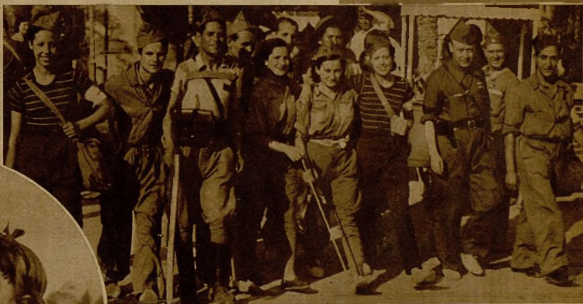
En la poderosa columna salida de Valencia hacia Madrid, para incorporarse seguidamente a uno de los frentes de combate figuran, como en todas las expediciones, varias valientes milicianas, prestas a luchar con las armas en unión de sus compañeros