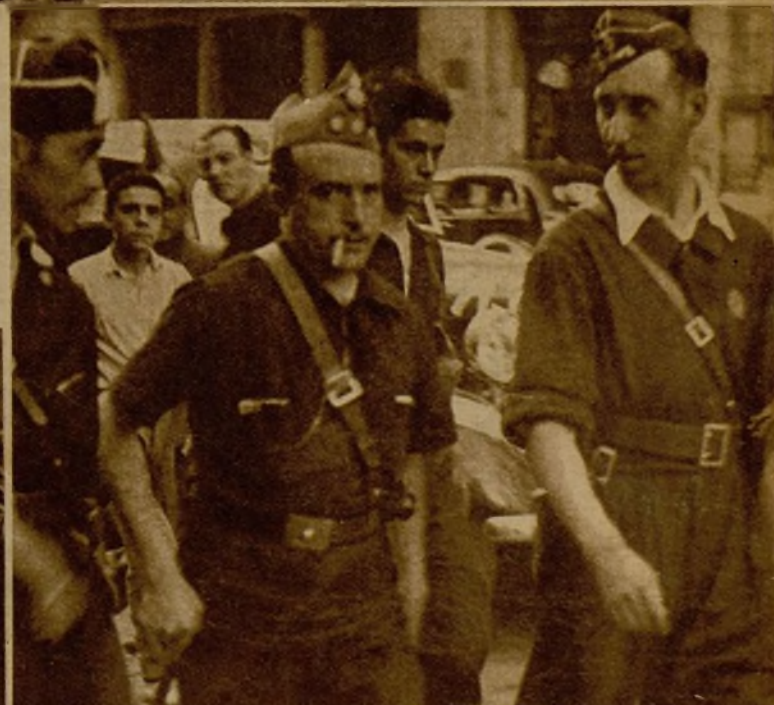
Fuerzas de la Guardia civil de Caballería que forman parte de la columna valenciana, correspondiendo al entusiástico saludo del pueblo