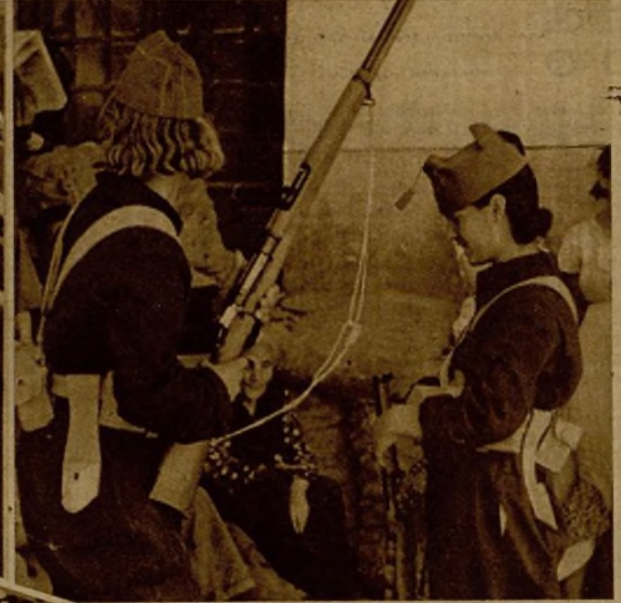
Jóvenes milicianas recogiendo su armamento para marchar con sus compañeros a la línea de vanguardia

Milicianos de la columna Octubre han localizado una concentración rebelde, amparada en un picacho, y enfilan sus fusiles contra ella →