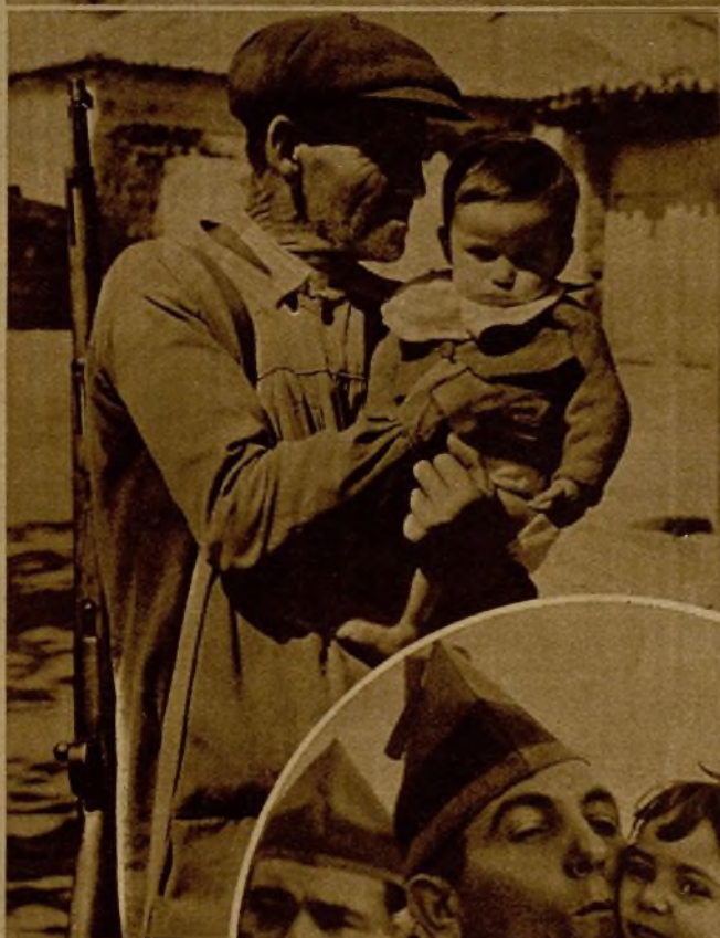
Este bravo voluntario, que a pesar de su ancianidad se lanza a la lucha contra los facciosos, se despidió de su nieto, al marchar al frente. En el círculo, un guardia civil expedicionario dando el abrazo de despedida a su hijita, momentos antes de la partida