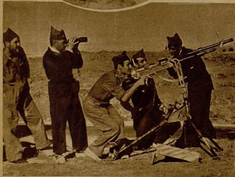
Soldados de las Millecias enfilando una ametralladora antiaérea contra un avión faccioso, al que obligaron a retirarse

Una columna formada por Guardia civil y milicianos, en marcha hacia uno de los puntos de combate, en la Sierra