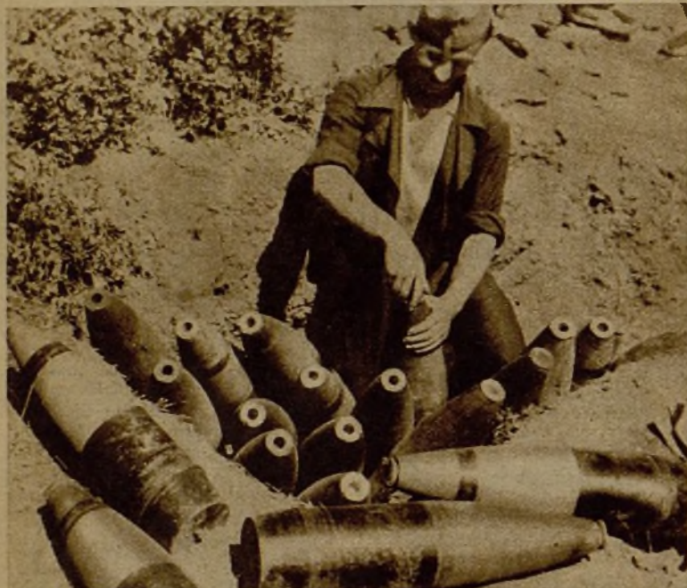
Uno de nuestros soldados de artillería colocando espoletas en las balas