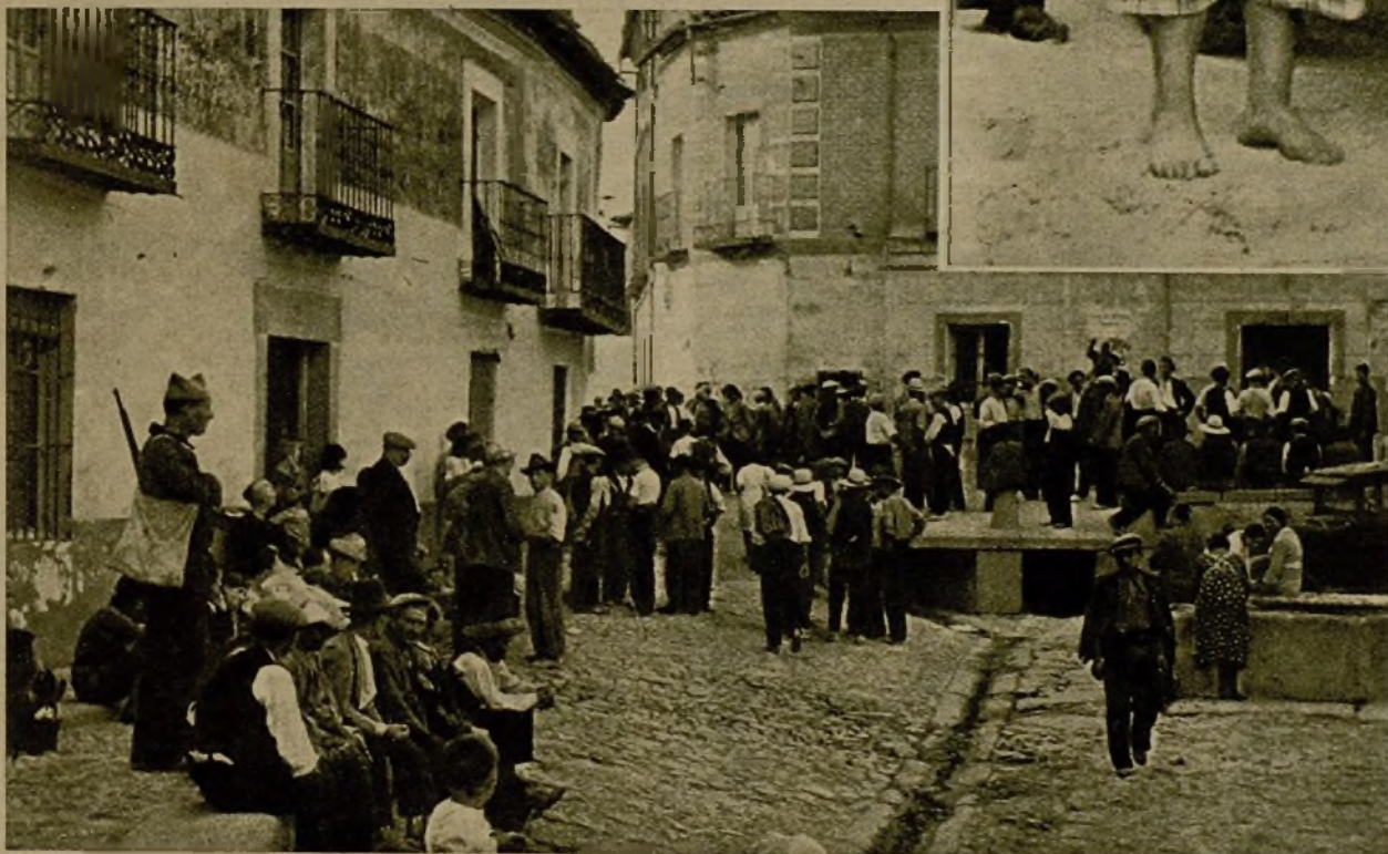
Campesinos extremeños en el pueblo de La Calzada, esperando turno para inscribirse en las Milicias populares