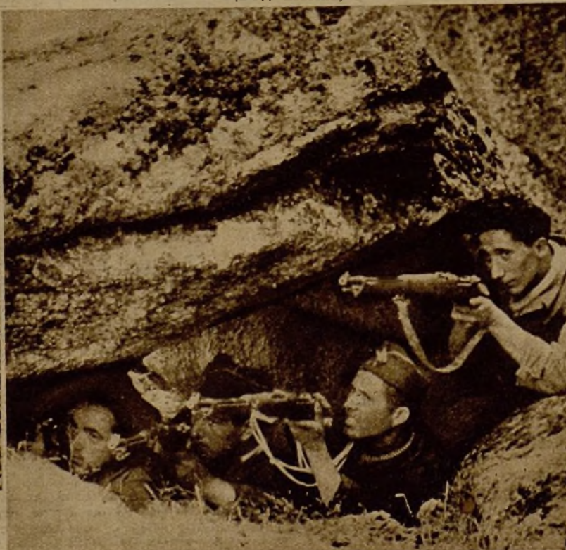
● Amparados en las cuevas naturales del terreno de la Sierra, nuestros milicianos hacen incesante fuego sobre el enemigo →