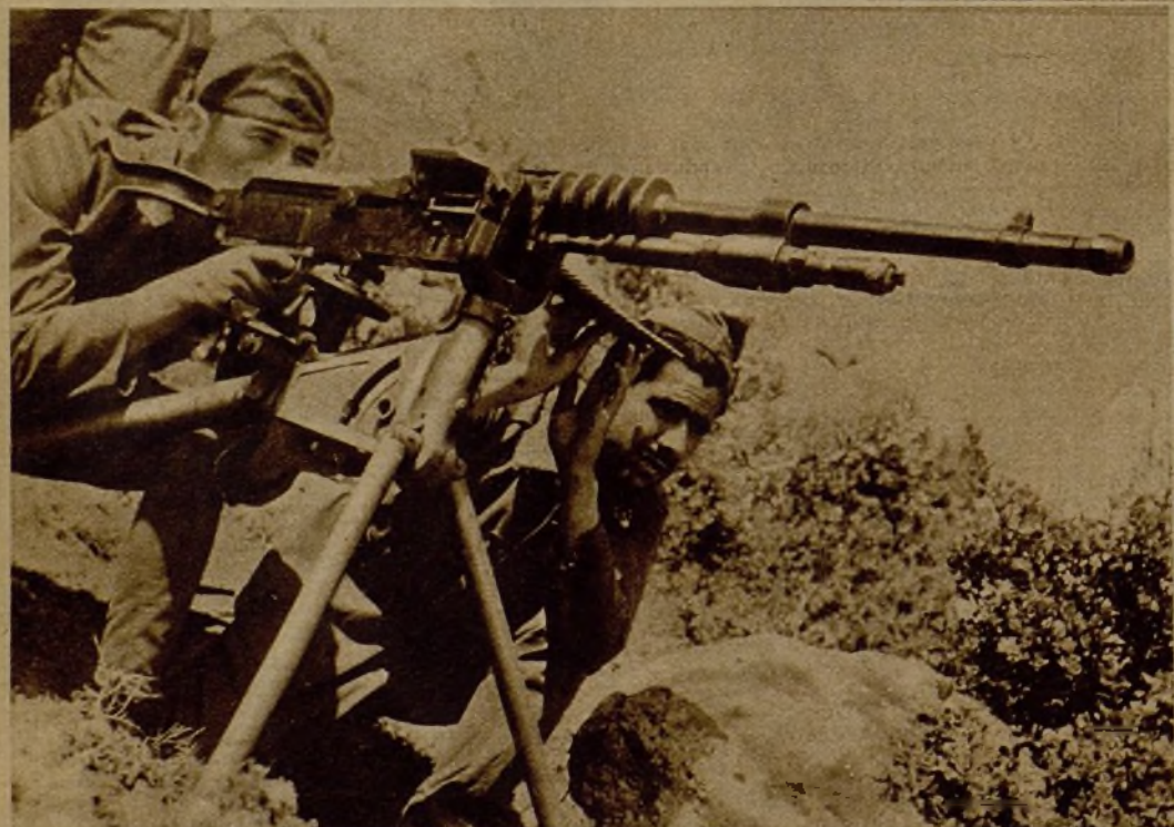
Una ametralladora, colocada en lugar estratégico en la Sierra, y bajo cuyo fuego han sido dispersadas importantes columnas facciosas