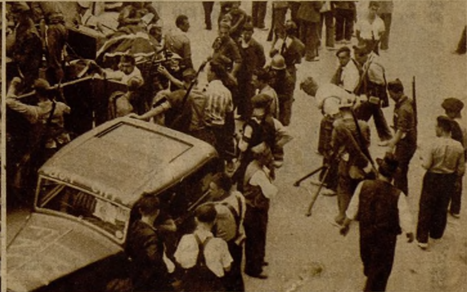
La catavaza va a marchar. En todos los pechos hay un aliento de entusiasmo. En todos los rostros una seguridad de victoria