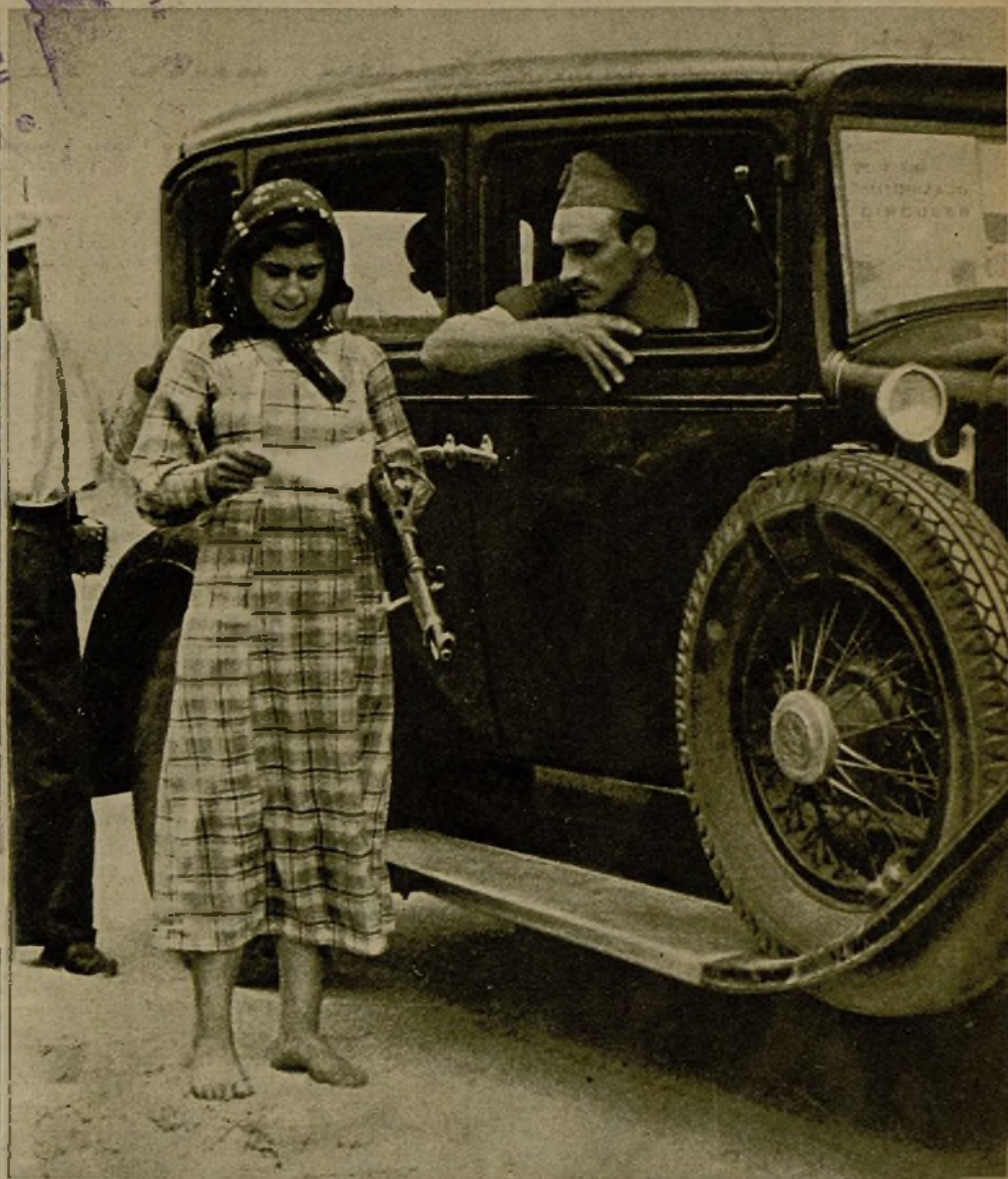
Una miliciana armada revisando la documentación de los coches camino de Extremadura.