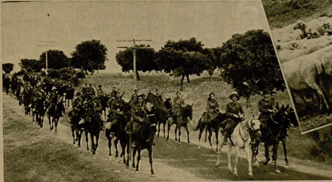
Las columnas republicanas que operan en el frente de Extremadura han logrado importantes avances y causado cuantiosas bajas al enemigo en varias victoriosas acciones. En la actualidad tienen dominados importantes puntos estratégicos, que harán que su progreso se acelere. He aquí una columna de Caballería dirigiéndose a la línea de fuego