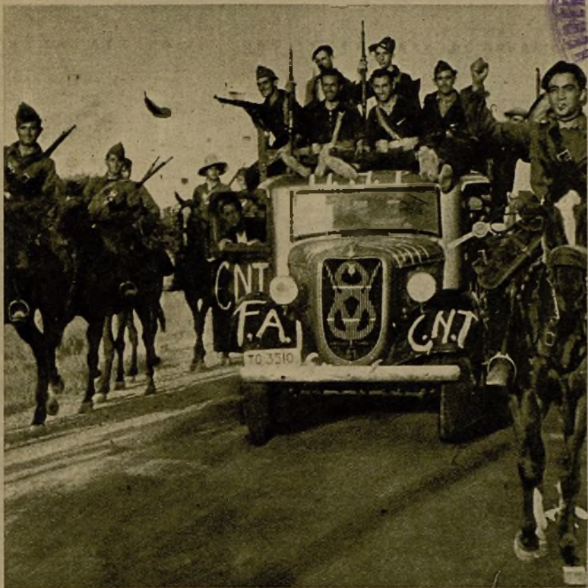
Milicianos en las avanzadas dirigiéndose a las posiciones de las que el fuego de artillería había desplazado al enemigo