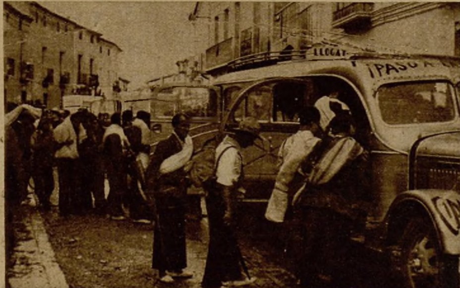
Todo es actividad... Los milicianos hacen sus últimos preparativos para marchar al frente de combate