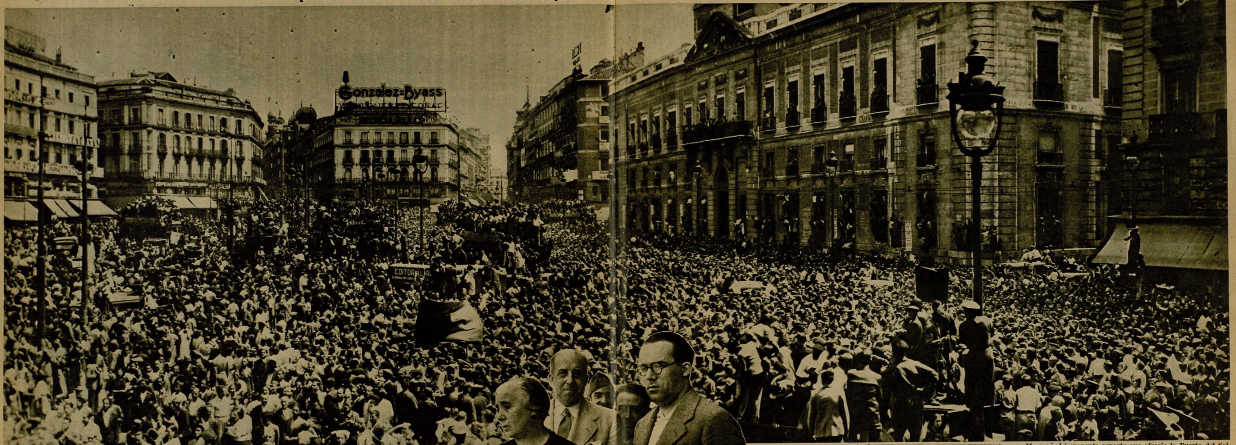
Desbordante de entusiasmo y fervor republicano ha sido el recibimiento que el pueblo de Madrid ha tributado a las heroicas tropas de la primera compañía de la columna del coronel Mangada, llegada ayer. Una inmensa muchedumbre efervorizada aclamó con inmenso júbilo admirativo a los defensores de la República.