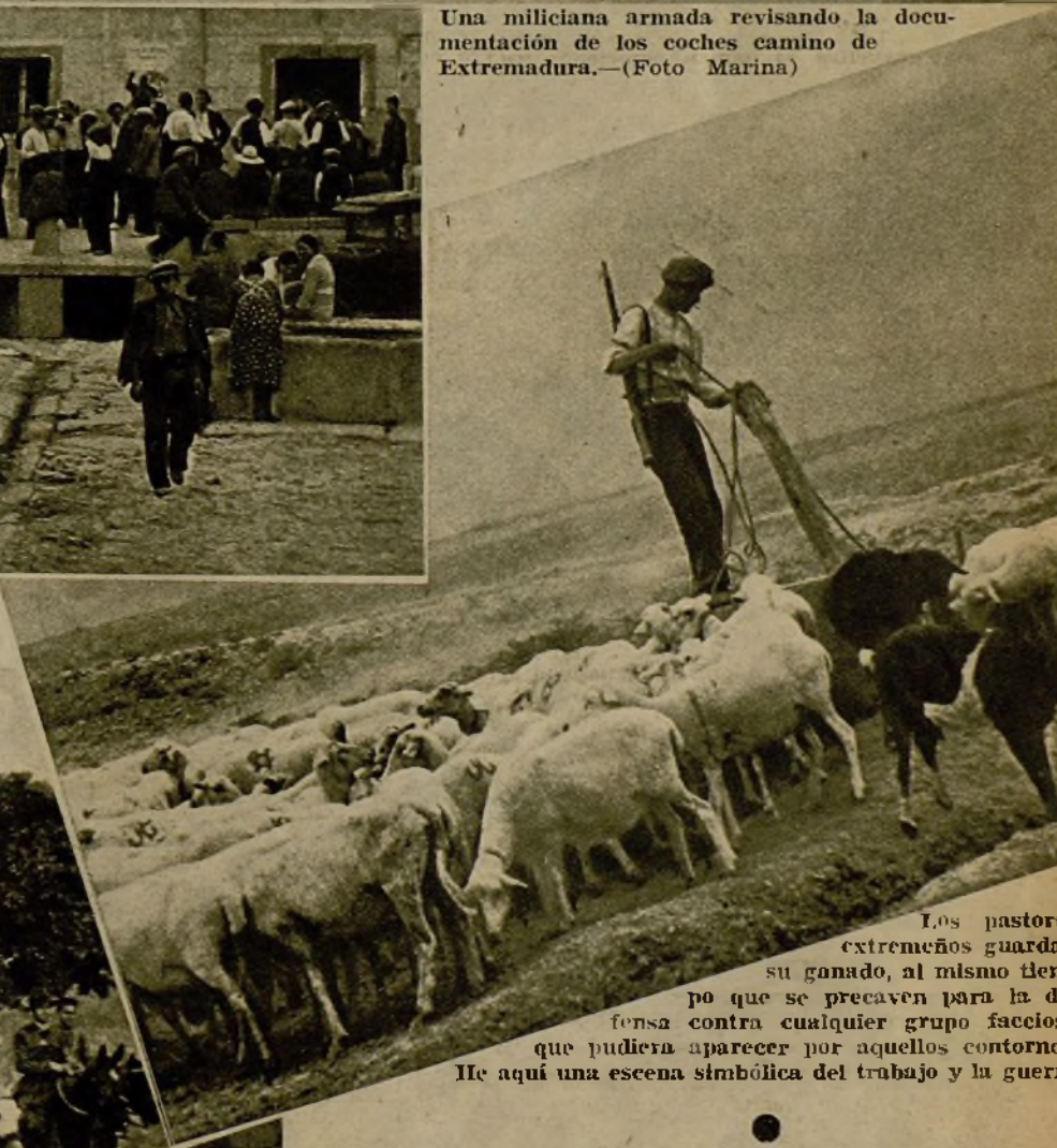
Los pastores extremeños guardan su ganado, al mismo tiempo que se precaven para la defensa contra cualquier grupo faccioso que pudiera aparecer por aquellos contornos. He aquí una escena simbólica del trabajo y la guerra