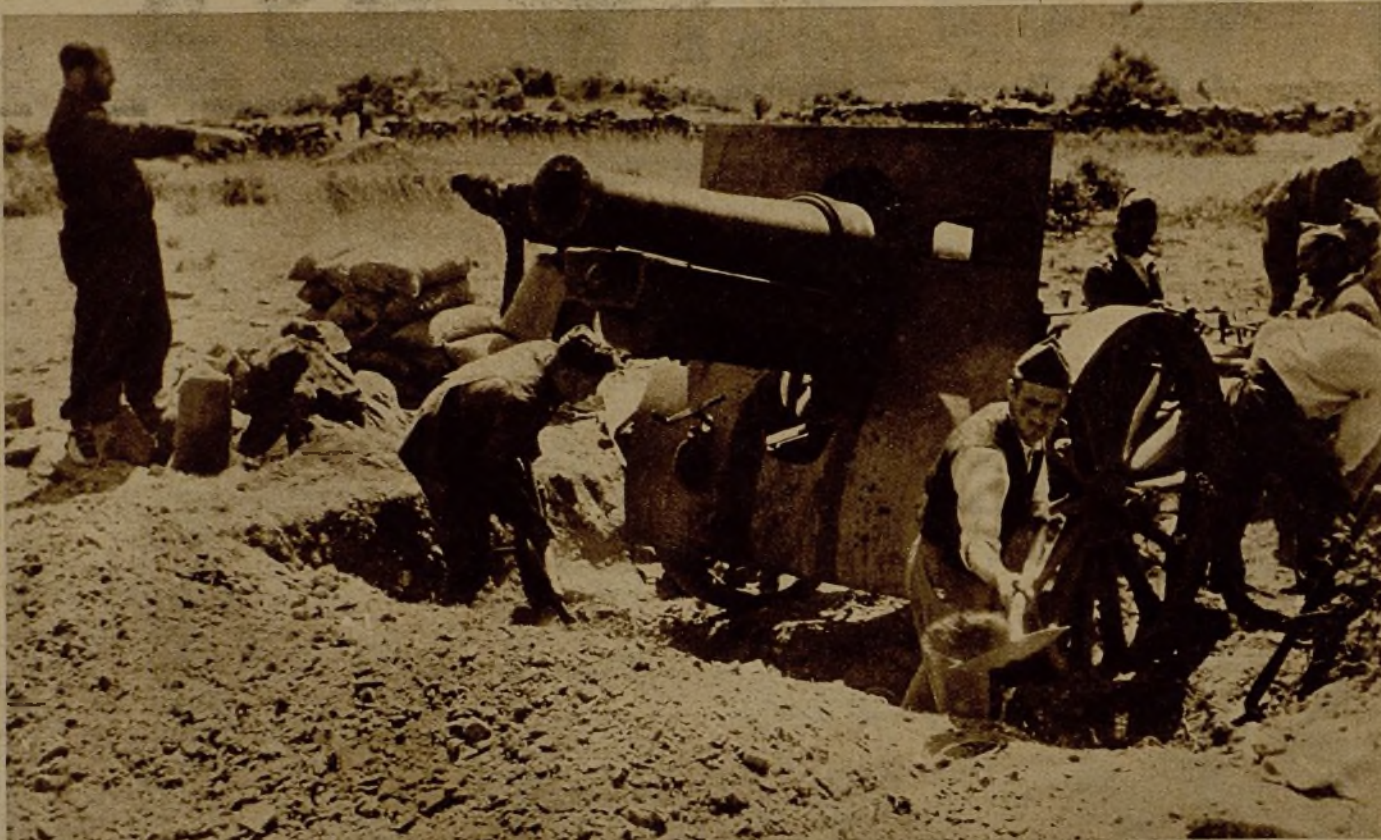
Bajo el amparo de la artillería, nuestras fuerzas siguen conquistando nuevas posiciones. Su fuego protector permite a las fuerzas de infantería avanzar constantemente. He aquí uno de los cañones en emplazamiento adecuado y preparado para disparar