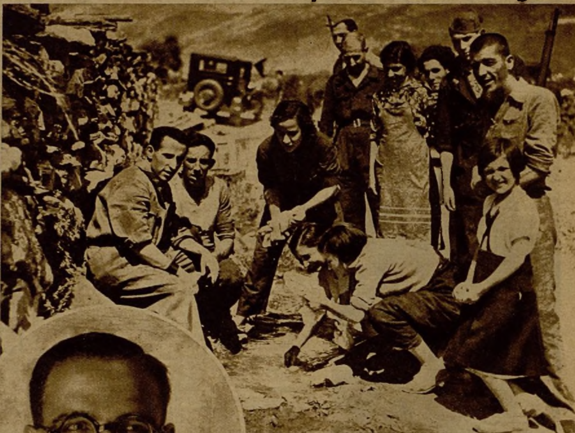
Las muchachas milicianas lavando ropas de sus compañeros en un regato. Su alegría hace pensar que esto de la guerra es un mal sueño...