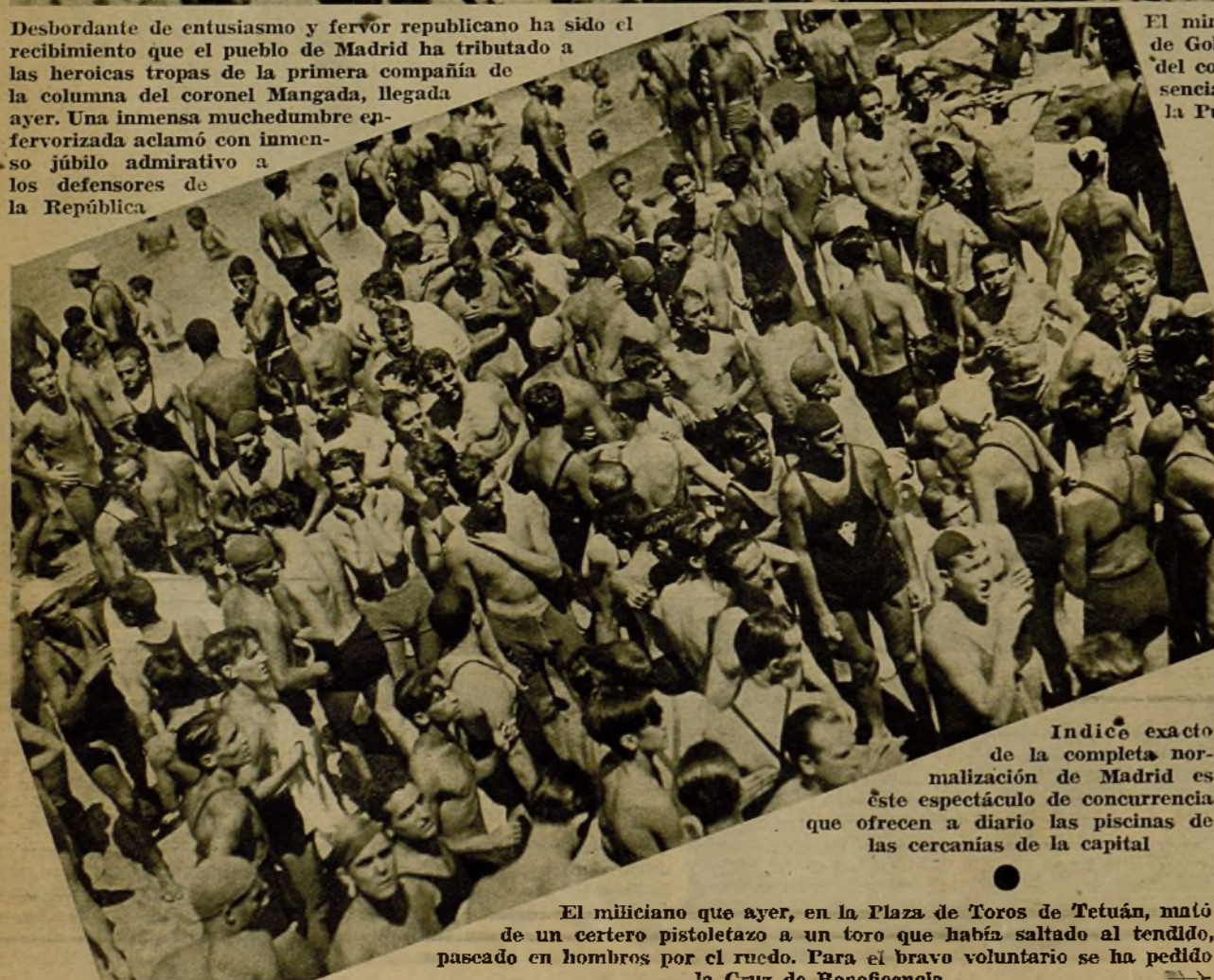
Indice exacto de la completa normalización de Madrid es este espectáculo de concurrencia que ofrecen a diario las piscinas de las cercanías de la capital.