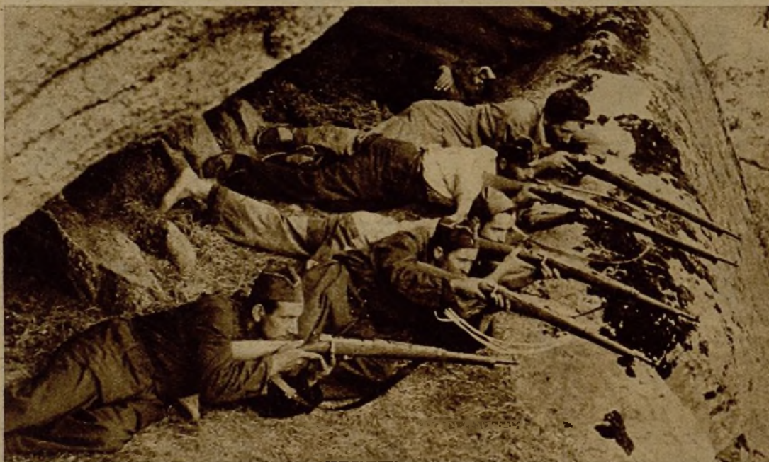
Nuestros soldados de las avanzadas disparando sobre el enemigo disperso