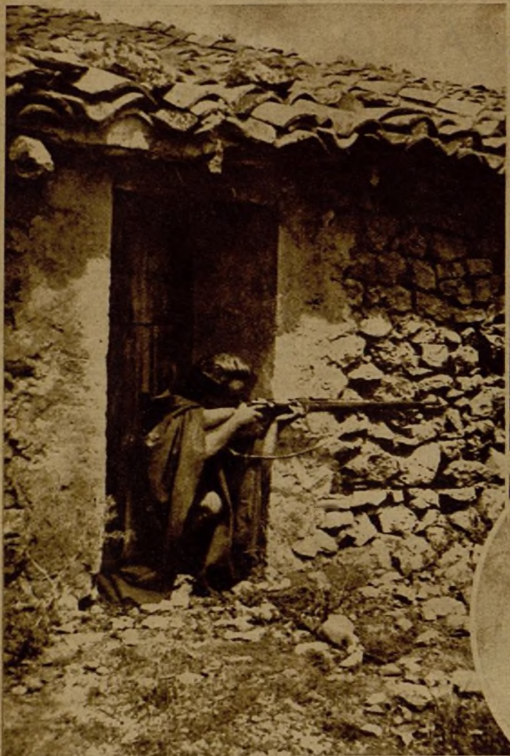
Desde cada puerta de las aldeas de Aragón se dispara contra los fascistas. Ved aquí a este improvisado guerrero cerrando el paso