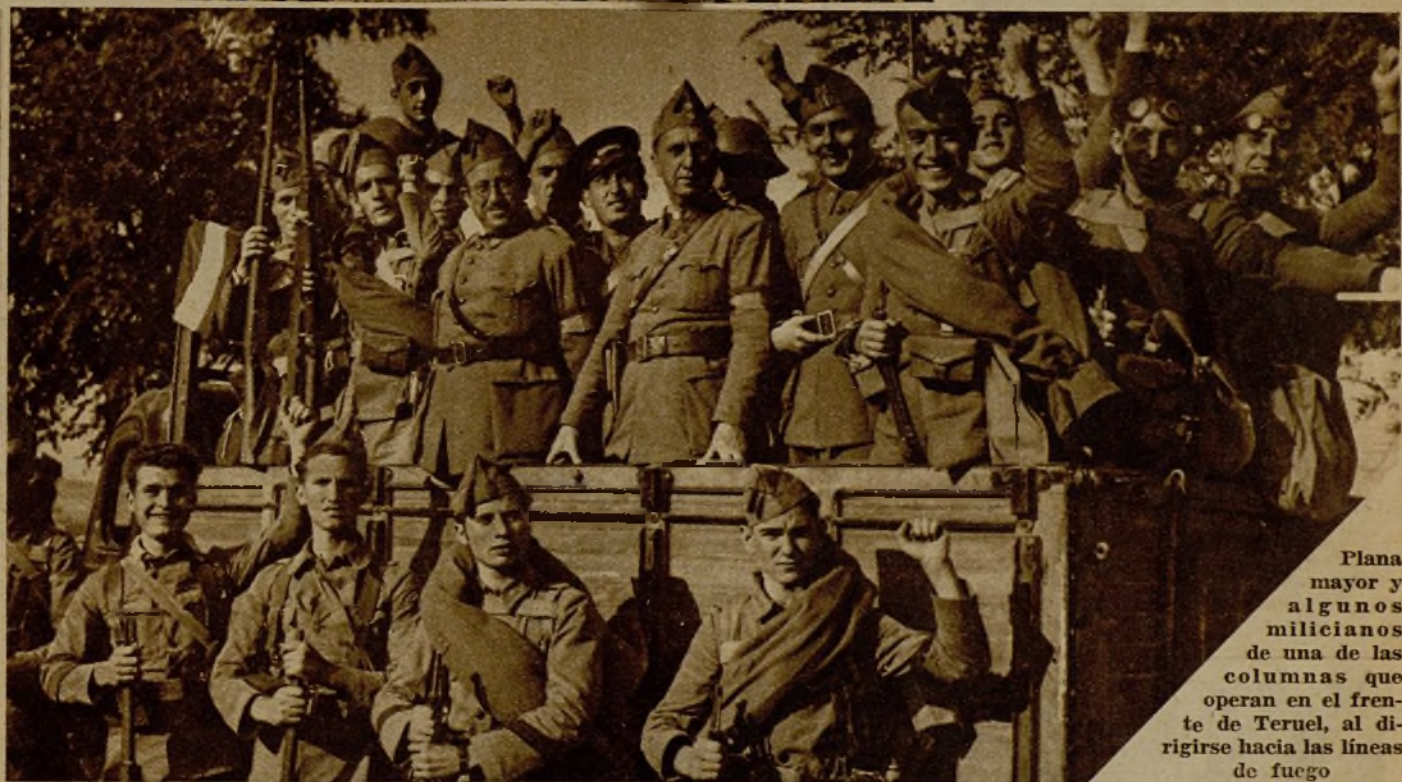
Plana mayor y algunos milicianos de una de las columnas que operan en el frente de Teruel, al dirigirse hacia las líneas de fuego