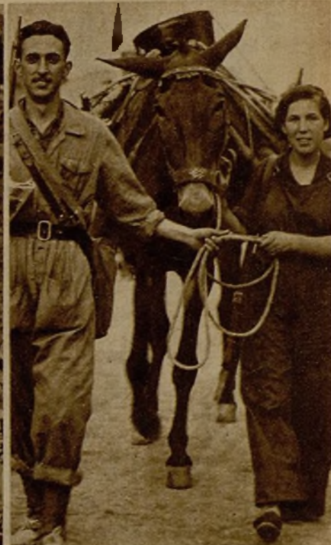
Una pareja de milicianos que se dirigen al frente para unirse a las columnas de Teruel, llevando su mula con los pertrechos