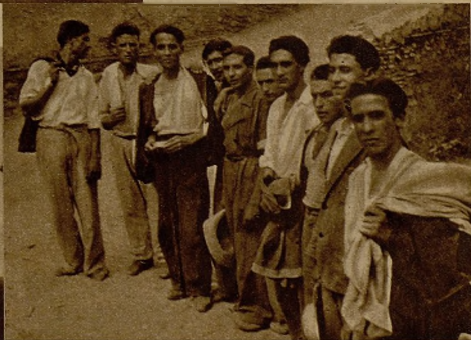
Prisioneros fascistas, capturados en el frente de Granada, en el camión que les condujo a nuestro cuartel general