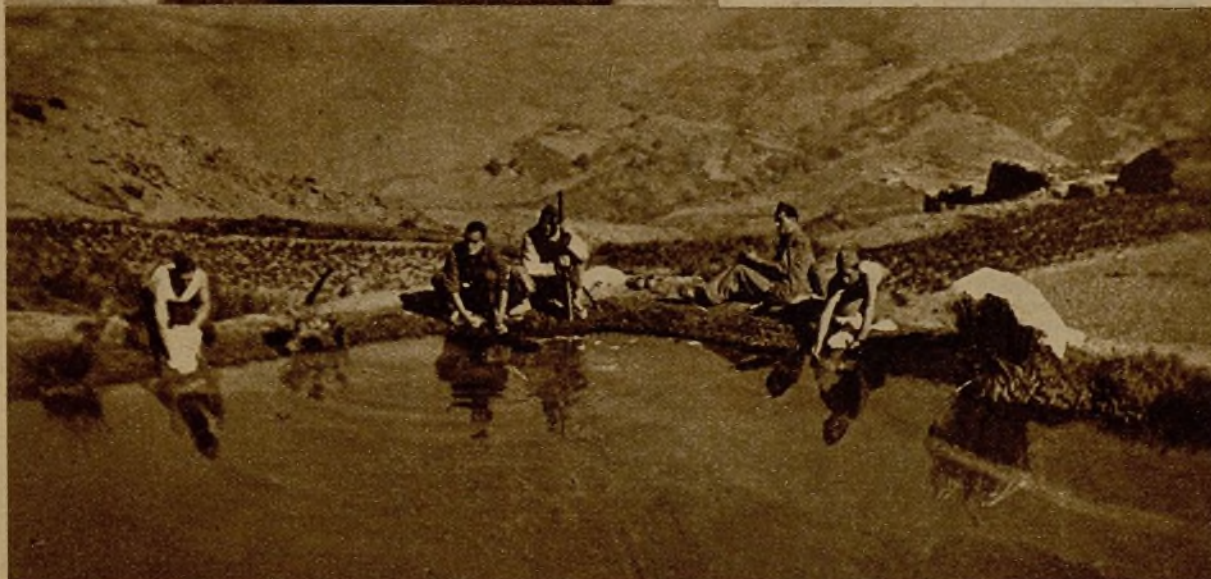
Embalse para el salto de Guéjar Sierra, a quince kilómetros de Granada, punto que ha sido tomado por nuestras tropas, y que priva de agua a la capital andaluza. Se divisan al fondo las nieves del Muley Hasan