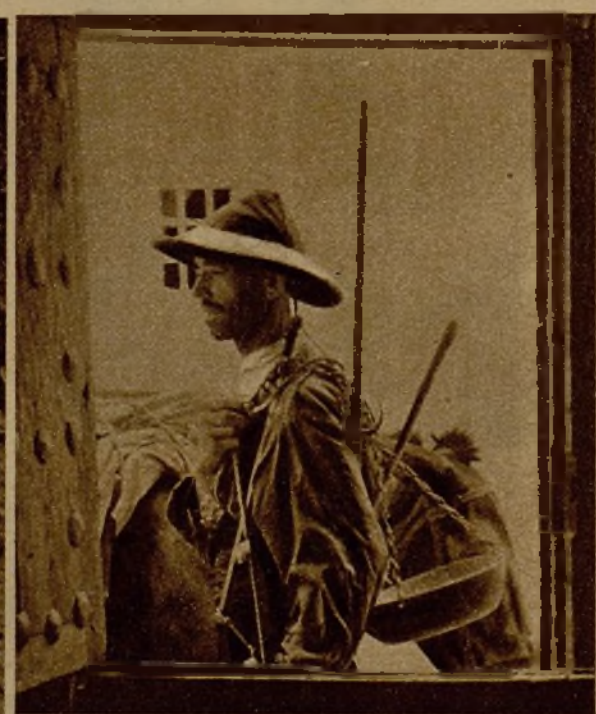
El buhonero que hace la guerra. La mercancía en la alforja y el fusil sobre el hombro... A la izquierda, un puesto de vigilancia en el frente de Extremadura