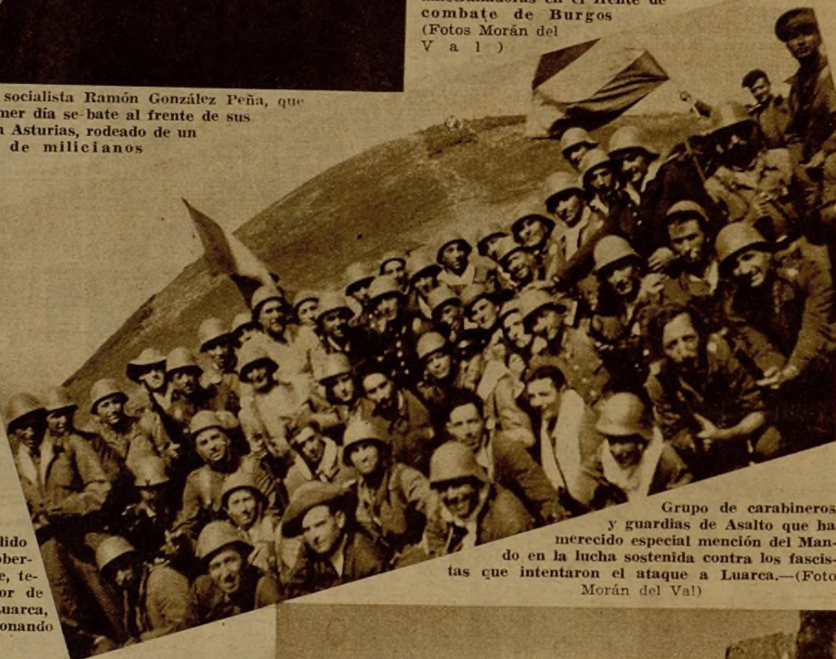
Grupo de carabineros y guardias de Asalto que ha merecido especial mención del Mando en la lucha sostenida contra los fascistas que intentaron el ataque a Lueca.