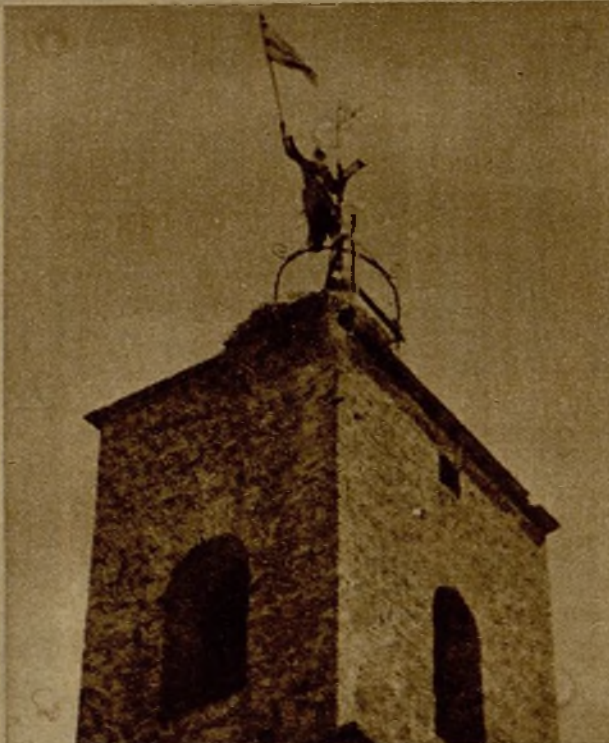
Un miliciano ha escalado la torre de la iglesia de Valdelacasa y coloca en lo alto la bandera de las fuerzas leales, que acababan de reconquistar el pueblo