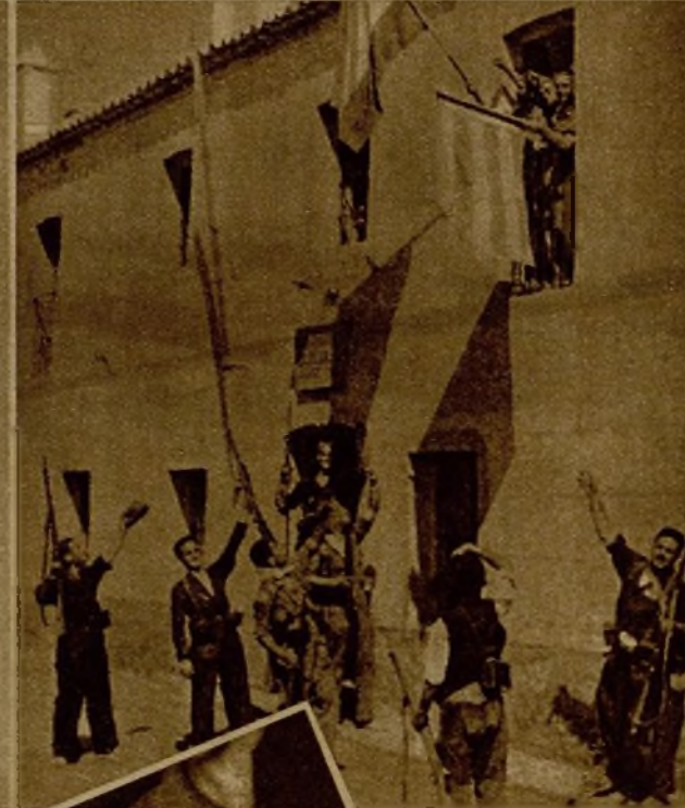
Los milicianos de la "Columna Fantasma" colocando la bandera de la República en la casa cuartel de la Guardia civil de Valdelacasa, momentos después de ser tomado el edificio