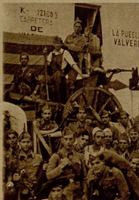
Pieza de Artillería con los soldados que la sirven, y que forman parte de una de las columnas expedicionarias al frente de Aragón