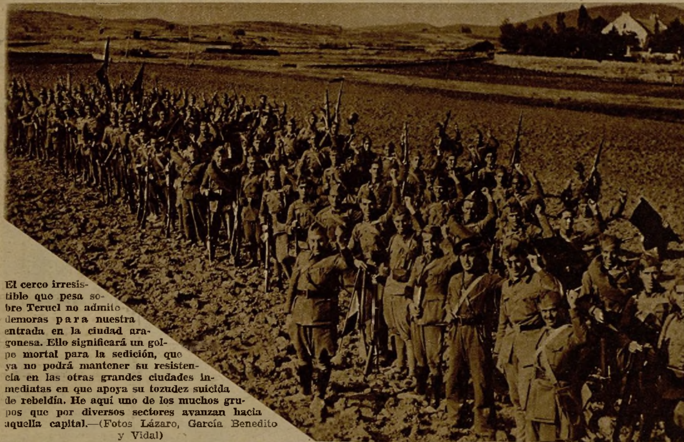
El cerco irresistible que pesa sobre Teruel no admite demoras para nuestra entrada en la ciudad aragonesa. Ello significará un golpe mortal para la sedición, que ya no podrá mantener su resistencia en las otras grandes ciudades inmediatas en que apoya su tozudez suicida de rebeldía. He aquí uno de los muchos grupos que por diversos sectores avanzan hacia aquella capital.