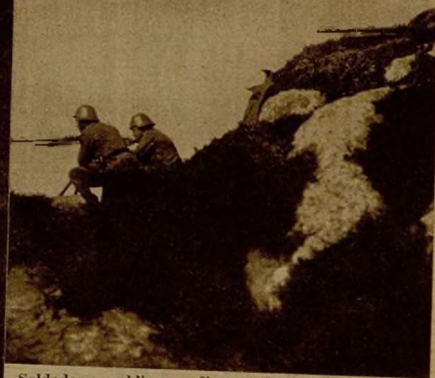
Soldados republicanos disparando con ametralladoras en el frente de combate de Burgos