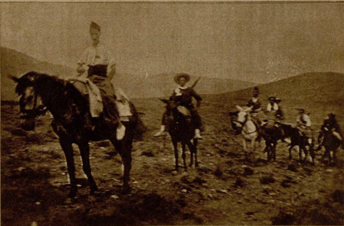
El capitán Burguete y su ayudante, el ya célebre "Pancho Villa", que tantas hazañas lleva realizadas en el frente de Granada, subiendo con unos bravos auxiliares a las cumbres de Sierra Nevada.