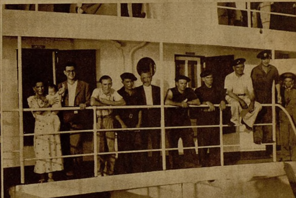
Los tripulantes del vapor "Petrólea", que se ofrecieron en Alicante para marchar a Casablanca, donde se hicieron cargo del vapor "Campero", que traía un cargamento de nueve mil litros de gasolina