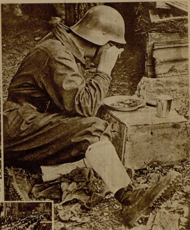
El almuerzo del miliciano al regreso de las avanzadas, después de las actividades de la operación mañanera. Desde luego, la guerra no le ha quitado el apetito...