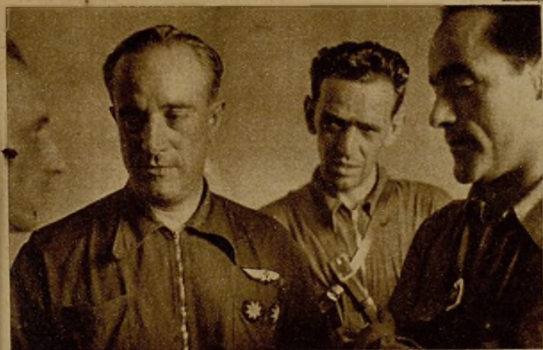
Otra de las baterías de las columnas catalanas que luchan en el frente aragonés, estratégicamente emplazada. A la izquierda, el teniente coronel Díaz Sandino, consejero de la Generalidad, cambiando impresiones con otros jefes de las columnas catalanas