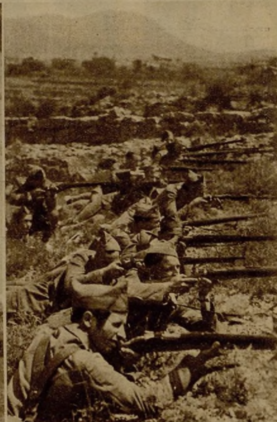
Las fuerzas de la República han emplazado sus avanzadas a seis kilómetros de Teruel. He aquí a un grupo de milicianos haciendo fuego amparado en los desniveles del terreno, a poca distancia de las trincheras enemigas