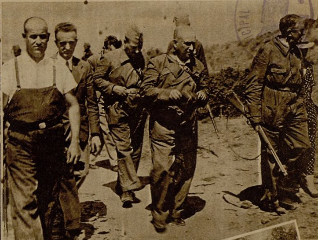
El líder socialista don Francisco Largo Caballero y el diputado don Julio Álvarez del Vayo, con varios periodistas extranjeros, visitando el frente de la Sierra.