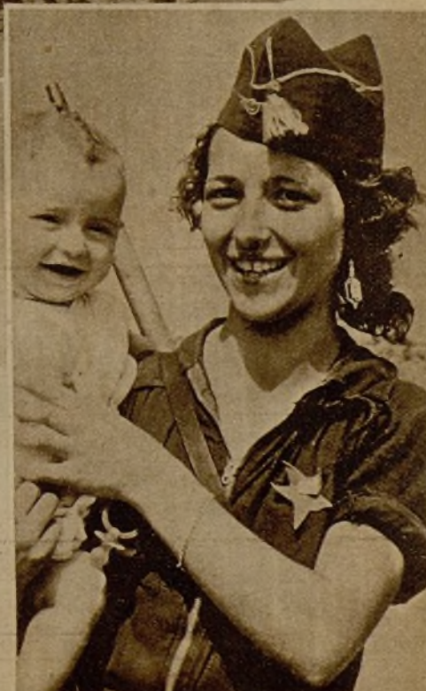
Esta joven madre miliciana, que con su marido está en el frente, ha llegado para un breve descanso, y recibe la sonriente bienvenida de su pequeño