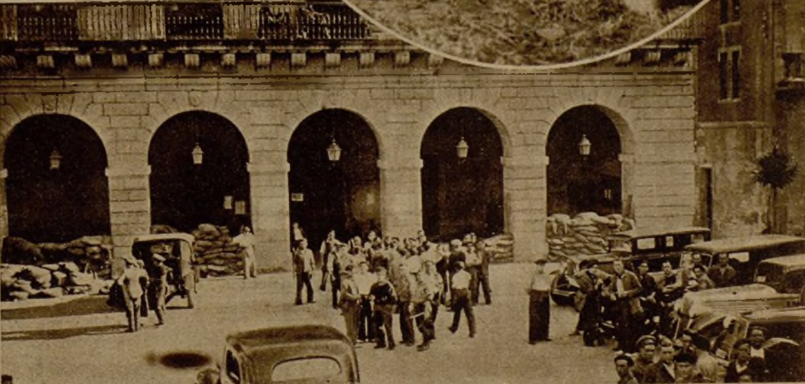
Un grupo de milicianos recién incorporados en Irún se dirige al cuartel para recoger el armamento