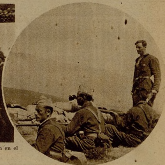
Avanzadilla de una de las columnas que actúan en el frente de Palencia