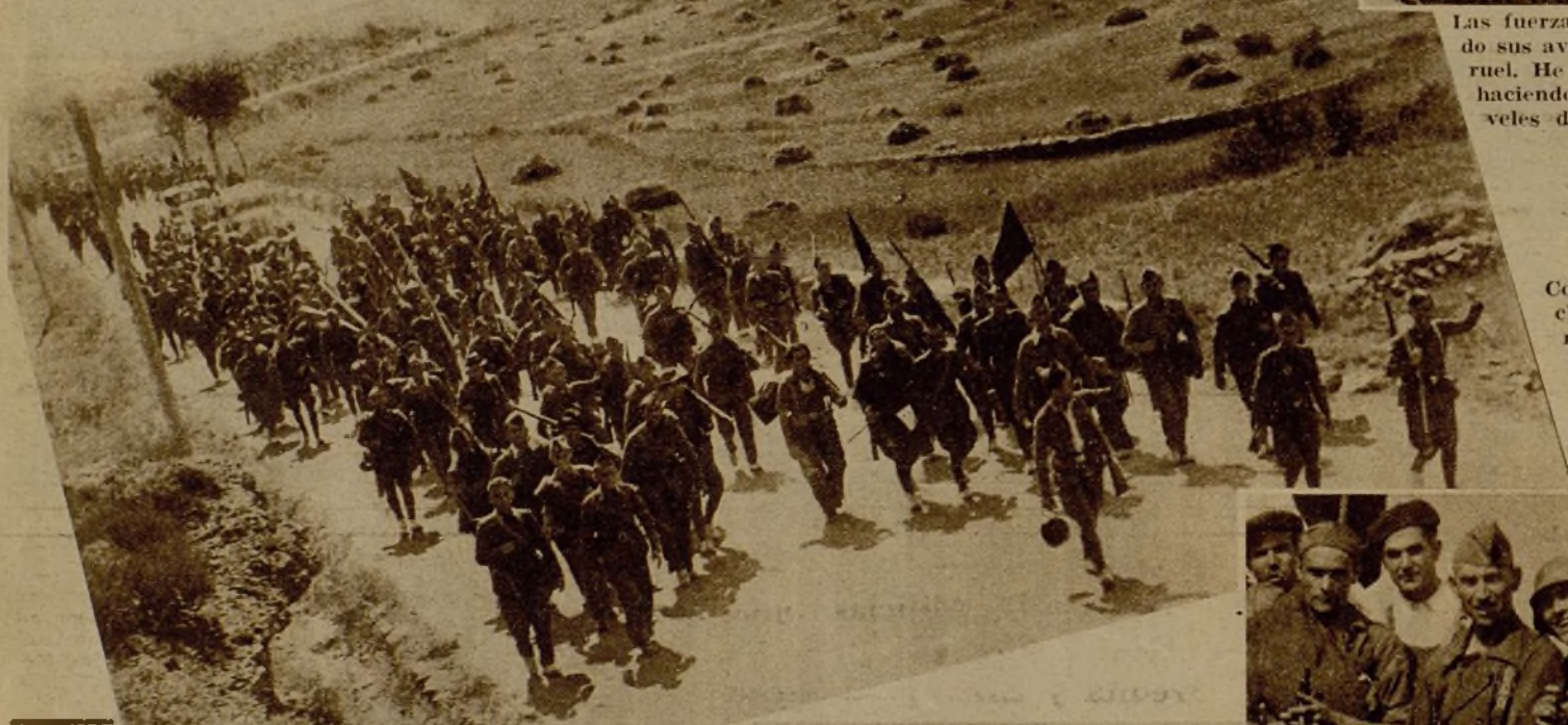
Continúan nuestras tropas estrechando el cerco de las poblaciones ocupadas por los facciosos en el frente aragonés. Véase una columna avanzando para incorporarse a la primera línea de combate