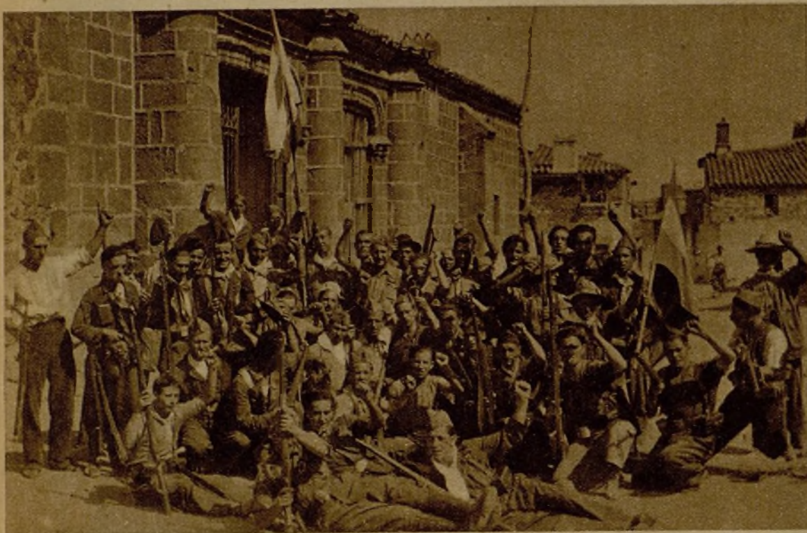
Una compañía de la "Columna Fantasma", que tomó brillante parte en la reconquista de Valdelacasa y causó gran quebranto a los rebeldes