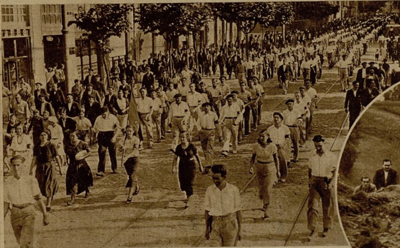
Los milicianos de Acción Vasca durante el desfile por la Gran Vía de Bilbao. El público hizo a los voluntarios un caluroso homenaje