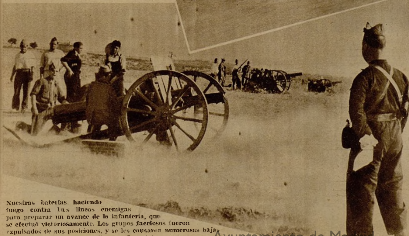
Nuestras baterías haciendo fuego contra las líneas enemigas para preparar un avance de la infantería, que se efectuó victoriosamente. Los grupos facciosos fueron expulsados de sus posiciones, y se les causaron numerosas bajas