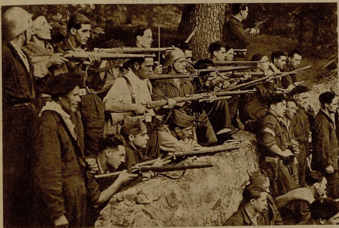
Un grupo de milicianos bilbaínos que tomó parte en la ocupación de Villafranca de Orio (Guipúzcoa), donde los facciosos fueron rápidamente derrotados, haciendo ejercicios de tiro en el monte Archanda