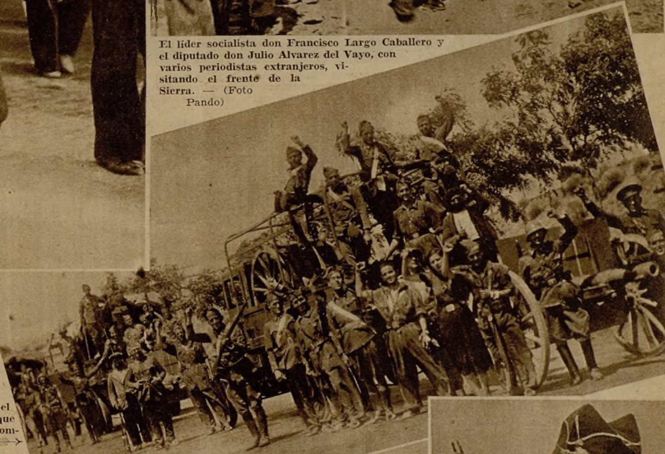
Una columna de Artillería en marcha hacia el frente de la Sierra para unirse a las tropas que operan en uno de aquellos sectores de combate.