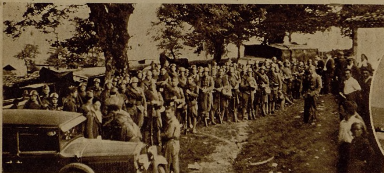
Una columna de fuerzas republicanas en un descanso durante su marcha al frente de combate de Galicia