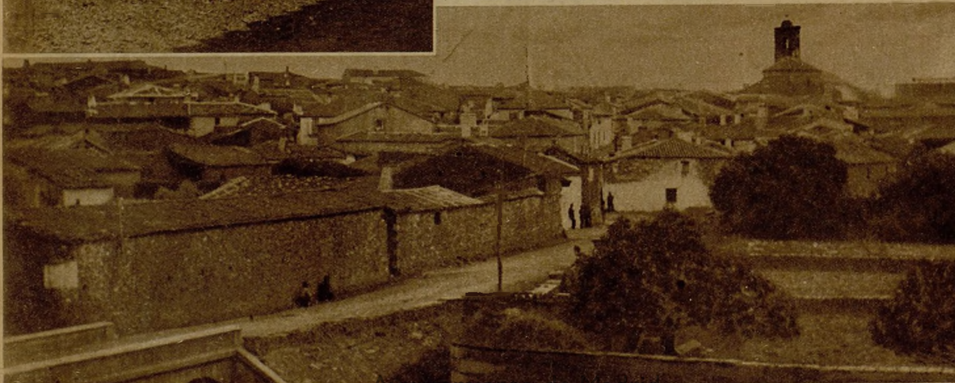
La foto recoge el preciso momento en que nuestras avanzadas entran en Valdelacasa para ahuyentar a los últimos grupos de facciosos que quedaban en la población