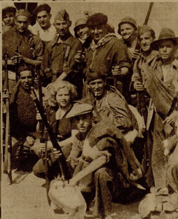
Una vez reconquistado Villal por las Milicias valencianas, los vecinos se incorporan a las mismas para tomar parte en la lucha contra los rebeldes