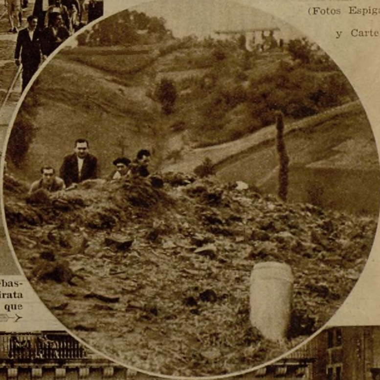
Un proyectil que cayó en los alrededores de San Sebastián en el ineficaz bombardeo que realizó el buque pirata "Almirante Cervera". Esta bala, como casi todas las que dispararon los marinos traidores, no hizo explosión