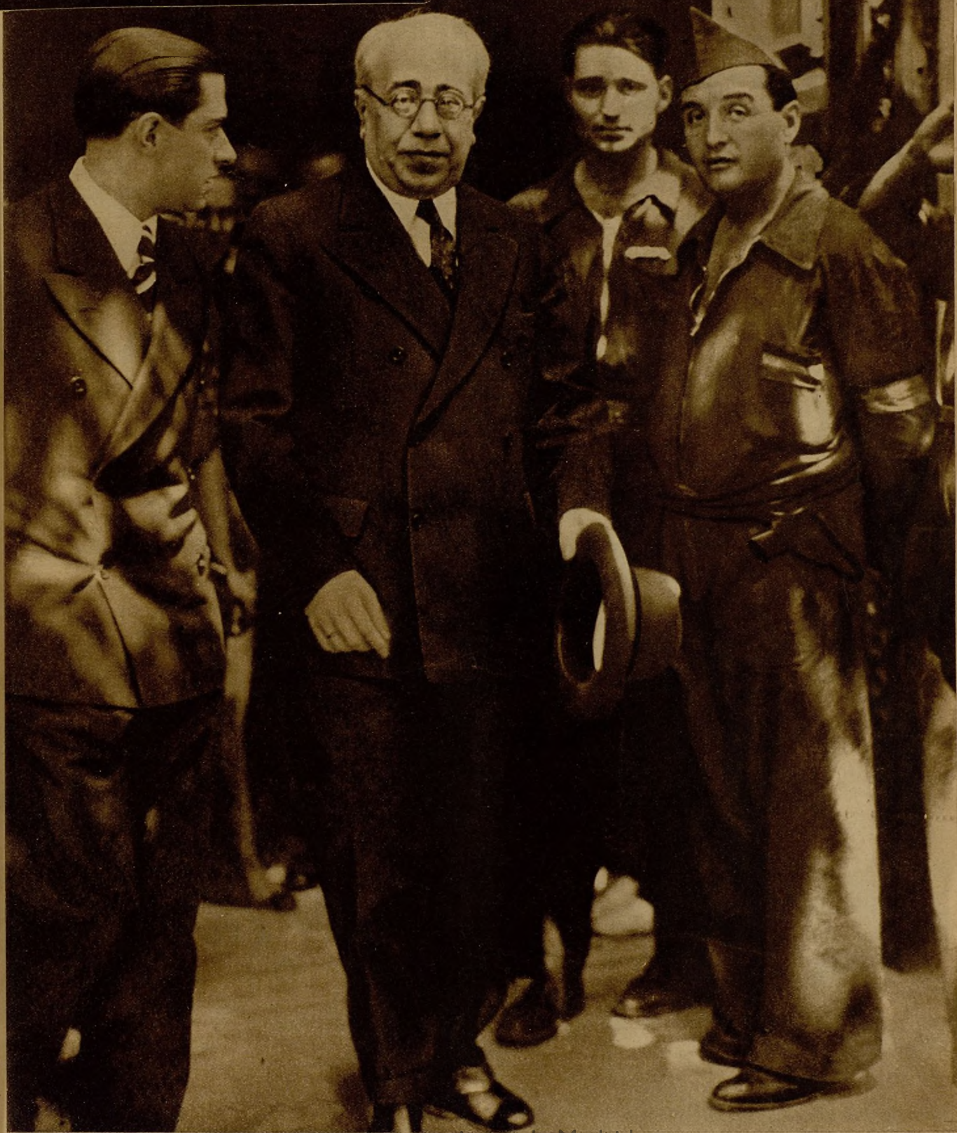
EL PRESIDENTE DE LA REPUBLICA VISITA EL FRENTE DE LA SIERRA Y LOS HOSPITALES DE SANGRE.—El Jefe del Estado, que anteayer hizo una detenida visita al frente de la Sierra, donde fué objeto de aclamaciones entusiásticas de milicianos y soldados, recibió ayer igual clamoroso homenaje del pueblo de Madrid a su paso por las calles para dirigirse a los hospitales de sangre. He aquí al señor Azaña al salir