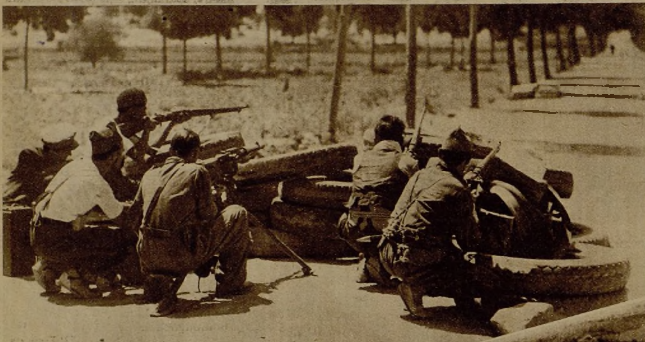
Una avanzadilla vigilando la carretera en el frente de Aragón. Muy al fondo se ve a un individuo que llegó a nuestra línea en nombre de los vecinos de Villal para dar cuenta de que el fuego de la artillería leal había ahuyentado a los facciosos de aquel pueblo.

Las tropas leales continúan sus avances en el frente de Aragón y han establecido sus líneas a seis kilómetros de Teruel