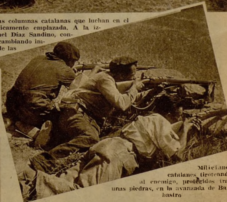
Milicianos catalanes tiroteando al enemigo, protegidos tras unas piedras, en la avanzada de Barbastro