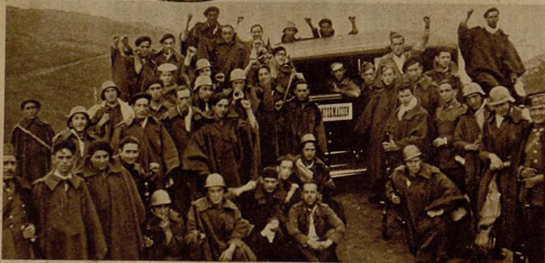
Milicianos, soldados y Guardia civil, que hicieron una audaz incursión en las líneas enemigas del frente Santander-Burgos, sorprendiendo a los rebeldes y causándoles numerosas bajas