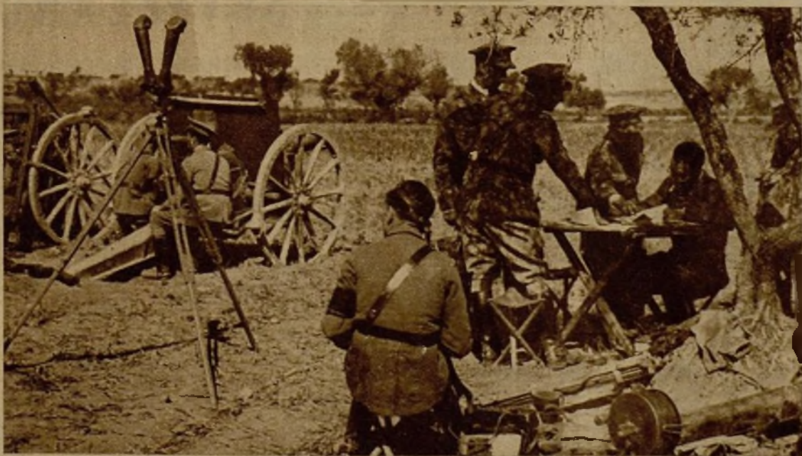
El mando de una de las columnas de Artillería que operan en el frente de Aragón redactando instrucciones para la organización de la ofensiva