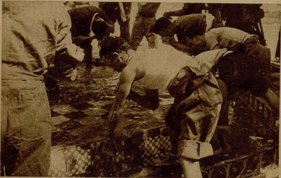
Después de una intensa jornada, los milicianos vuelcan sobre sus cabezas y brazos reparadores chorros de agua fría