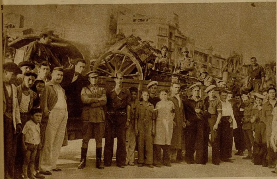
Una de las piezas de Artillería que han salido de Cartagena para el frente de combate, formando parte de una fuerte columna