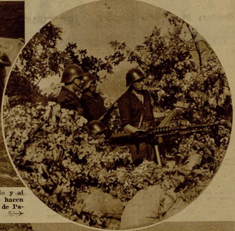
En un puesto convenientemente disimulado y al amparo de sacos terreros, cuatro soldados hacen eficaz fuego de ametralladora en el frente de Palencia