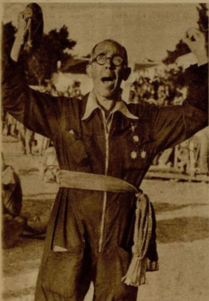
El insigne militar Julio Mangada dirige una vibrante y patriótica alocución a sus tropas, después de haberle sido impuesto el fajín de general

Un entusiasta homenaje de las Milicias al ilustre militar