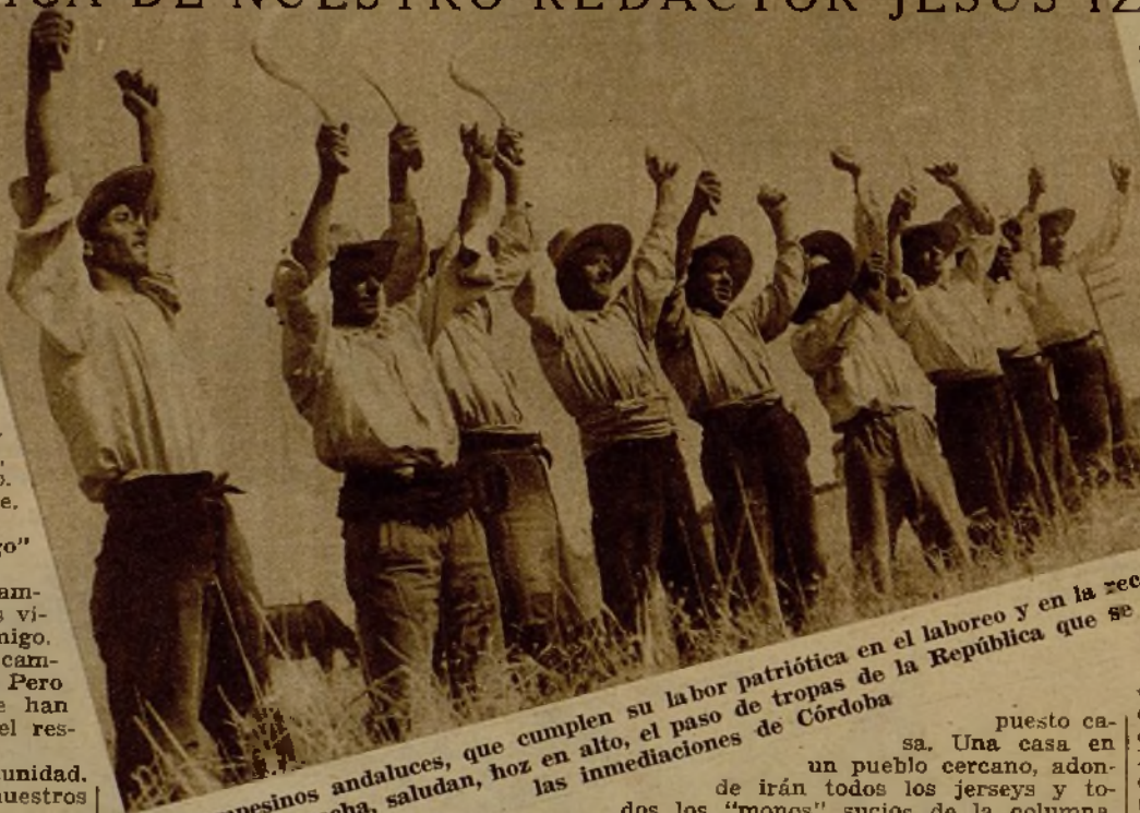
Los campesinos andaluces, que cumplen su labor patriótica en el laboreo y en la recogida del resto de la cosecha, saludan, hoz en alto, el paso de tropas de la República que se dirigen a las inmediaciones de Córdoba

Esta mañana encargamos a un mozo cortijero que nos hiciera unas migas. Las hizo magníficas, ¡gloriosas! Lástima que cuando empezábamos a comérmolas llegara el avión soltando bombas... Luego, frías ya, ha habido que tirarlas. ¡Horrores de la guerra!