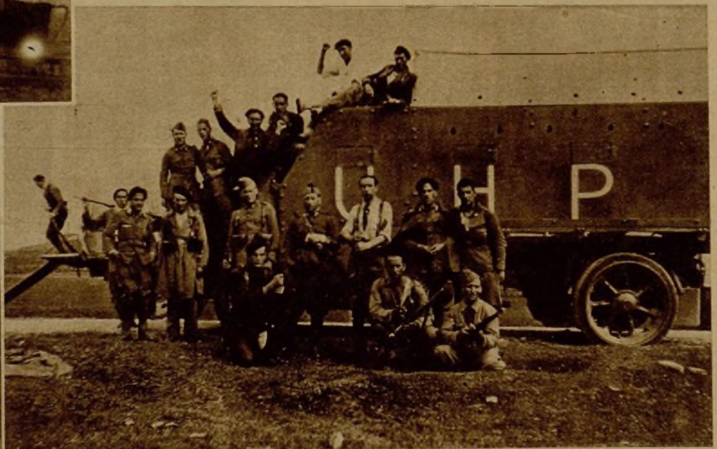
Uno de los camiones blindados que con tanta eficiencia emplean nuestras tropas en la ofensiva contra los facciosos