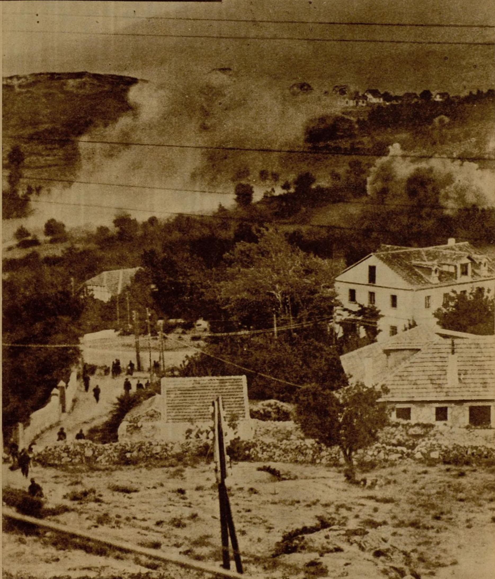
EPISODIOS DE LA LUCHA EN LA SIERRA.—Continúa el avance de nuestras columnas por los abruptos terrenos de la Sierra, donde día por día son desplazadas de sus posiciones las tropas enemigas. Tanto la Aviación como la Artillería realizan una gran labor destructora, que permite el eficaz desenvolvimiento de la Infantería. He aquí el momento de uno de los intensos bombardeos para ahuyentar a los facciosos de las líneas, en tanto que nuestros soldados emprenden el avance