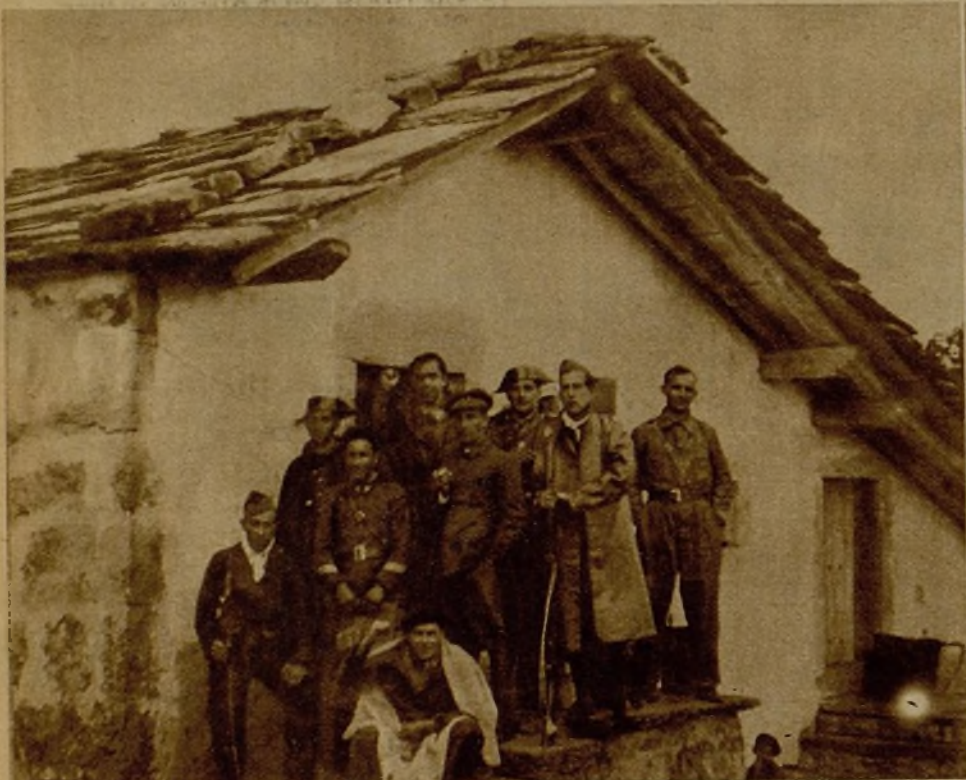
En el frente Burgos-Santander nuestras columnas han efectuado ayer importantes avances, apoderándose de varios pueblos y causando a los facciosos numerosas bajas. Un grupo de guardias civiles y milicianos en uno de los lugares reconquistados