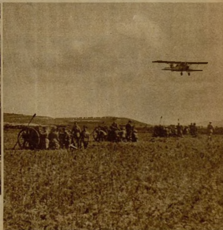
Otro de los aviones del Ejército de la República, momentos antes de tomar tierra, después de haber realizado una incursión sobre las líneas enemigas