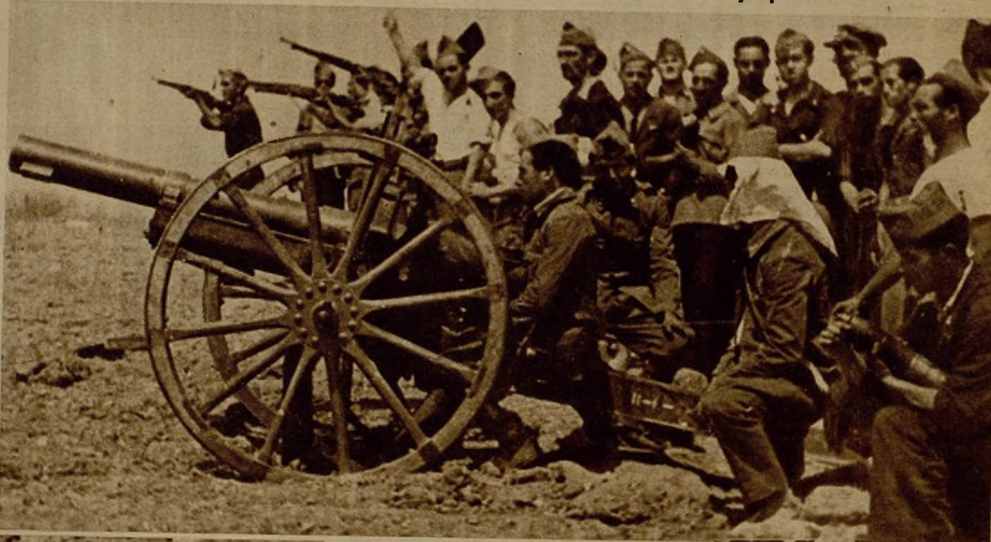
Uno de los cañones que desde Puente del Arzobispo despejó el camino de nuestras fuerzas hacia Valdelacasa, Carrascalejo y El Villar

La madrugada es la amiga inseparable de los milicianos. Es la amparadora de todas las más audaces sorpresas, pues así debemos calificar el hecho de armas que ayer tuvo por escenario esta planicie que se destaca en la estepa cacereña que comienza en Puente del Arzobispo para perderse en la ruta de Guadalupe... Cinco horas han descansado los bravos muchachos de Uribarri, siempre con el mosquetón y la ametralladora al alcance de la mano... En las avanzadillas hay algún que otro "paqueo" para tener en constante intranquilidad a los fugitivos, que se han atrincherado en el puerto de Carrascalejo, de corta extensión, pero de pronunciadísima cota, que da entrada al pueblo del mismo nombre... Se sabe que los fascistas, a cuya cabeza va el célebre cate-drático Carrillo, que tan torpemente supo resistir el empuje de las fuerzas repu-