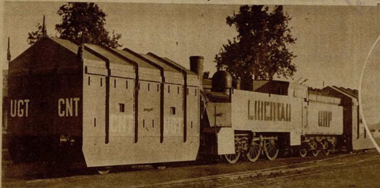
Un tren blindado que ha sido construido por los obreros de los talleres Davis y de la Central de Aragón y que ya ha sido enviado a uno de los frentes de combate