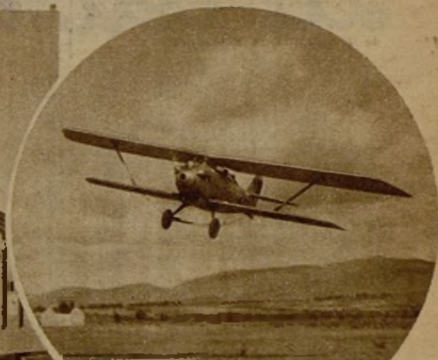
La Aviación republicana sigue cooperando con magnífica eficacia al total dominio de la zona rebelde de Teruel. He aquí uno de los aparatos descendiendo sobre nuestras líneas para arrojar las observaciones hechas en terreno enemigo