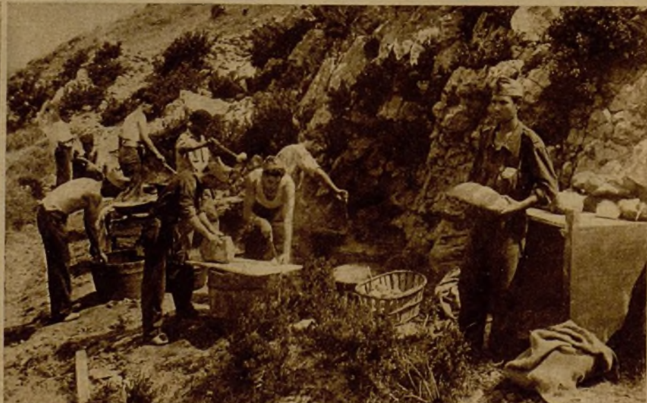
En las líneas avanzadas, al amparo de un cerro, se condimenta el rancho para los bravos luchadores