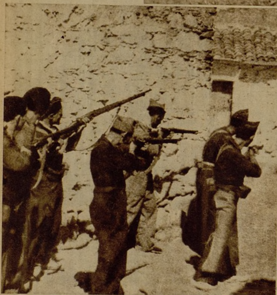
Un grupo avanzado de nuestras Milicias batallando la entrada del arrabal de Carrascalejo