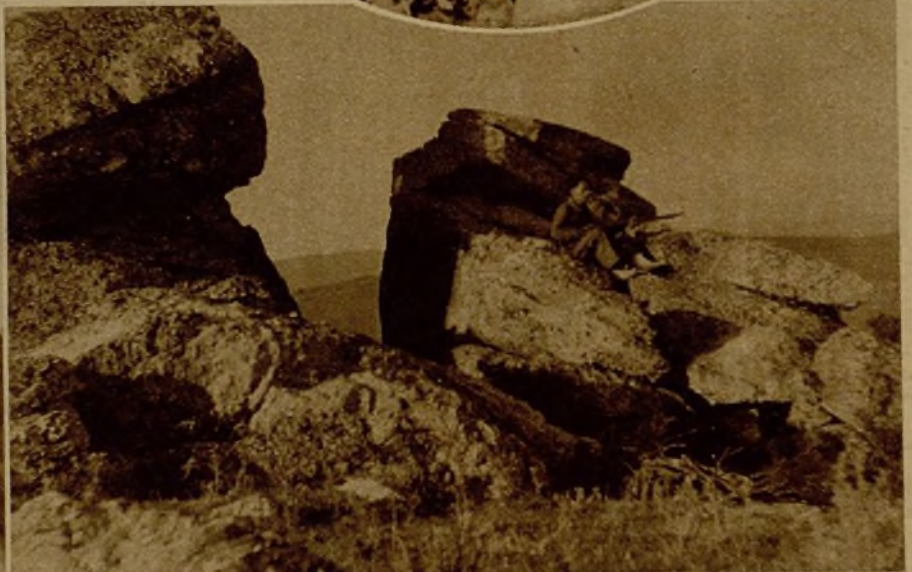
Dominando desde estas peñas, un millelano, centinela destacado, vigila un paso peligroso en el frente palentino