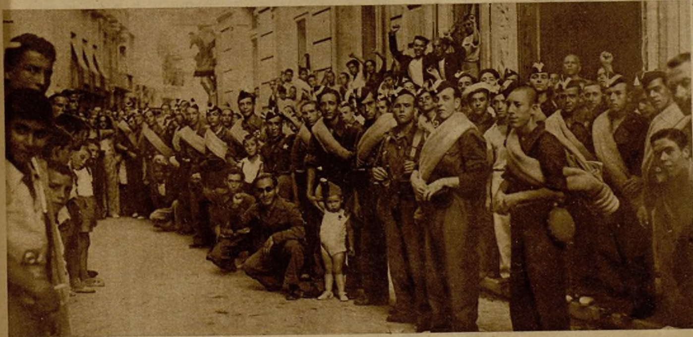
Milicianos cartageneros preparados para marchar al frente. Los bravos voluntarios fueron objeto de un gran homenaje popular