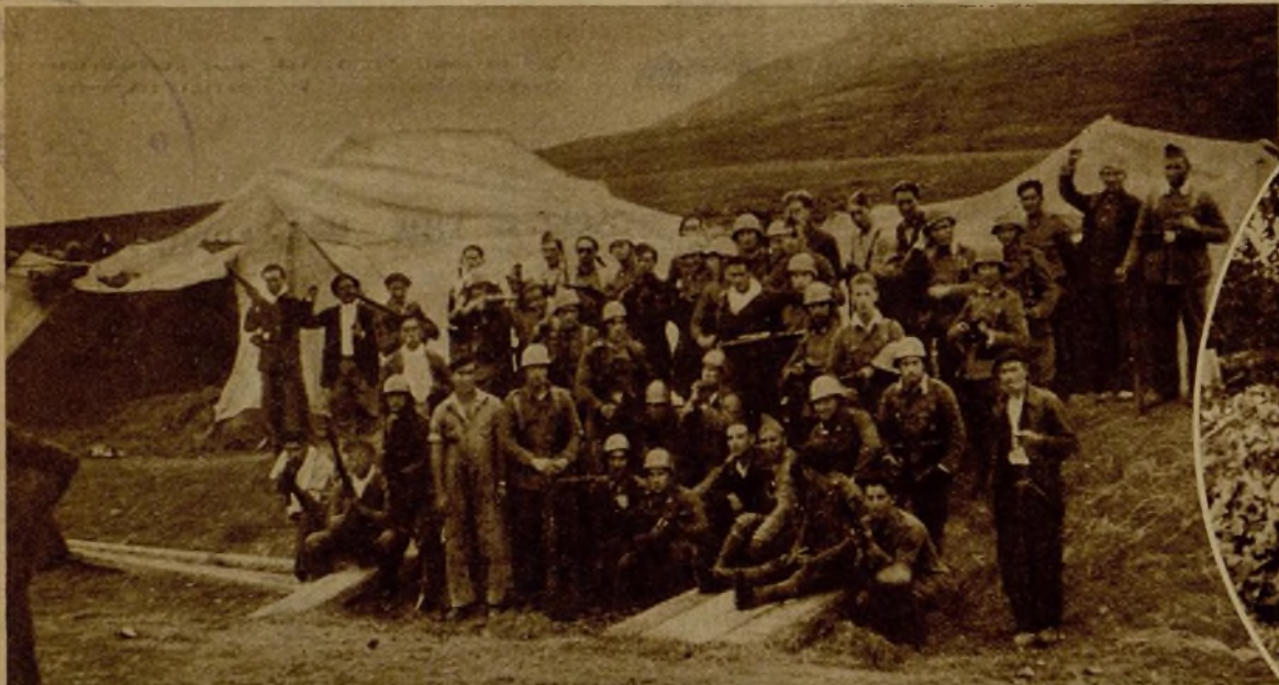
Un grupo de milicianos del frente Santander-Burgos descansan en la retaguardia, después de varios días de actividad en las primeras líneas

En el frente Burgos-Santander nuestras columnas han reconquistado varios pueblos y causado numerosas bajas