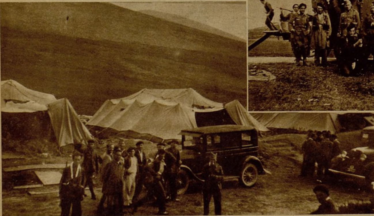
Un campamento de milicianos con tiendas transportables, en uno de los lugares avanzados del frente Santander-Burgos