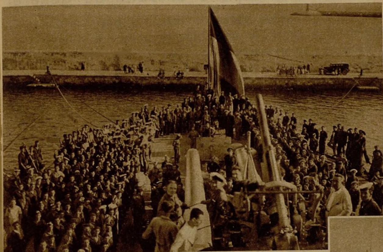
Antes de partir de Cartagena el "Jaime I" para cumplir uno de los objetivos encomendados, visitaron el barco el vicealmirante don Antonio Ruiz y destacados miembros del Frente Popular, ante los que se iza la bandera de combate

En Cartagena se tributaron calurosos homenajes a la dotación del "Jaime I" y a las columnas que marchan al frente