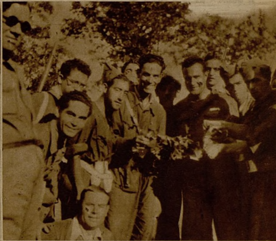
Prueba eficiente de que el enemigo hace muchas veces en su bombardeo una simulación grotesca son estos restos de botes de conserva que los milicianos muestran, recogidos después del bombardeo