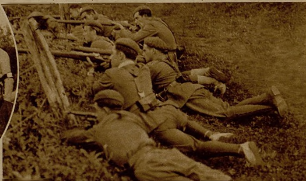
En estos últimos días la lucha ha adquirido gran dureza en el frente norte; pero a pesar de los desesperados esfuerzos de los facciosos, nuestras tropas han mantenido íntegramente sus posiciones y han causado al enemigo numerosas bajas. He aquí a un grupo de soldados en las avanzadas