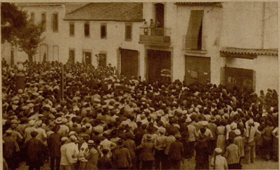
El pueblo de Dos Torres, reunido en torno al Ayuntamiento para escuchar una allocución del capitán Carted, que dirigió la toma de la población