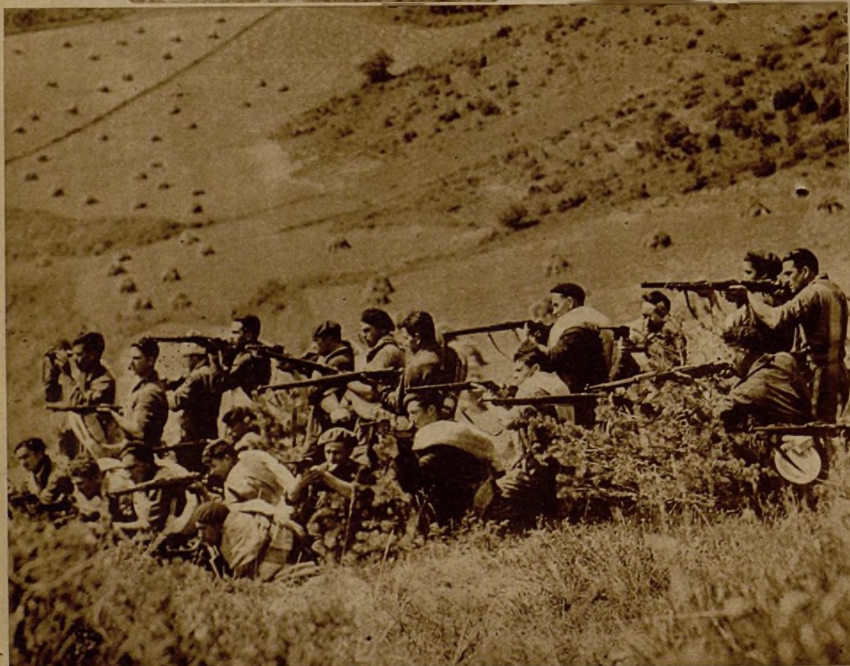
En el frente de Irún, numerosas guerrillas de soldados, conocedores del terreno, oponen su vigilancia, presta al ataque, a los soldados de la facción