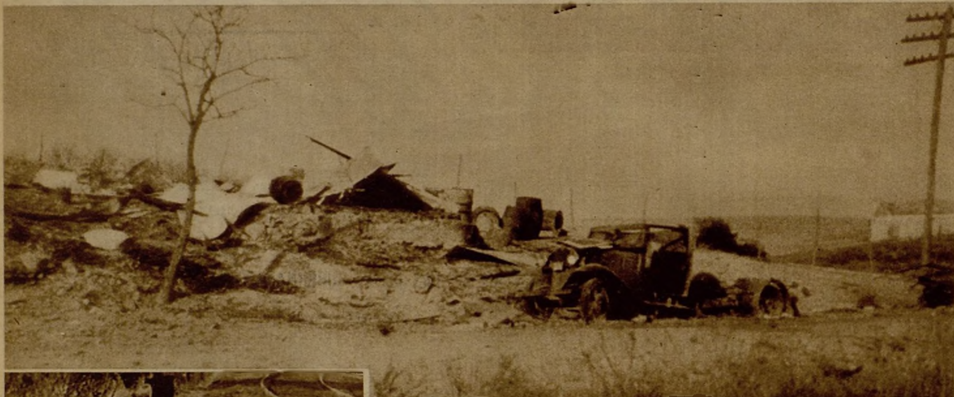
Una casa, en las inmediaciones de Torres Cabrera, donde se hicieron fuertes los facciosos y que fué destruída por nuestro cañoneo. Un camión de los rebeldes se ve también completamente destrozado

En las inmediaciones de Córdoba nuestras tropas, perfectamente situadas, esperan el momento decisivo