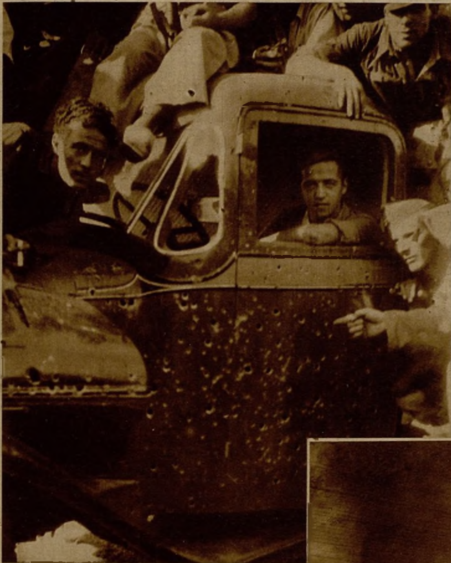
Tras un bravo combate, en el que nuestras fuerzas tuvieron que emplearse a fondo, el enemigo fué totalmente derrotado, cogiéndosele gran cantidad de material. He aquí uno de los camiones apresados, ocupado ya por nuestros voluntarios y que aparece nutridamente ametrallado