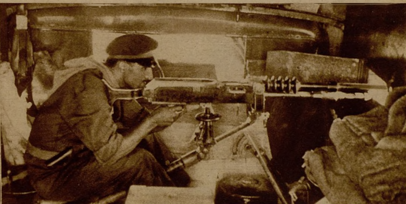
Una ametralladora, colocada en el interior de un coche blindado, haciendo intenso fuego contra el enemigo

A sus maridos los detuvieron, y detenidos siguen por no sé qué concomitancias con el fascismo. Cerrada la puerta de la cárcel, las dos comadres—creo que son comadres—se buscaron para llorar la desgracia. Corazones gemelos, se con-