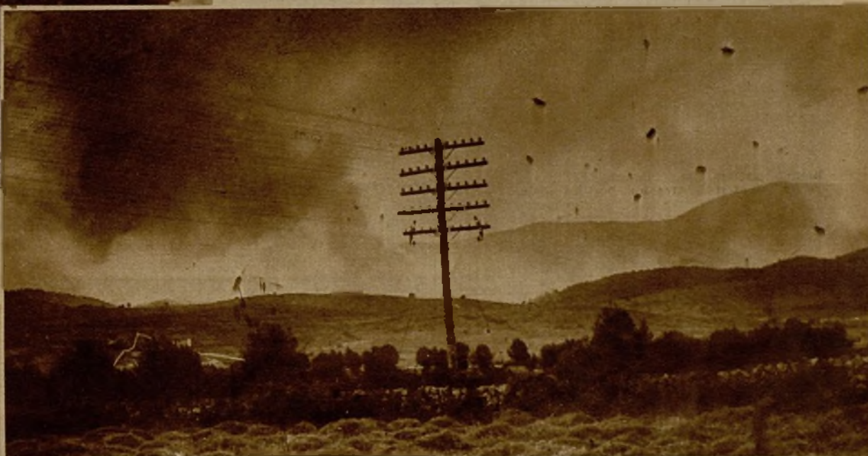
En uno de los puntos más estratégicos del frente de la Sierra se observan los efectos del nutridísimo bombardeo de la Aviación, que permitió ayer un considerable avance de nuestras columnas