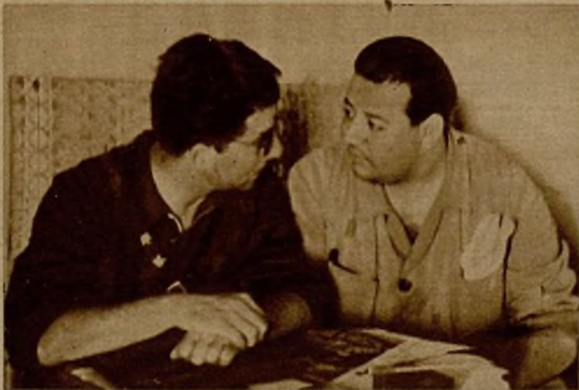
El comandante del Quinto Regimiento de Milicias, que actúa en el frente de la Sierra, con el teniente de Artillería señor Paz, conversan acerca de los detalles de la campaña y planean los detalles del avance