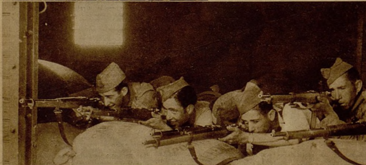
Después de la toma de Torres Cabrera nuestros soldados hicieron fortaleza de la estación. He aquí a varios de ellos en el interior de un vagón de ferrocarril