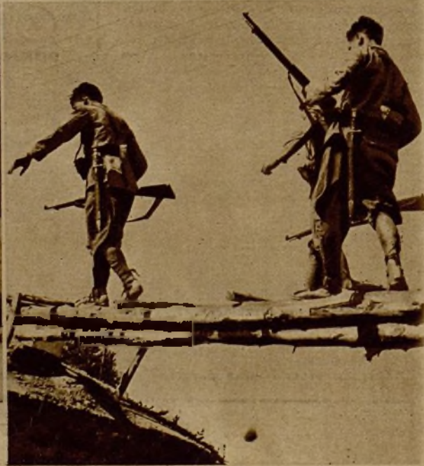
En un lugar cercano a Córdoba, donde los facciosos, en su huida, volaron un puente, nuestros soldados hacen el tránsito sobre palos, en un difícil equilibrio