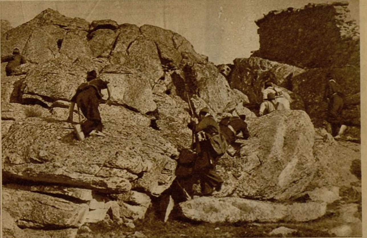
Carabineros de El Escorial y milicianos, desplegados en guerrilla, acometen el avance para sorprender una trinchera del enemigo, durante la victoriosa acción librada en Peguerinos