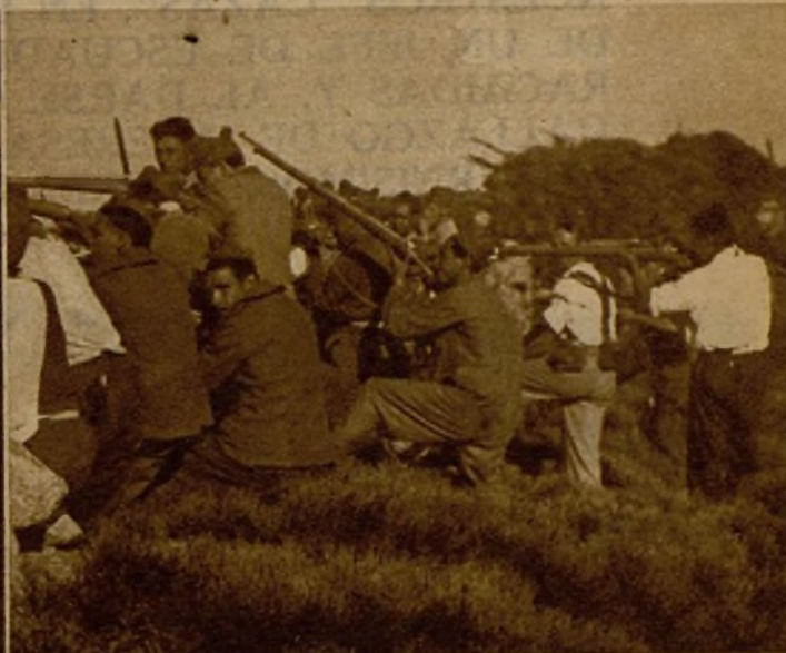
Milicianos y carabineros de El Escorial de vigilancia en una trinchera, después de la brillante acción de Peguerinos, en la que el enemigo sufrió tan duro quebranto

Sin duda el enemigo había preparado largamente el ataque en el sector de Peguerinos, que realizó por sorpresa y con gran violencia, acumulando sus fuerzas en el intento de quebrantar nuestras líneas y ganar rápidamente terreno. La reacción de nuestras fuerzas fué inmediata y contundente, y con gran dureza contrarrestó el ataque, haciendo retroceder en dispersión al enemigo, que hubo de volver a sus primitivas posiciones, de las que fué acometido y desplazado. Numerosos pertrechos les fueron tomados por nuestras tropas. He aquí algunos de los fusiles y ametralladoras aprehendidos