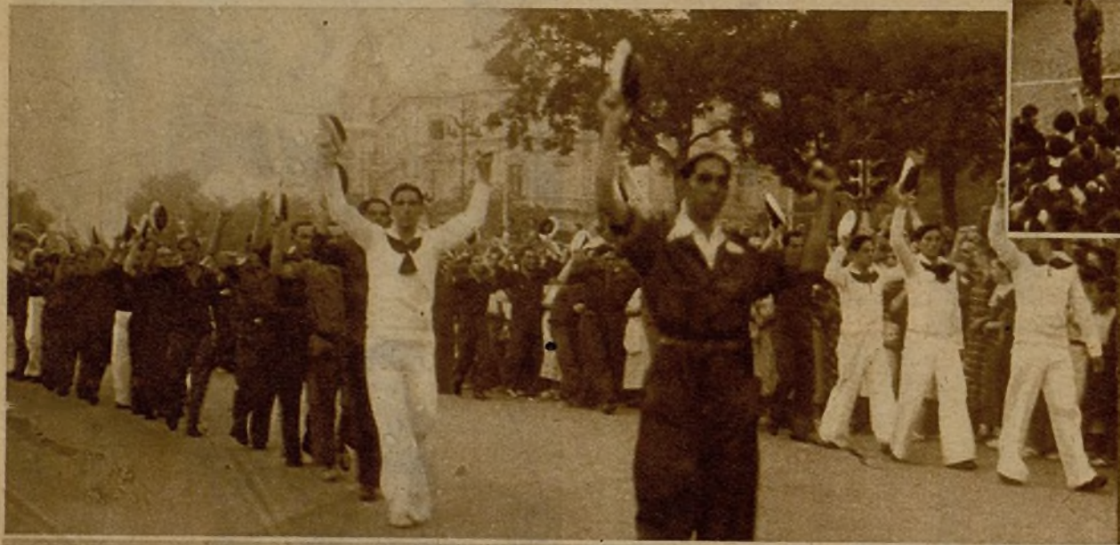
La representación de la Marina corresponde a las entusiastas saluciones de la muchedumbre