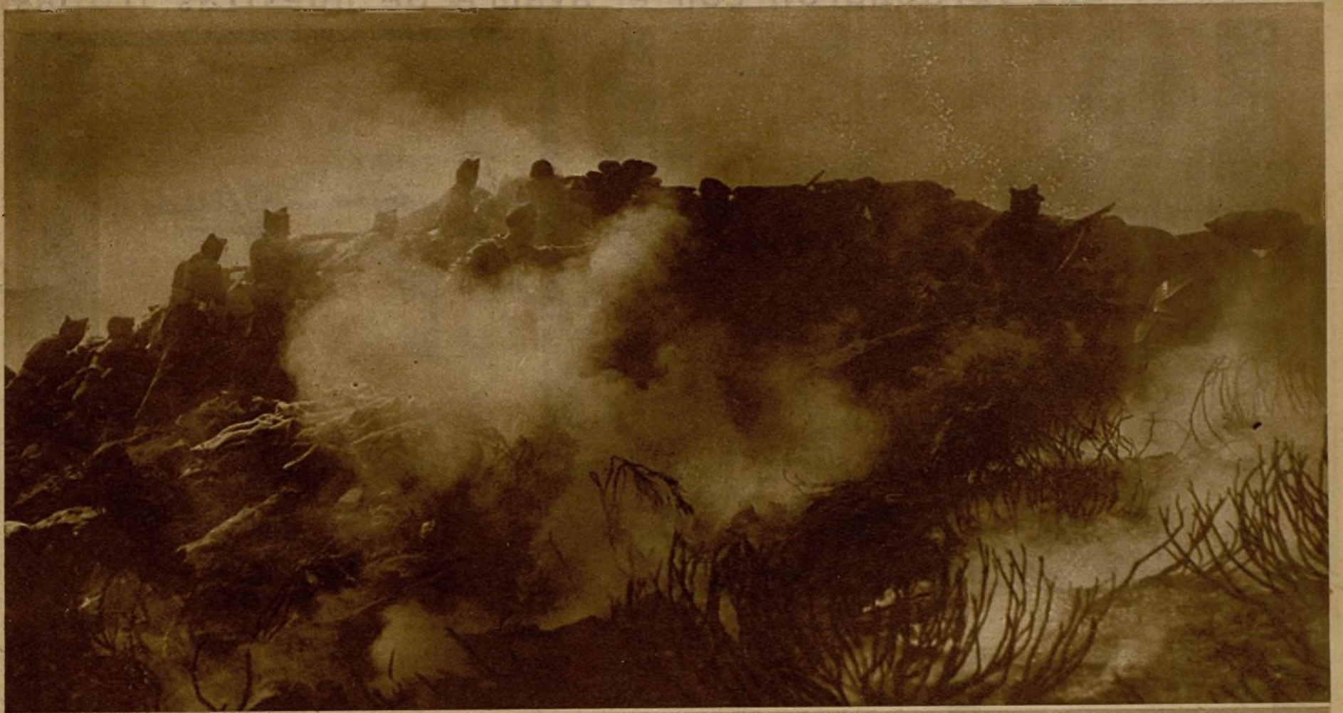
Entre el humo producido por el incendio de los jarales, nuestros soldados y milicianos avanzan para desplazar al enemigo y toman por asalto esta altura