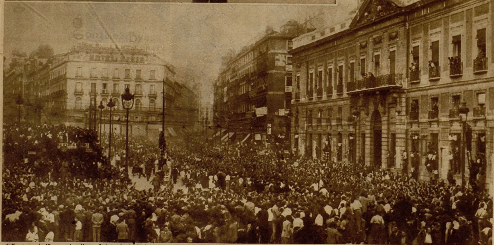
"¡No pasarán!" era el grito unánime de luchadores y pueblo durante el magnífico desfile, que ha tenido el valor representativo de una decisión invencible la de defender las libertades, la de triunfar rotundamente en la lucha, aniquilando a los criminales que atentaron contra la patria