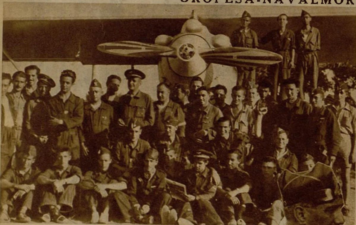
Los oficiales y subalternos de Aviación, que estos días se cubren de gloria en Extremadura

NUESTROS "CAZAS", EN UN COMBATE EMOCIONANTE, DERRIBAN EL AVION DE UN JEFE DE ESCUADRILLA REBELDE.—EL PILOTO SE ARROJA CON PARACAIDAS Y, AL DARSE CUENTA DE QUE NO PUEDE HUIR, SE SUICIDA.—HALLAZGO DE INTERESANTISIMOS DOCUMENTOS.—OTROS DOS AVIONES, MODERNISIMOS, DERRIBADOS POR NUESTROS PILOTOS EN EL SECTOR DE OROPESA-NAVALMORAL