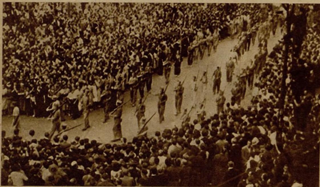
Indescriptible, superior a toda ponderación, desborde enfervorizado de entusiasmo ha sido la manifestación que el pueblo madrileño en pleno hizo ayer al congregarse en las calles para presenciar el desfile de los milicianos, que celebraban la Jornada Internacional de la Juventud. He aquí un momento del paso de los luchadores por la Puerta del Sol, entre vitores clamorosos y ovaciones interminables

La grandiosa manifestación que ayer hizo Madrid es garantía invencible del triunfo de la voluntad del pueblo