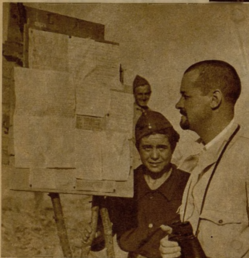
Miembros de la Comisión francesa, representantes de la C. G. T. del vecino país, que han venido a España para informar a los demócratas del mundo acerca de la lucha de nuestro pueblo por sus libertades, reunidos con algunos representantes del Frente Popular español