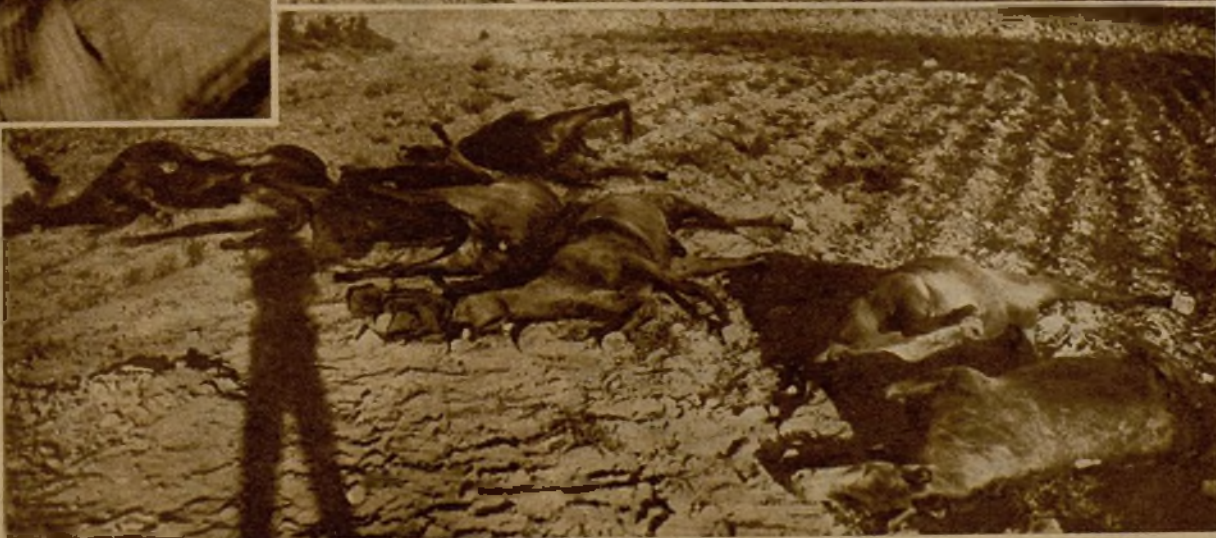
En la dura acción de Peguerinos tuvieron una eficazísima intervención nuestros aviadores, que, volando a escasa altura, bombardearon a los rebeldes, causando grandes destrozos en su columna. He aquí en el campo, después de la dispersión de los facciosos, caballos muertos por la metralla