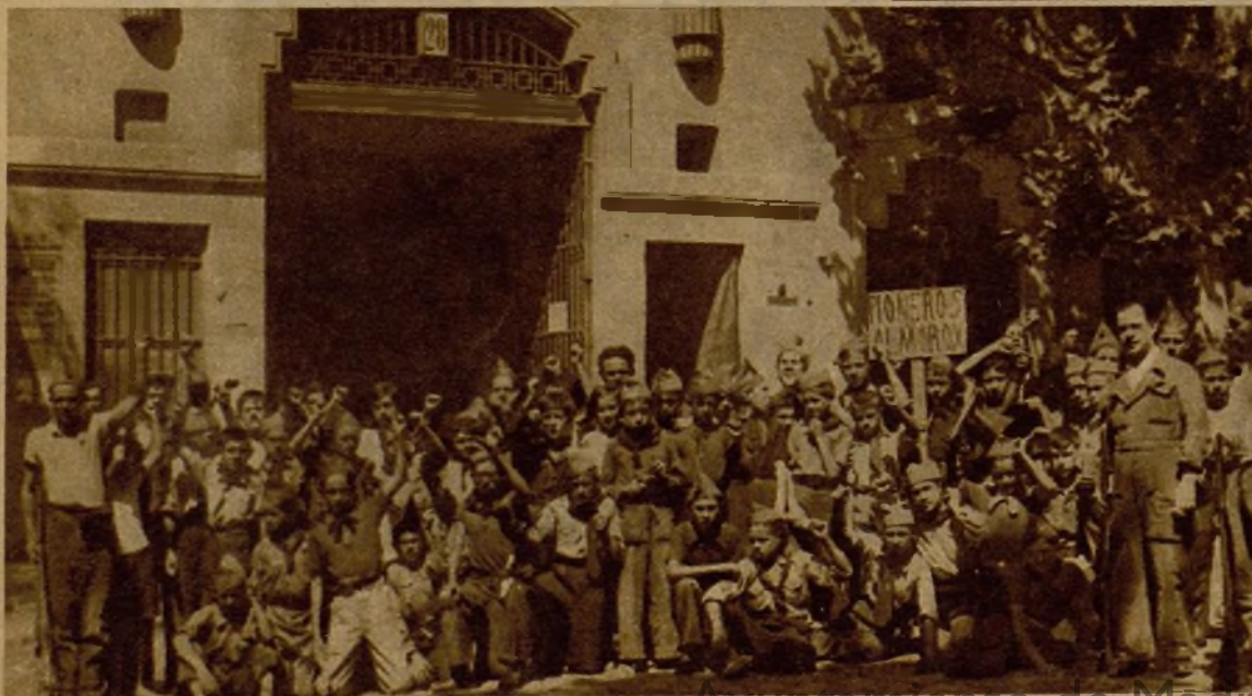
Ayuntamiento de Madrid