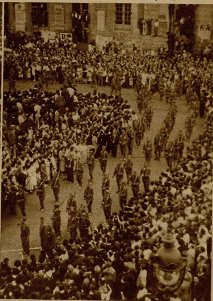
Todo el itinerario del desfile se hallaba cubierto materialmente por la multitud entusiasmada. Un momento del paso ante Gobernación