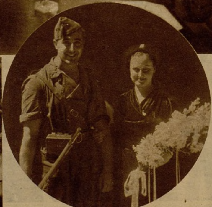
Grupo de pioneros de Almorox (Toledo) que ayer, a su llegada a Madrid, visitaron la casa de AHORA