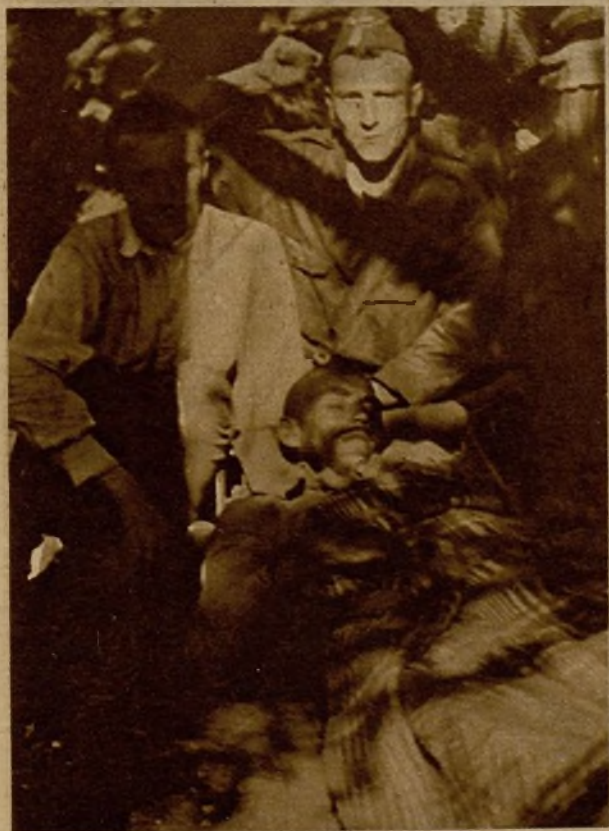
Una columna enemiga, en la que figuraban quinientos moros, entró por sorpresa en Peguerinos; pero inmediatamente fué rechazada con gran violencia, causándole nuestras tropas más de doscientas bajas y cogiéndole copioso material de guerra. En la fotografía se ve a un moro herido, al que recogieron nuestros soldados sobre el campo, en una camilla, para ser trasladado a la ambulancia de la Cruz Roja