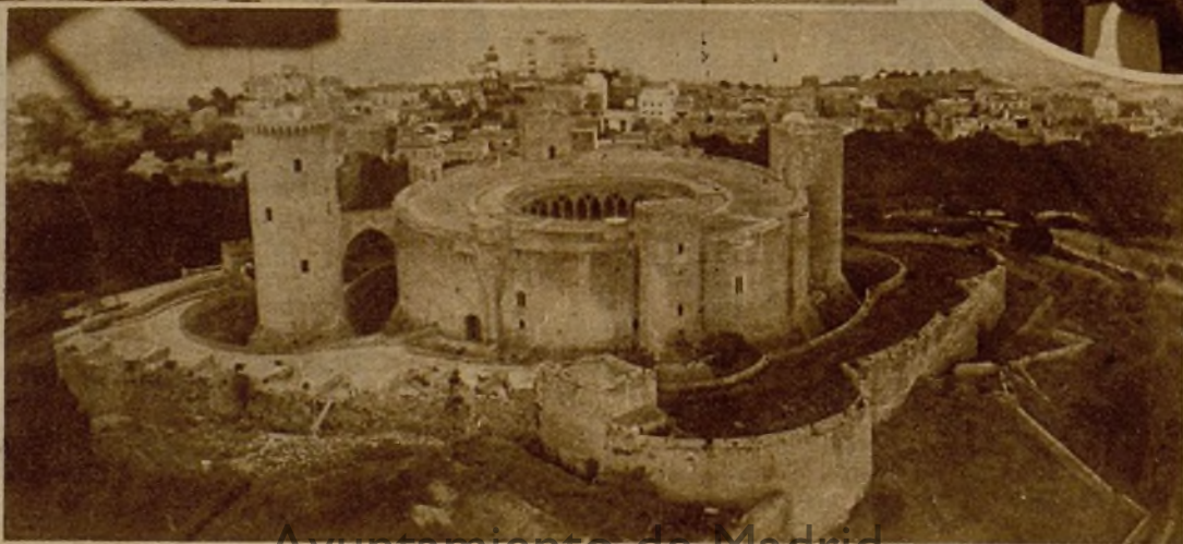
Una vista, tomada desde uno de los aviones que operan sobre Mallorca, del famoso castillo de Bellver. En esta fortaleza tienen encerrados los facciosos a los hombres de izquierda, a quienes aprisionaron al declararse en rebeldía contra el Gobierno de la República