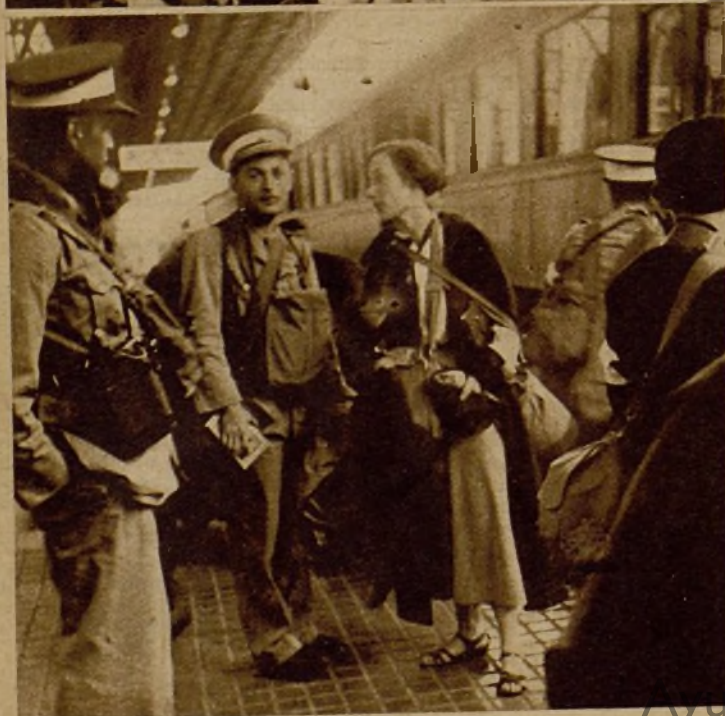
Miembros de la ambulancia sanitaria británica que prestará sus beneméritos servicios a los luchadores de la República, a su llegada a Port-Bou