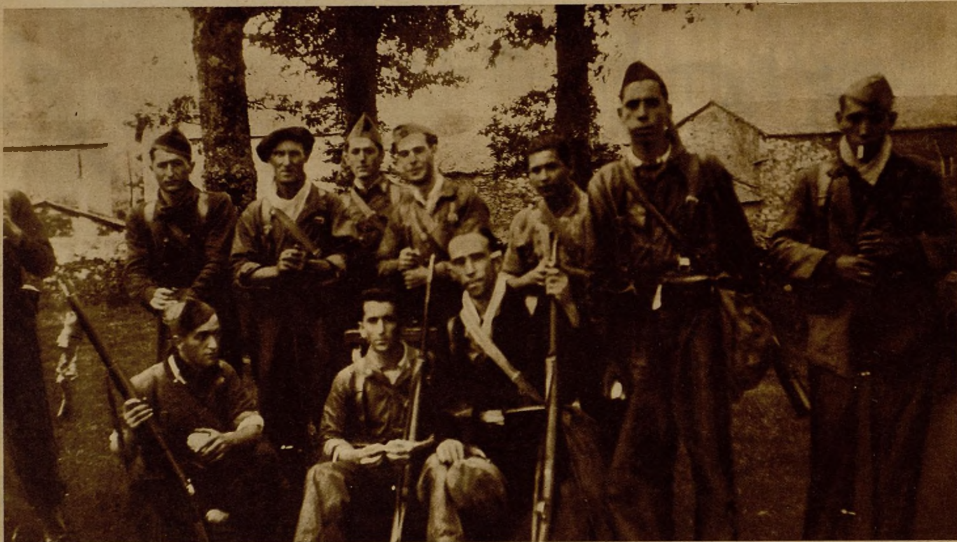
Grupo de milicianos montañeses que forma parte de la columna cántabra que lucha contra los facciosos llegados de Galicia con el intento de socorrer a las sitadas tropas del traidor Aranda

(POR AVION DE NUESTRO REDACTOR EN EL FRENTE DE ASTURIAS ANTONIO SOTO)