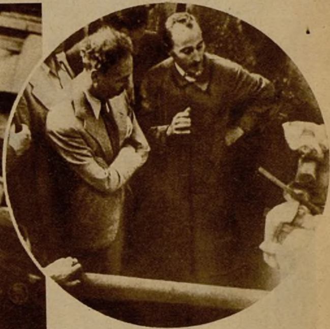
El presidente de la Generalidad, señor Companys, recibe explicaciones acerca de la fabricación de la trilita, que por primera vez se produce en Cataluña

Acallado el estrépito de las ametralladoras y fusilería en las calles de Barcelona, el día 20 de julio, se creyó haber parado el golpe traidor de los militares sublevados. Un puñado de hombres sin preparación, ayudados por las fuerzas de Orden Público, cerraron el paso a los facciosos, hasta rendirlos. Pero no se venció del todo y fué preciso bien pronto organizar columnas de hombres para libertar a los hermanos de Aragón, de Baleares y de donde fuere.