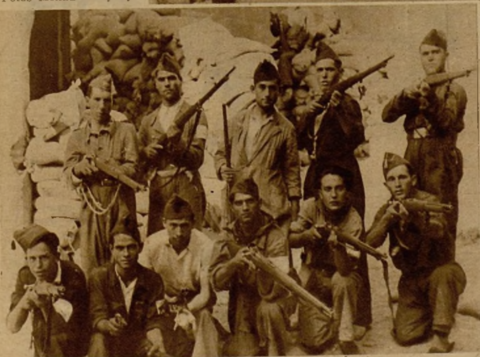
Grupo de milicianos que hacen guardia de parapeto en las inmediaciones del Alcázar toledano