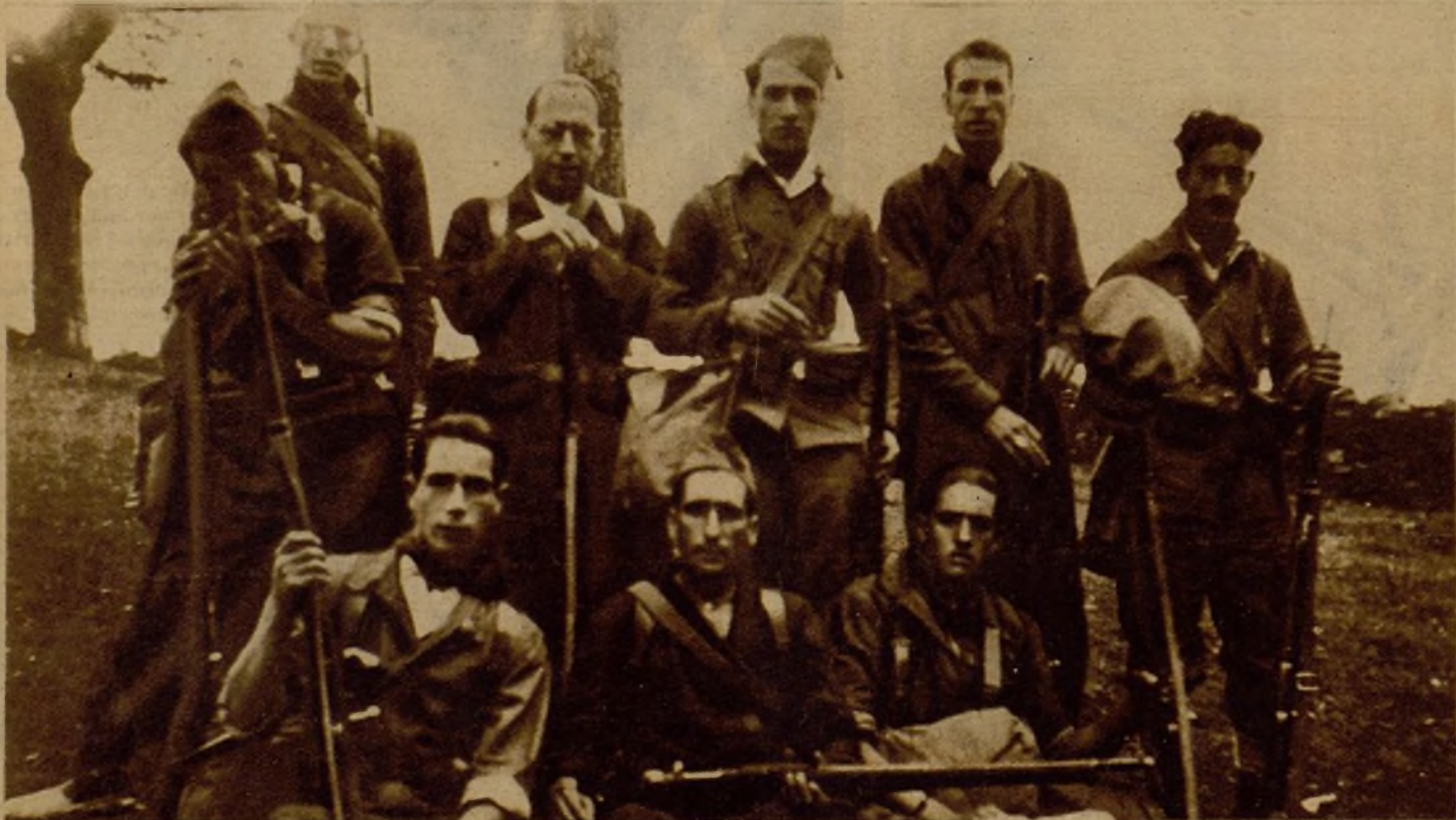
Profesionales de la enseñanza que forman en la columna local que lucha contra los rebeldes en Luarca

También dijo el prisionero que a los soldados les pagan 2,50 diarias cuando están en campaña, y les prometen inmediatos ascensos si se prestan a tirar contra sus hermanos. Contrasta esta actitud que los facciosos se ven obligados a adoptar con el desinterés demostrado siempre por nuestras heroicas Milicias, que nada cobran ni nada quieren.