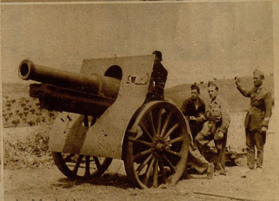
Uno de los cañones de 15 centímetros que han abierto brecha en los muros del Alcázar de Toledo