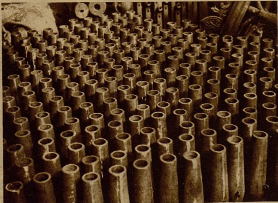
Las bombas para la Aviación se producen en gran abundancia, y las pruebas realizadas han satisfecho totalmente a los técnicos

la visita efectuada a las Industrias de Guerra tuvimos tema para llenar muchas cuartillas de frases, gestos y actitudes emocionantes. Pero no son estos los momentos para extendernos en literatura.