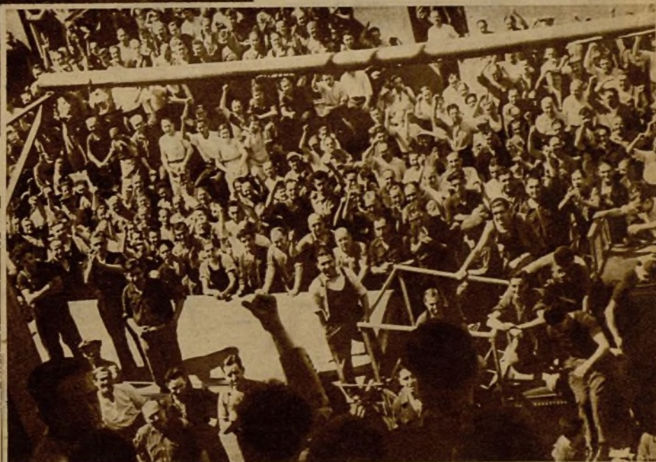
Los obreros de una fábrica dedicada a industrias de guerra hacen un entusiasta recibimiento al presidente de la Generalidad

Los periodistas que hemos acompañado al presidente de la Generalidad en