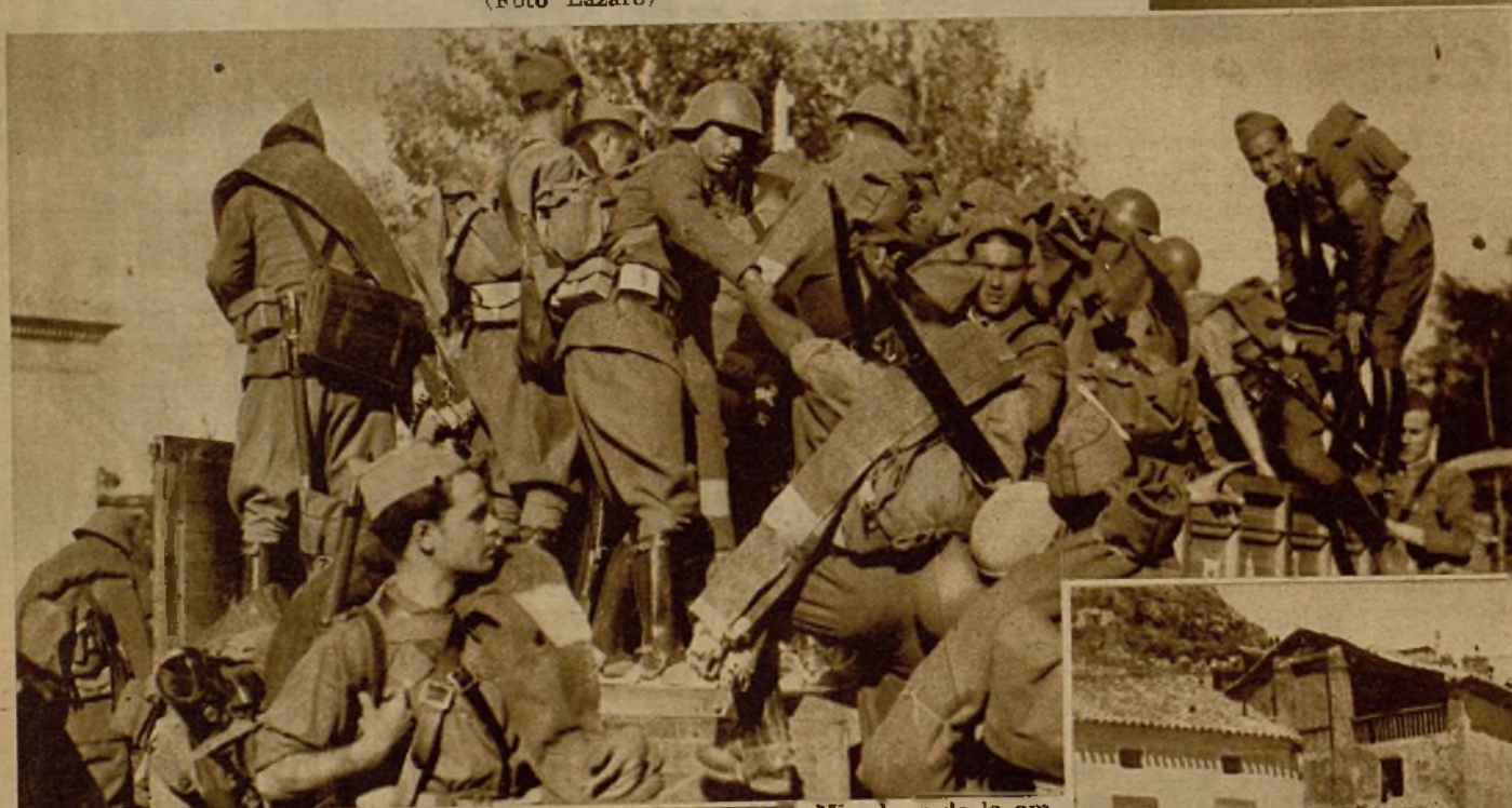
Soldados de Artillería que marchan hacia el frente, ocupando la camioneta que les transportó