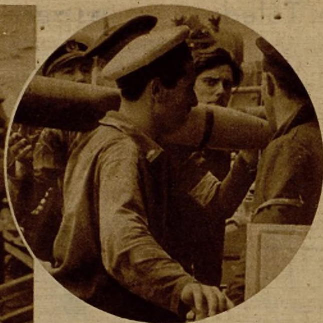
Un marinero transportando una de las bombas de los cañones del "Almirante Miranda" hacia las piezas