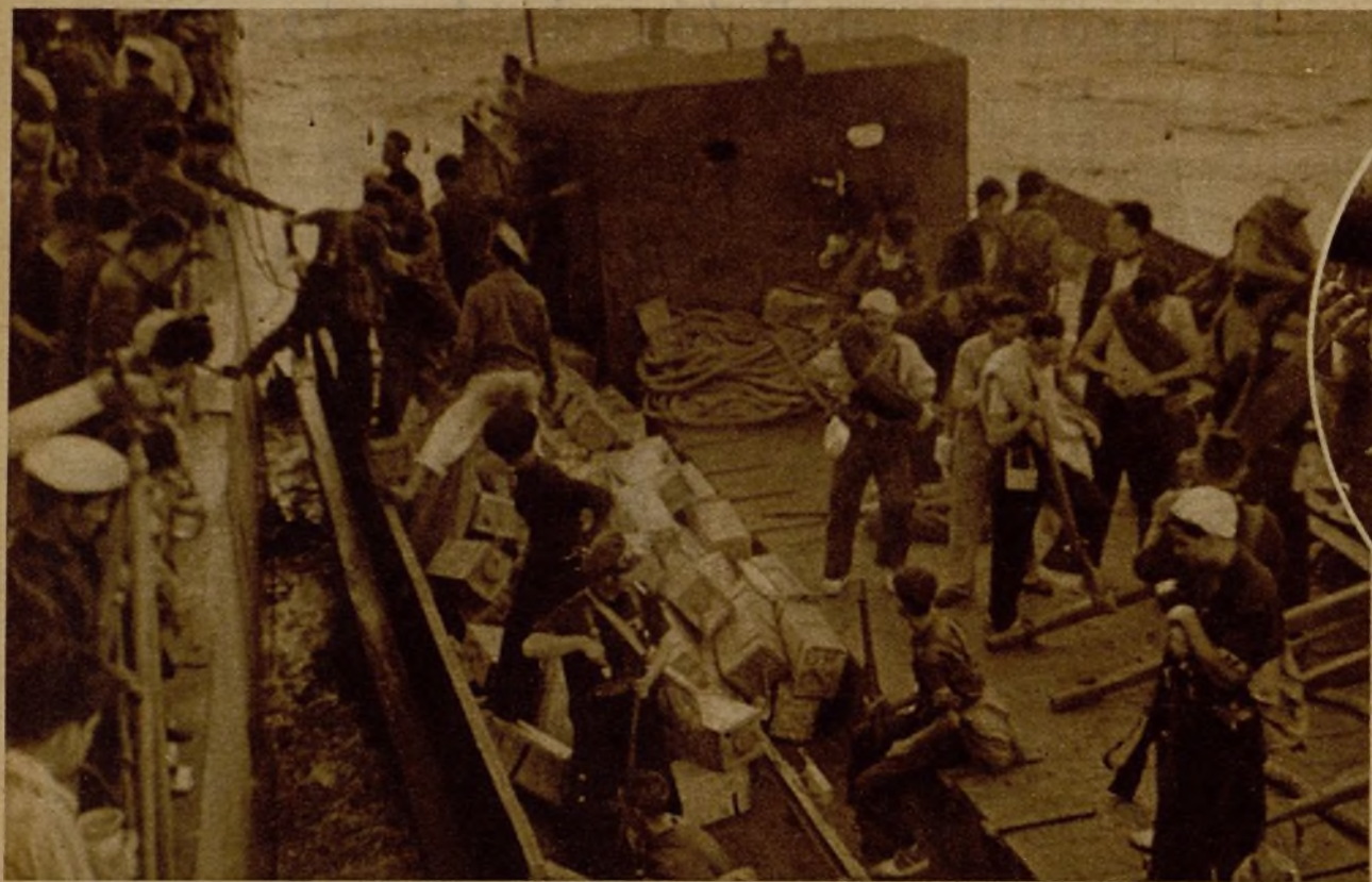
Los soldados y milicianos expedicionarios en Mallorca se trasladan desde el "Almirante Miranda" a las barcas que les han de llevar a tierra