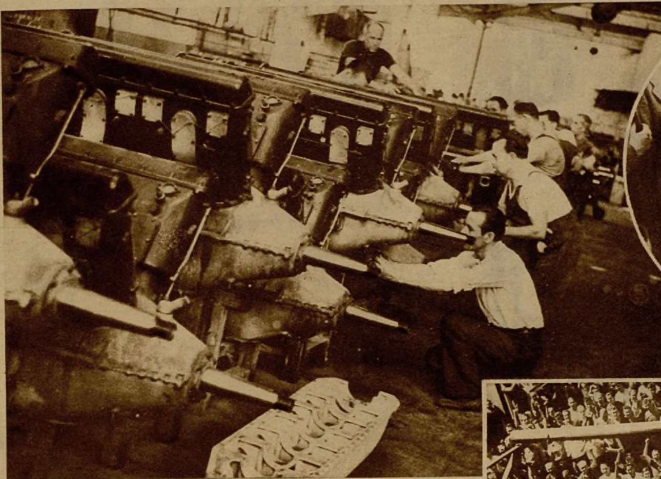
En la Hispano Suiza se fabrican magníficos motores de aviación para los aviones que construye la Aeronáutica Naval

EN CATALUÑA SE FABRICA MATERIAL DE GUERRA PARA LAS NECESIDADES DE SUS FRENTE DE COMBATE DE ARAGON Y BALEARES