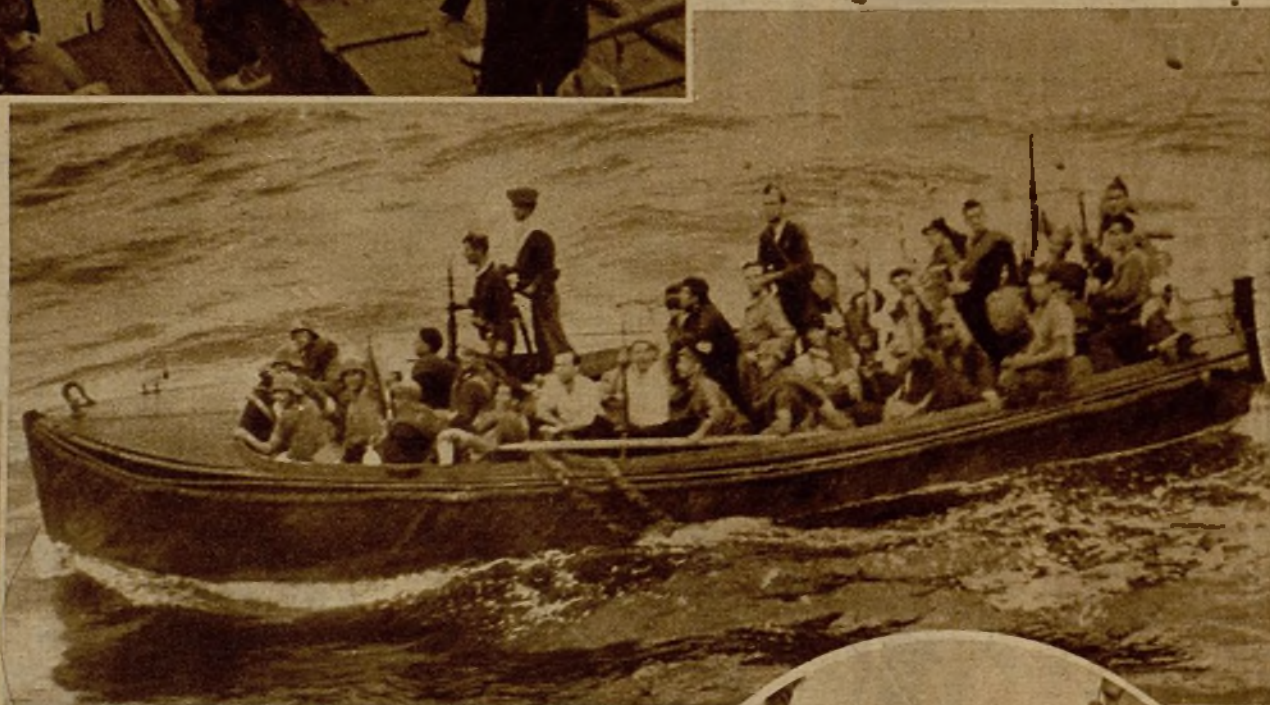
Una de las lanchas en que fueron transportadas las tropas de desembarco desde el "Almirante Miranda" a la playa