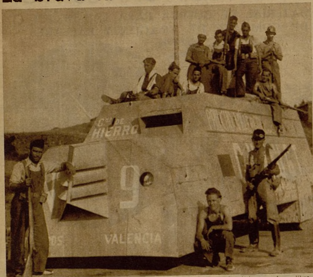
Uno de los tanques de la Compañía de Hierro que tomó parte en las últimas acciones libradas en las inmediaciones de Teruel