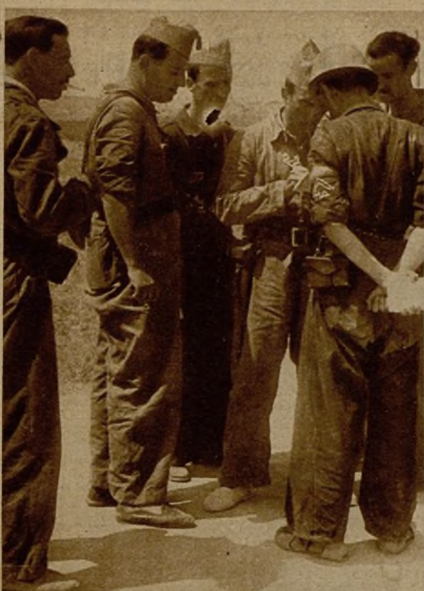
Estos milicianos constituyen la plana mayor de la popular columna Thaelman, que se bate esforzadamente en Aragón