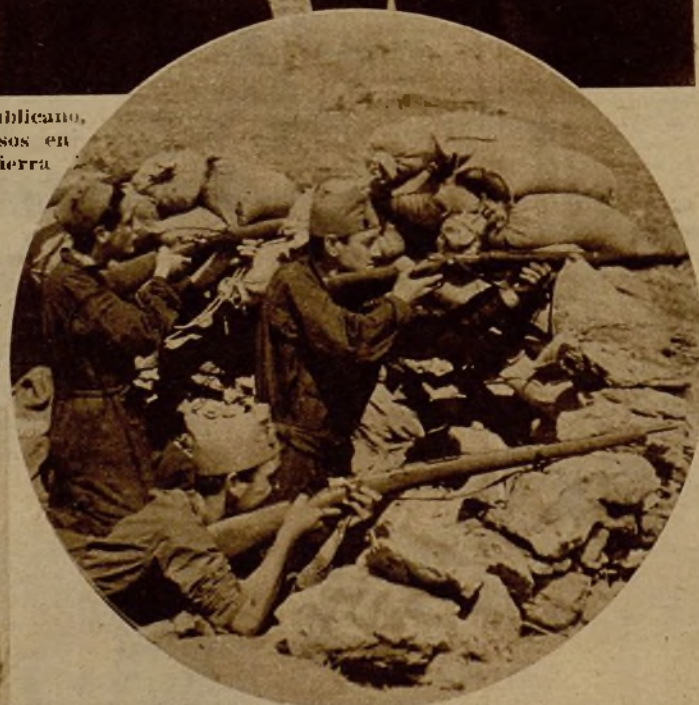
Una avanzadilla situada en la primera línea del sector de Peguerinos