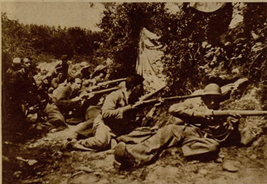
Una de las avanzadillas de milicianos que cercan a Oviedo en constante vigi-lancia para frustrar cualquier intento de ataque

mités gracias a los cuales la vida ciu-dadana sigue funcionando normalmente en los lugares alejados de la lucha y con tacto y acierto extraordinarios en los sitios donde la guerra toca de cerca.