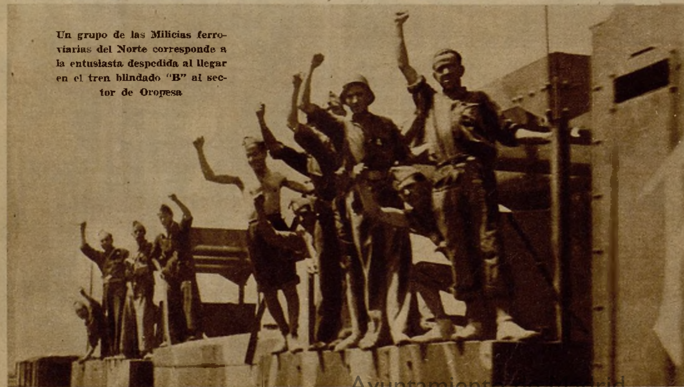
Un grupo de las Milicias ferroviarias del Norte corresponde a la entusiasta despedida al llegar en el tren blindado "B" al sector de Oropesa