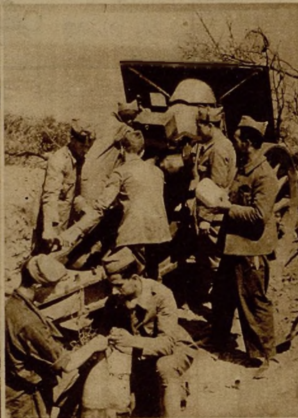
Pieza de grueso calibre emplazada por nuestros artilleros en un lugar estratégico, y con la que se causó gran destrozo a las columnas enemigas que sufrieron el descalabro de Peguerinos