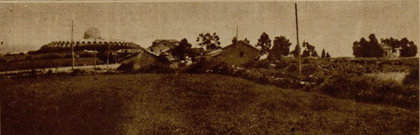
A la izquierda, el depósito de aguas de Oviedo, y a la derecha, escondida entre árboles, la iglesia del Cristo, dos reduc-tos de los rebeldes de Oviedo, que están tan estrechamente cercados, que la fotografía ha sido obtenida a la distancia de trescientos metros