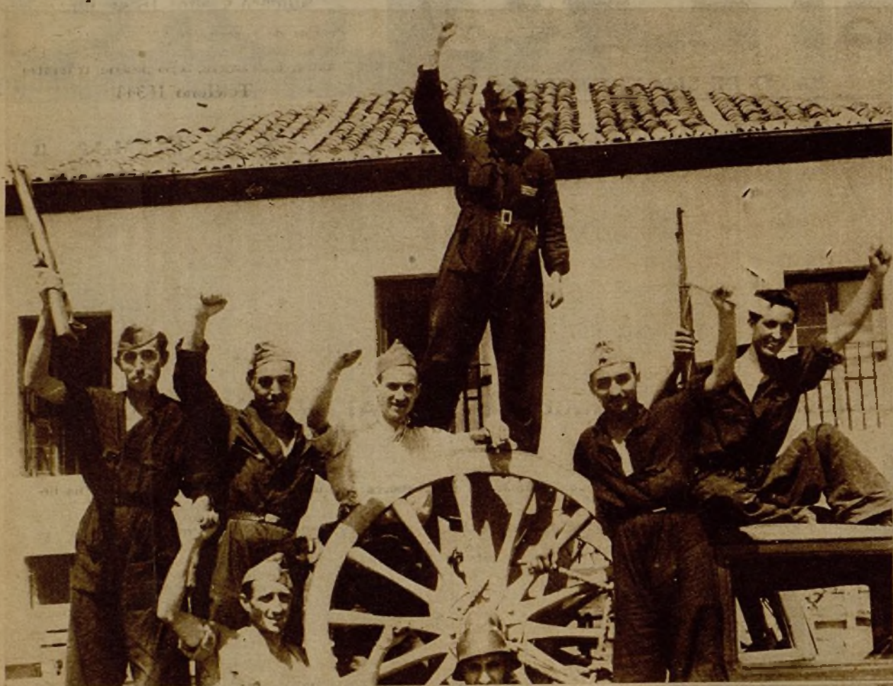
Grupo de milicianos del frente de Peguerinos con un cañón del 75 que cogieron a los rebeldes