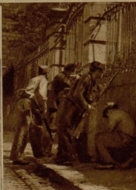
Los milicianos, atacando el cuartel desde la verja, obligaron a los rebeldes a retirarse a los sótanos

trica (tarde y noche, butaca, 1 peseta). TIVOLI. — A las 6.45, Rebelde (la mejor creación de Shirley Temple).