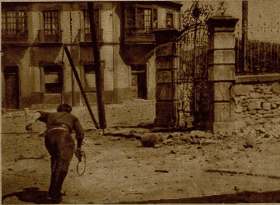
A la izquierda, uno a uno, bajo el fuego de los rebeldes pasaron este lugar los milicianos para acercarse a los muros del cuartel de Simancas. A la derecha, los primeros dinamitos que llegaron al pie de la verja.