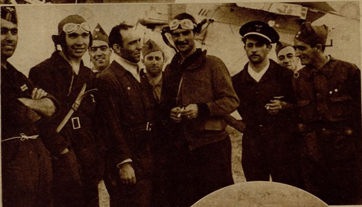
Grupo de bravos pilotos del Ejército republicano, que han derribado varios aparatos facciosos en las últimas acciones del frente de la Sierra