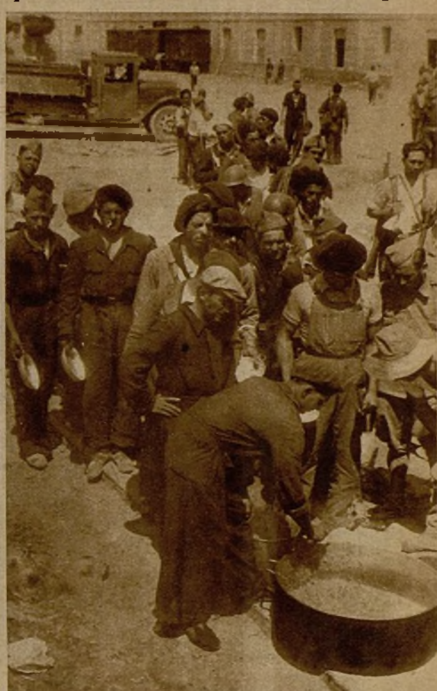
En plena plaza de Barbastro los milicianos instalan sus cocinas. Los voluntarios forman cola, en la grata hora de reponer fuerzas, para recoger sus platos de rancho