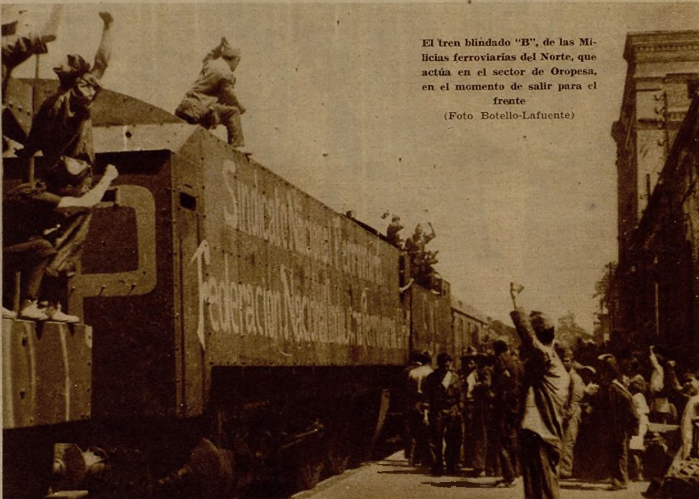
El tren blindado "B", de las Milicias ferroviarias del Norte, que actúa en el sector de Oropesa, en el momento de salir para el frente

Estamos a 30. El tren blindado, cuyo servicio llevan las Milicias ferroviarias del Norte, hace su primera salida. El terreno es desconocido. Todo el tren, hasta el servicio de las piezas, es efectuado por los milicianos ferroviarios. El calor es agobiante. Pronto los monos caen; después otras prendas. Cuerpos desnudos y sudorosos. Ojos y bocas se pegan a las troneras para ver y respirar. Los encargados de las ametralladoras preparan agua y abren las cajas de los peines.