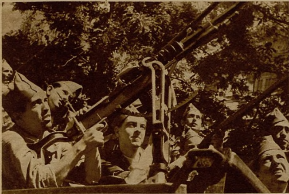
Oculto por el ramaje, se ha emplazado esta ametralladora antiaérea. La acción contra los aviones facciosos ha sido de gran eficacia, anulando muchos intentos de incursión sobre nuestras líneas