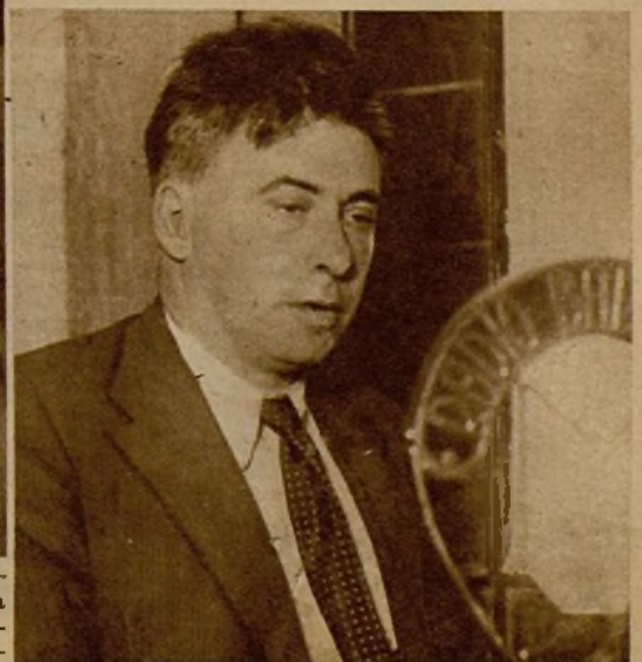
El famoso escritor ruso Erenburg durante una conferencia que ha dado en Barcelona acerca de la heroica lucha que el pueblo español sostiene contra el fascismo