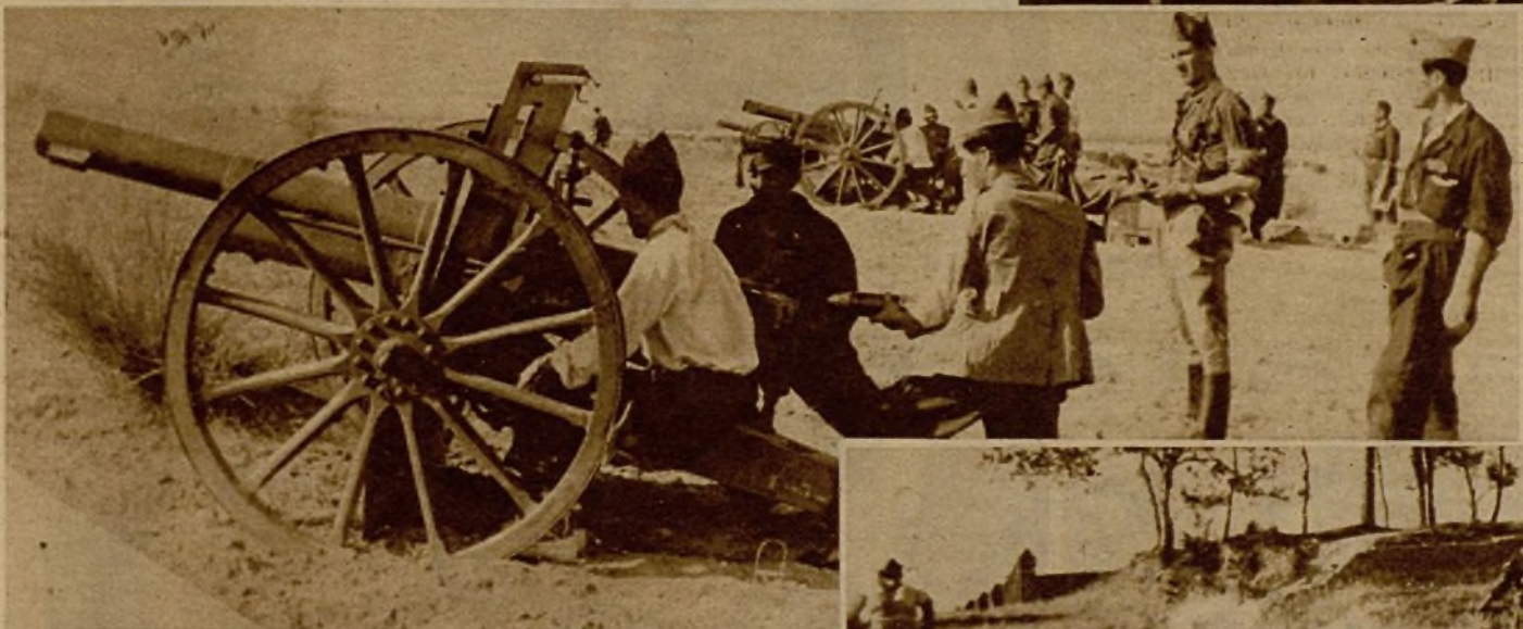
La artillería coopera con magnífica eficacia a la contención de los rebeldes en el frente de Extremadura y al contraataque iniciado por nuestras tropas. Varias piezas protegiendo con su fuego el avance de la infantería