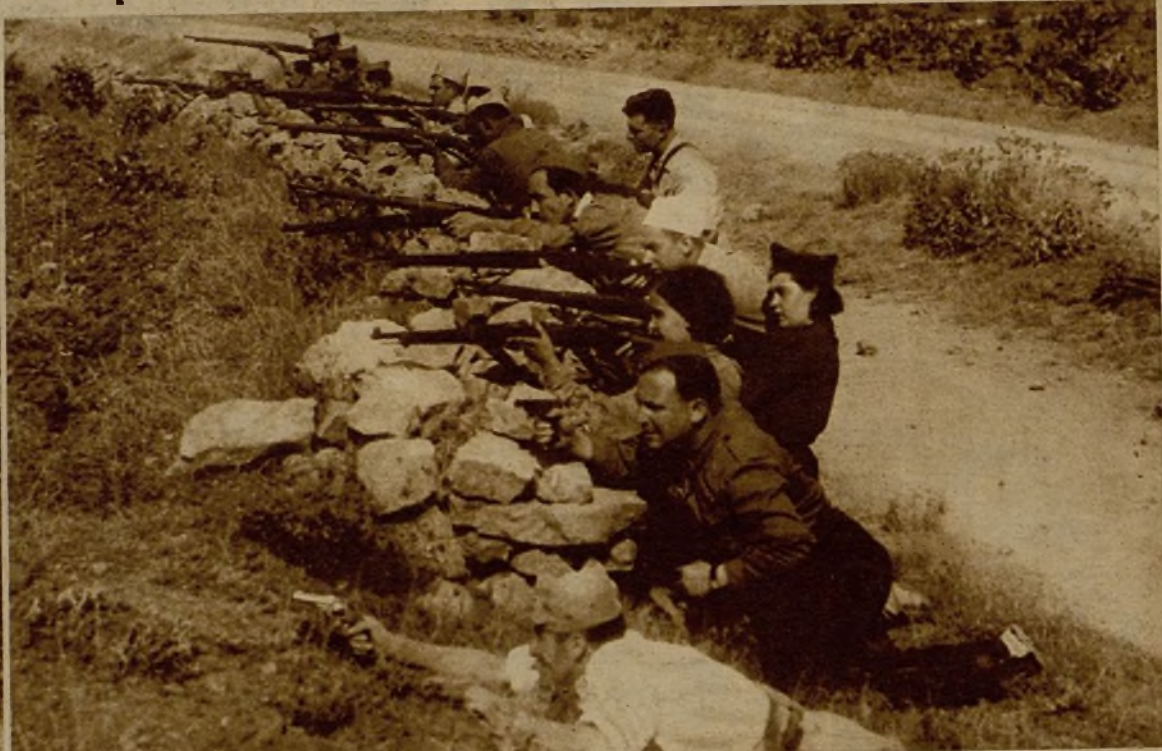
Tiradores escogidos, entre los que figuran dos bravas milicianas, vigilan la carretera, que los facciosos atacan frecuentemente

En el frente de Aragón, donde nuestras fuerzas tienen reducidas las plazas a estrechísimo cerco y materialmente imposibilitado todo intento de ofensiva, se esperan de un momento a otro acontecimientos decisivos. De las poblaciones sitiadas escapan soldados que se incorporan a nuestras filas y dan cuenta de la extrema situación de aquéllas y del general desaliento que domina a las fuerzas rebeldes. En la fotografía aparecen unos milicianos que, emboscados entre pinos y matorrales, tirotean al enemigo desde una avanzadilla