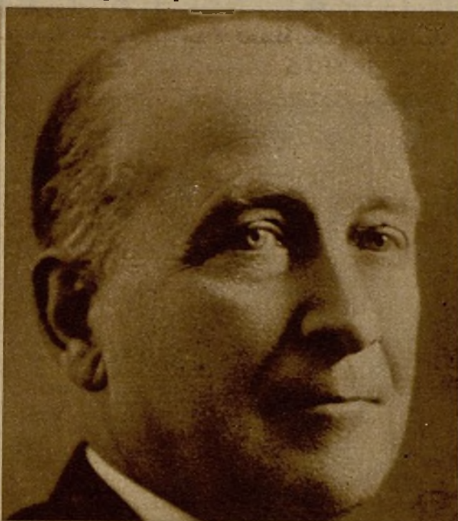
FRANCISCO LARGO CABALLERO (socialista), Presidencia y Guerra