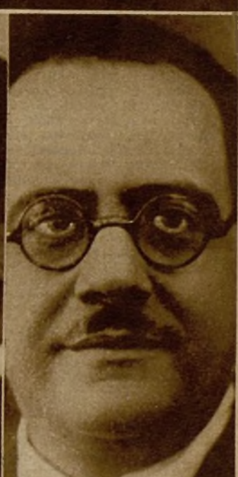
Juan Negrín (socialista), Hacienda