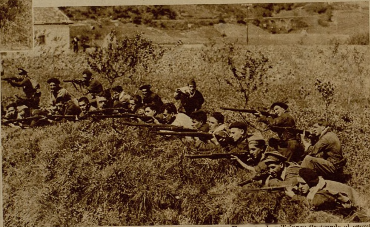
Un grupo de milicianos tiroteando al enemigo al ocupar nuevas posiciones