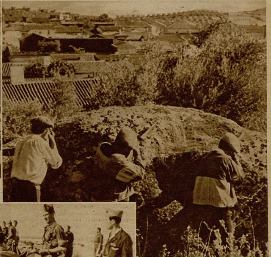
Los campesinos extremeños que se unen a nuestras tropas a medida que éstas van desalojando al enemigo de los terrenos en que aquéllos buscaban refugio, se batan bravamente en las primeras líneas. He aquí a varios de ellos atacando a un pueblecito cacereño que fué a poco ocupado