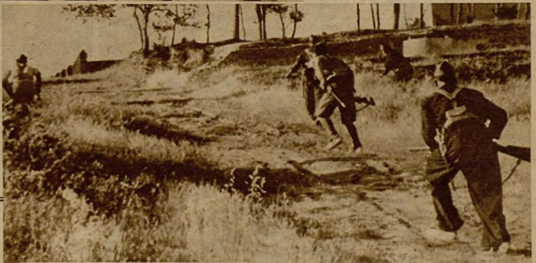
Después de una eficaz preparación artillera, que hizo abandonar a los facciosos sus posiciones, los milicianos, desplegados en guerrillas, atacaron por varios puntos un pueblecito extremeño, cuyas primeras casas asoman en la foto, y desalojaron a los rebeldes