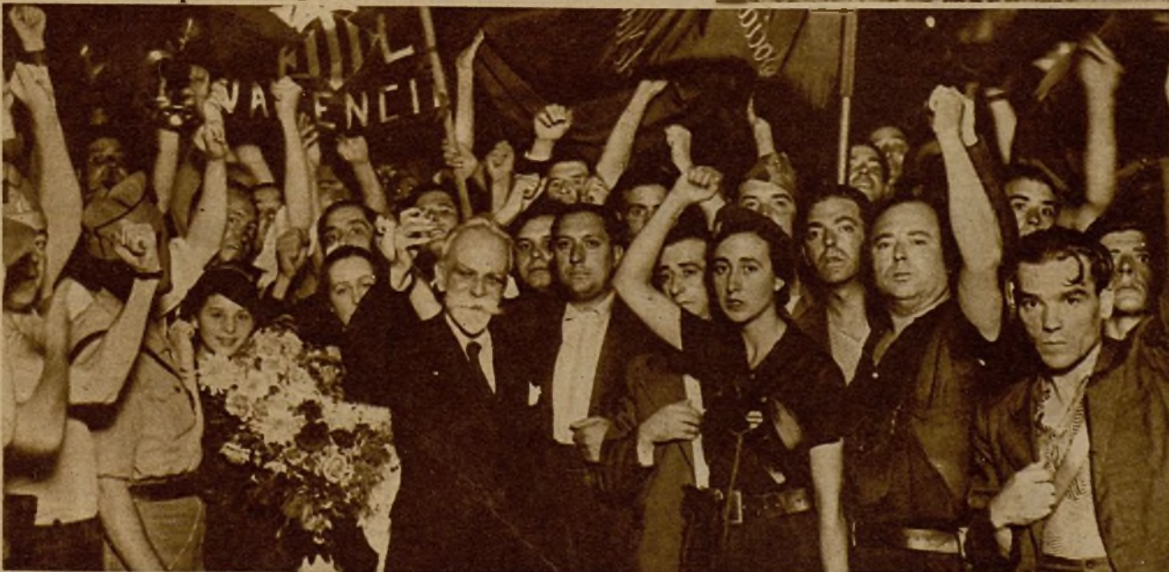
El ex presidente de la República portuguesa don Bernardino Machado, recibido entusiastamente por las Milicias a su llegada a Valencia