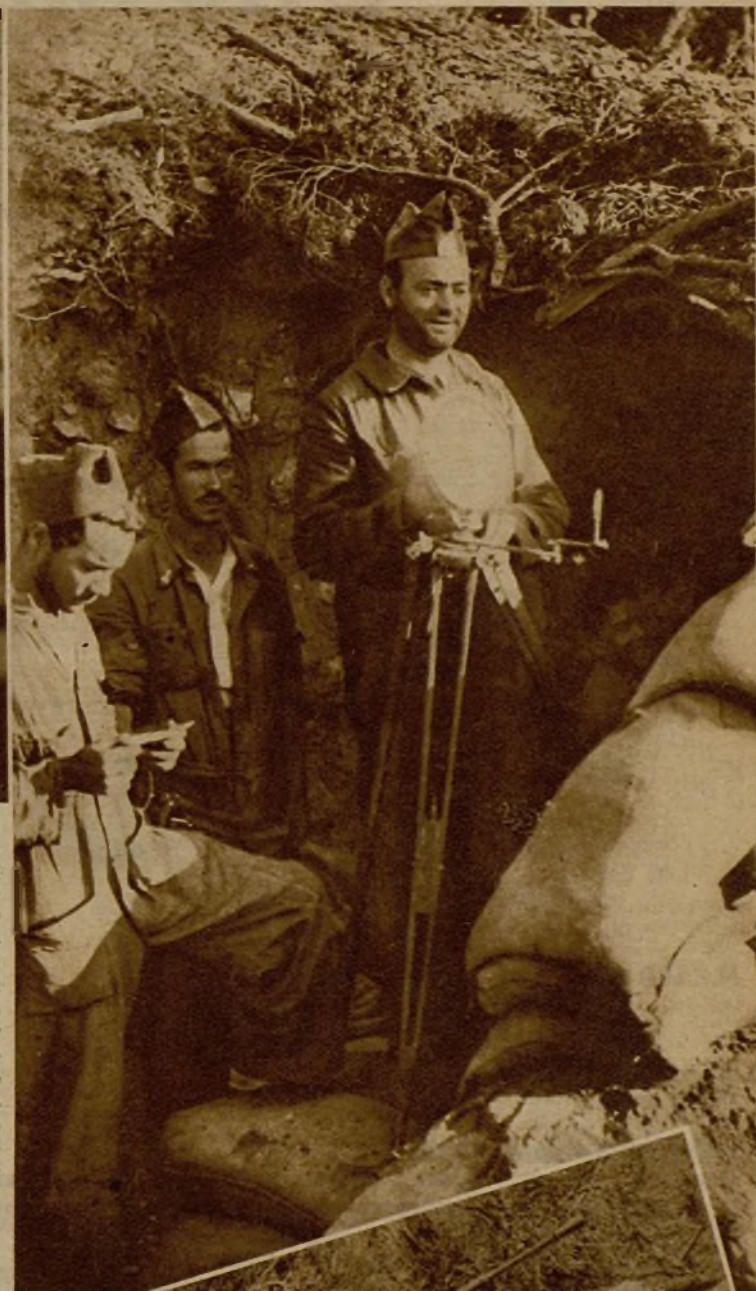
Los servicios de comunicaciones entre los puestos de mando y las líneas de combate están perfectamente organizados en nuestros frentes. He aquí el momento de una transmisión por medio del heliógrafo desde Navafría a Lozoyuela