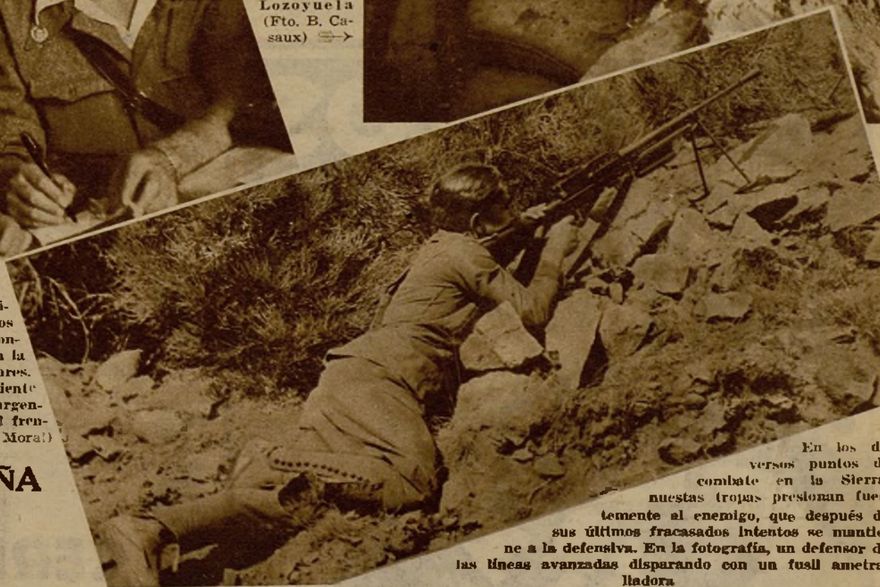
En los diversos puntos de combate en la Sierra, nuestras tropas presionan fuertemente al enemigo, que después de sus últimos fracasados intentos se mantiene a la defensiva. En la fotografía, un defensor de las líneas avanzadas disparando con un fusil ametralladora