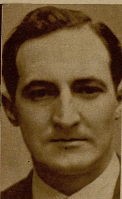
José Antonio de Aguirre (nacionalista vasco), Obras Públicas