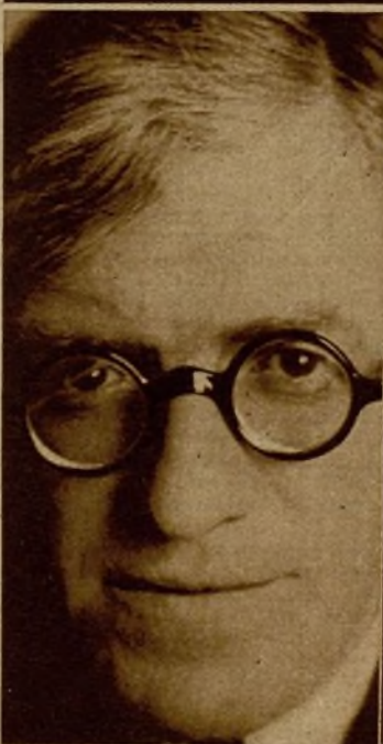
Julio Álvarez del Vayo (socialista), Estado