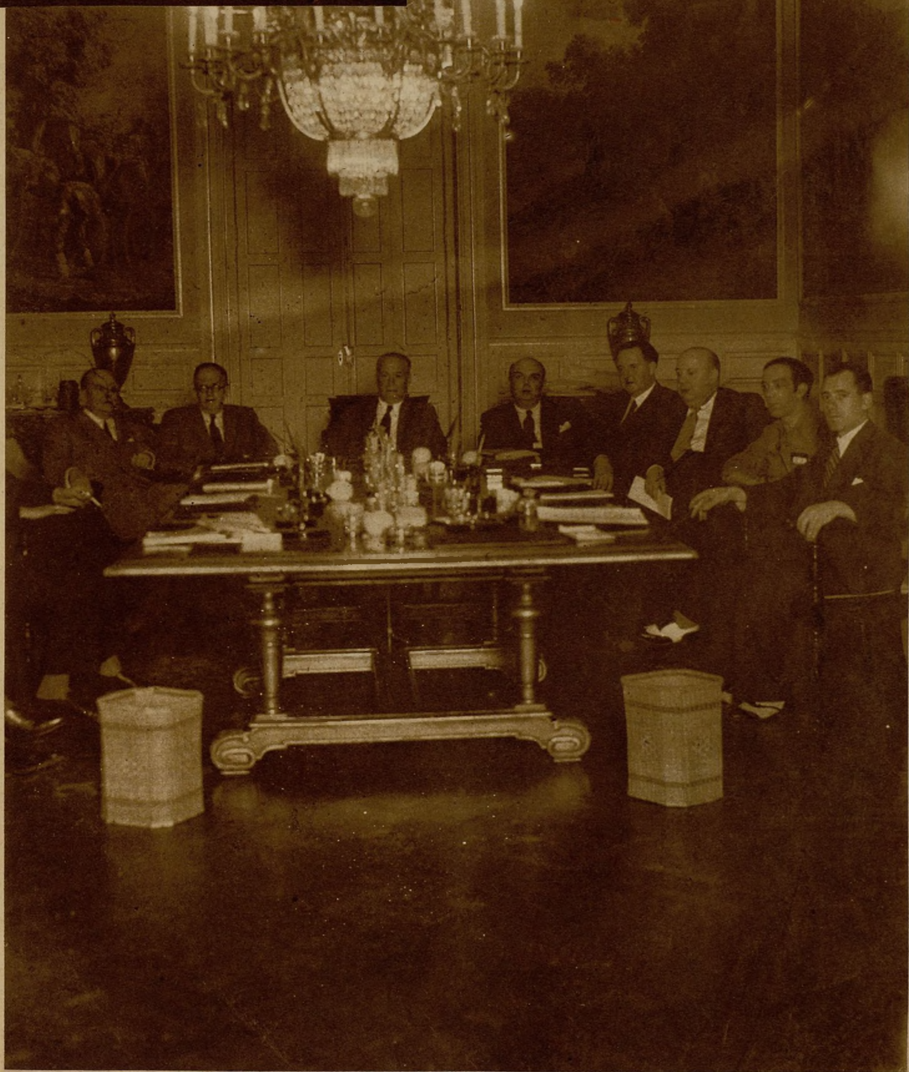
EL NUEVO GOBIERNO DEL FRENTE POPULAR.—El Consejo de ministros presidido por el señor Largo Caballero e integrado por seis socialistas, dos comunistas, dos de Izquierda Republicana, uno de Unión Republicana, un nacionalista vasco y uno de la Esquerra de Cataluña, celebró anoche su primera reunión para acordar los términos de la declaración ministerial