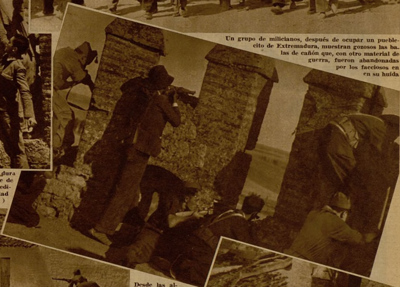
Desde las almenas de un viejo edificio, en un pueblecito extremeño de las avanzadas, nuestros soldados y milicianos hacen fuego sobre las posiciones enemigas. A la derecha, otro momento de la lucha