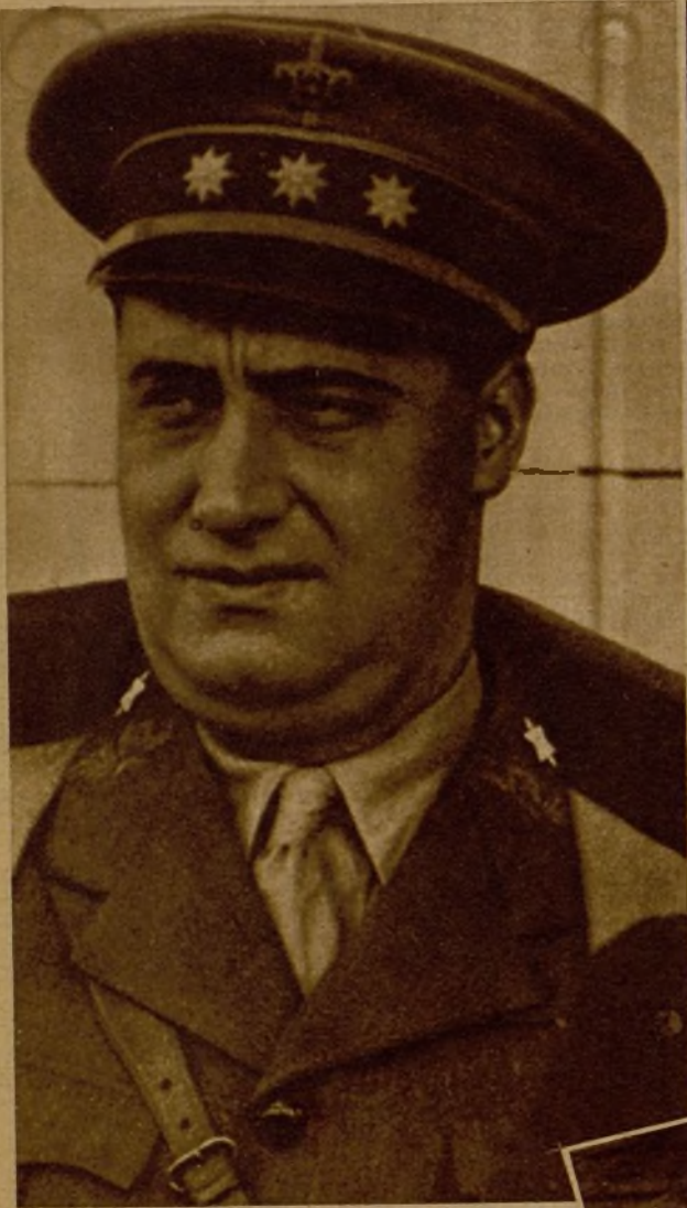
El ilustre coronel Asensio, ascendido a general y nombrado por el Gobierno jefe de operaciones del Centro de España.