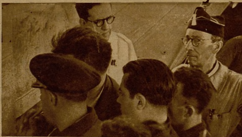
El comandante señor Reyes, jefe de la base aérea, con el periodista ruso Erenbourg y varios jefes de Milicias examinan, ante el mapa de Huesca, la zona de operaciones de nuestras tropas