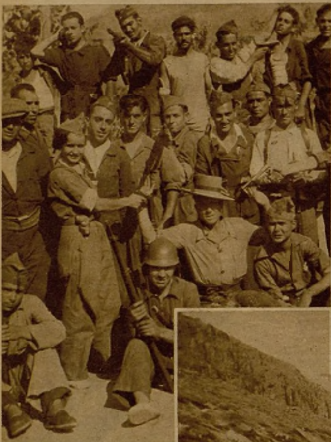
Grupo de milicianos procedentes de Cartagena, y que se batieron en el frente granadino, en el bienhumorado momento de un descanso en la retaguardia