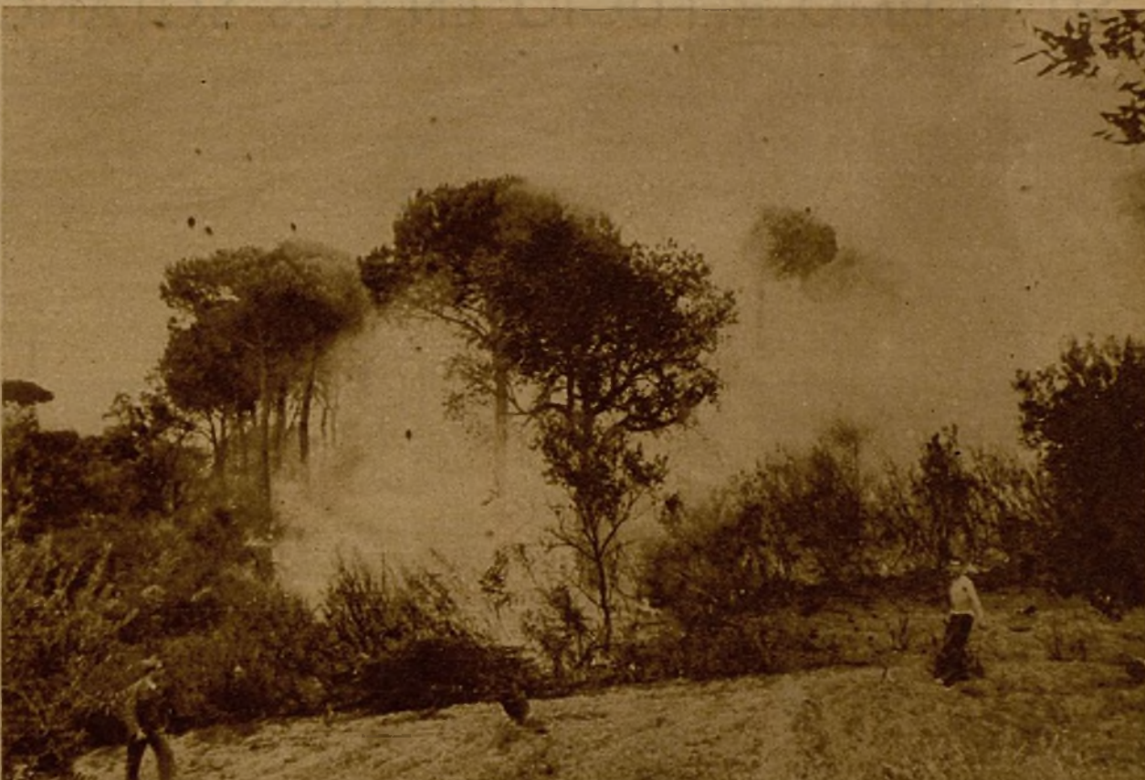
Una avanzadilla en Cerro Muriano. Varios soldados actuando con morteros de Infantería sobre las posiciones enemigas