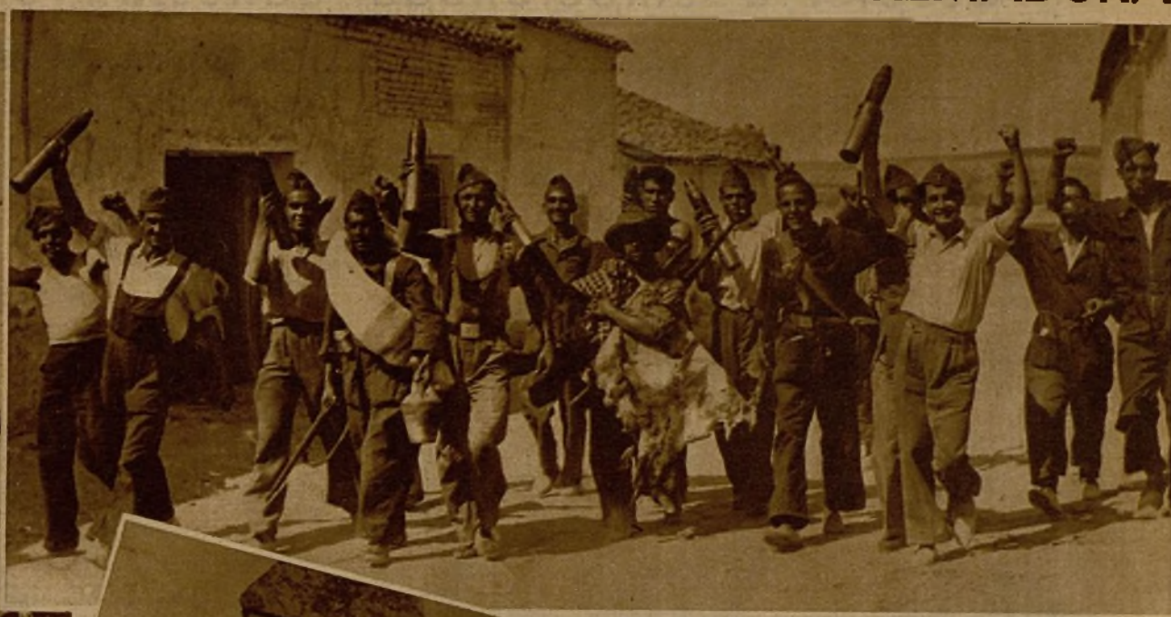
Un grupo de milicianos, después de ocupar un pueblecito de Extremadura, muestran gozosos las balas de cañón que, con otro material de guerra, fueron abandonadas por los facciosos en su huida