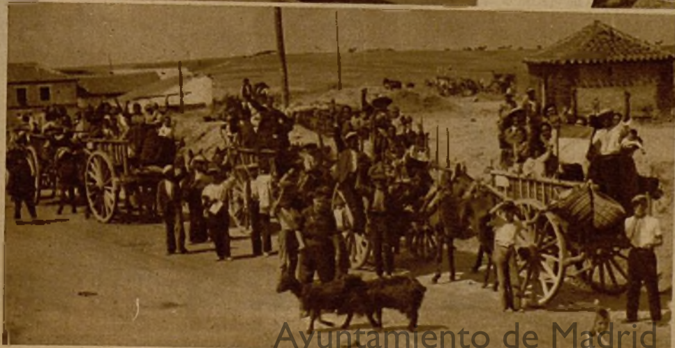
Una caravana de campesinos que, emocionados, llegan a su pueblo, reconquistado por nuestras tropas