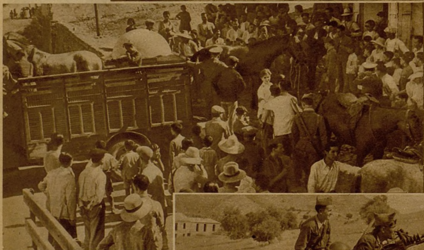
Soldados y milicianos descargando caballerías de un tren llegado al frente