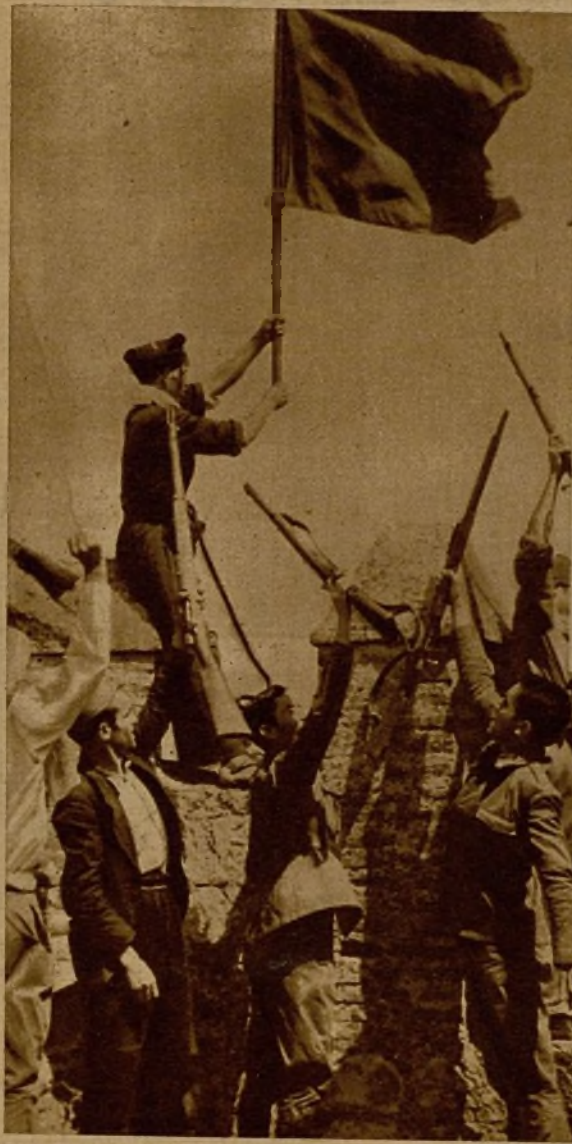
Las tropas republicanas, después de una dura lucha, han ocupado un pueblo en el frente de Extremadura, y colocan sobre uno de los edificios más elevados la bandera de la Libertad