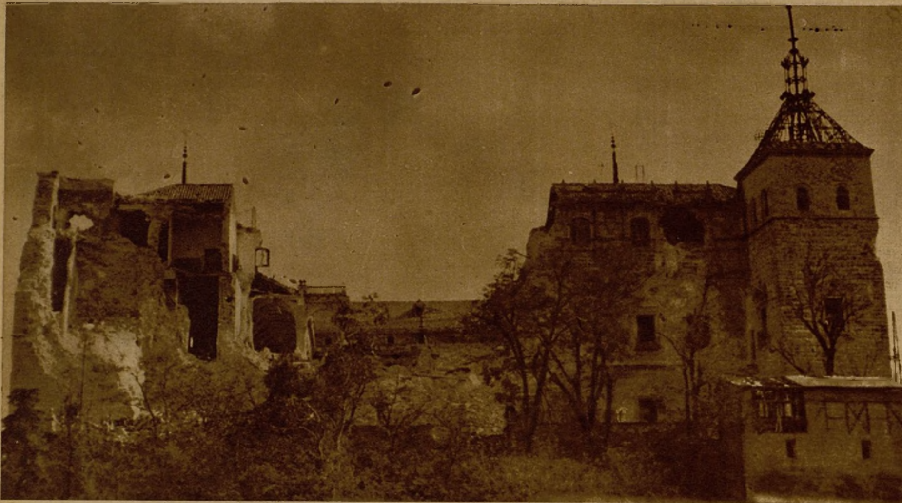
Efectos producidos por los disparos de nuestra artillería en la fachada norte del Alcázar de Toledo, el refugio de la estúpida y criminal resistencia de los facciosos de la histórica ciudad