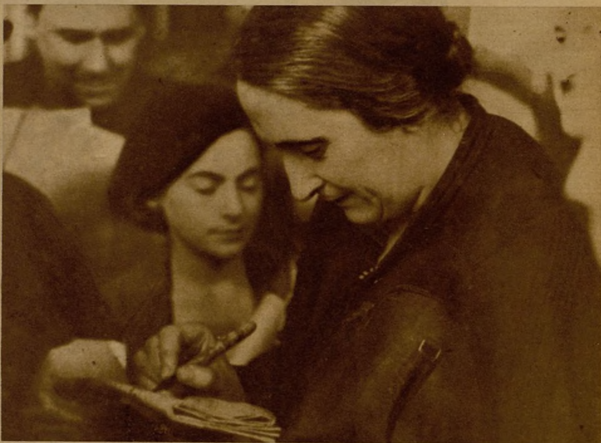
Las masas populares parisiñas han acogido con fraternal adhesión la presencia en aquella capital de la diputada comunista Dolores Ibarruri "Paslonaria", llegada allí en unión de otros varios ilustres representantes de nuestro Frente Popular. Heja aquí firmando autógrafos a entuslastas simpatizantes con nuestra lucha frente al fascismo. A la izquierda, "Paslonaria" pronunciando un discurso, que fué aplaudido calurosamente por la muchedumbre que lo escuchó en el Velódromo de Invierno.