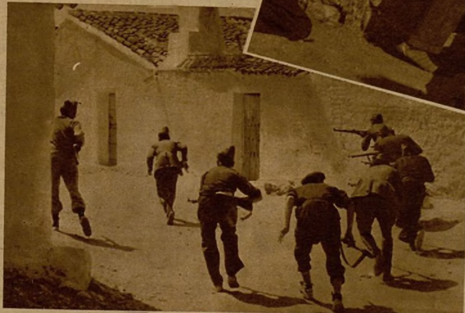
Desplegados en guerrilla, nuestros milicianos entran en un pueblo de Extremadura que los facciosos habían defendido obstinadamente y en el que abandonaron numerosas armas y municiones