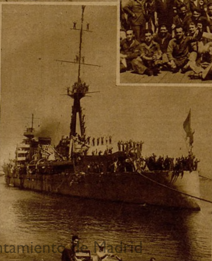
He aquí a la dotación del "Libertad", otro de los buques que la fidelidad de las clases y marinería conservó al servicio del Gobierno legítimo. Los tripulantes fueron objeto de un gran homenaje popular a la entrada del barco en el puerto de Cartagena