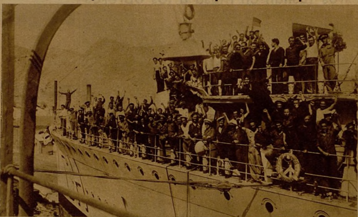
Los marinos del destructor "Churruca" corresponden al entusiasta recibimiento que se les tributó en Cartagena