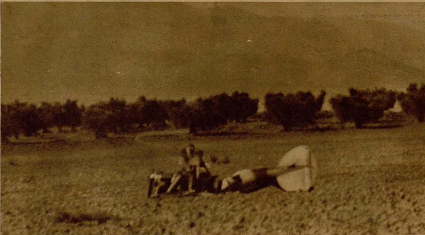
Un "caza" enemigo derribado junto a nuestras avanzadas del sector Talavera-Oropesa, durante los combates de ayer