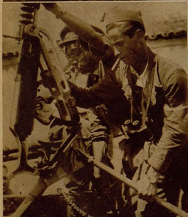
Soldados montando una ametralladora para disparar contra un avión en nuestro frente de Talavera