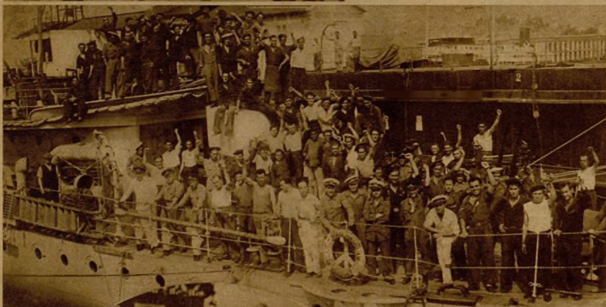
Otra vista del "Churruca" en el emocionante momento de su entrada en Cartagena, incorporado a la Armada republicana