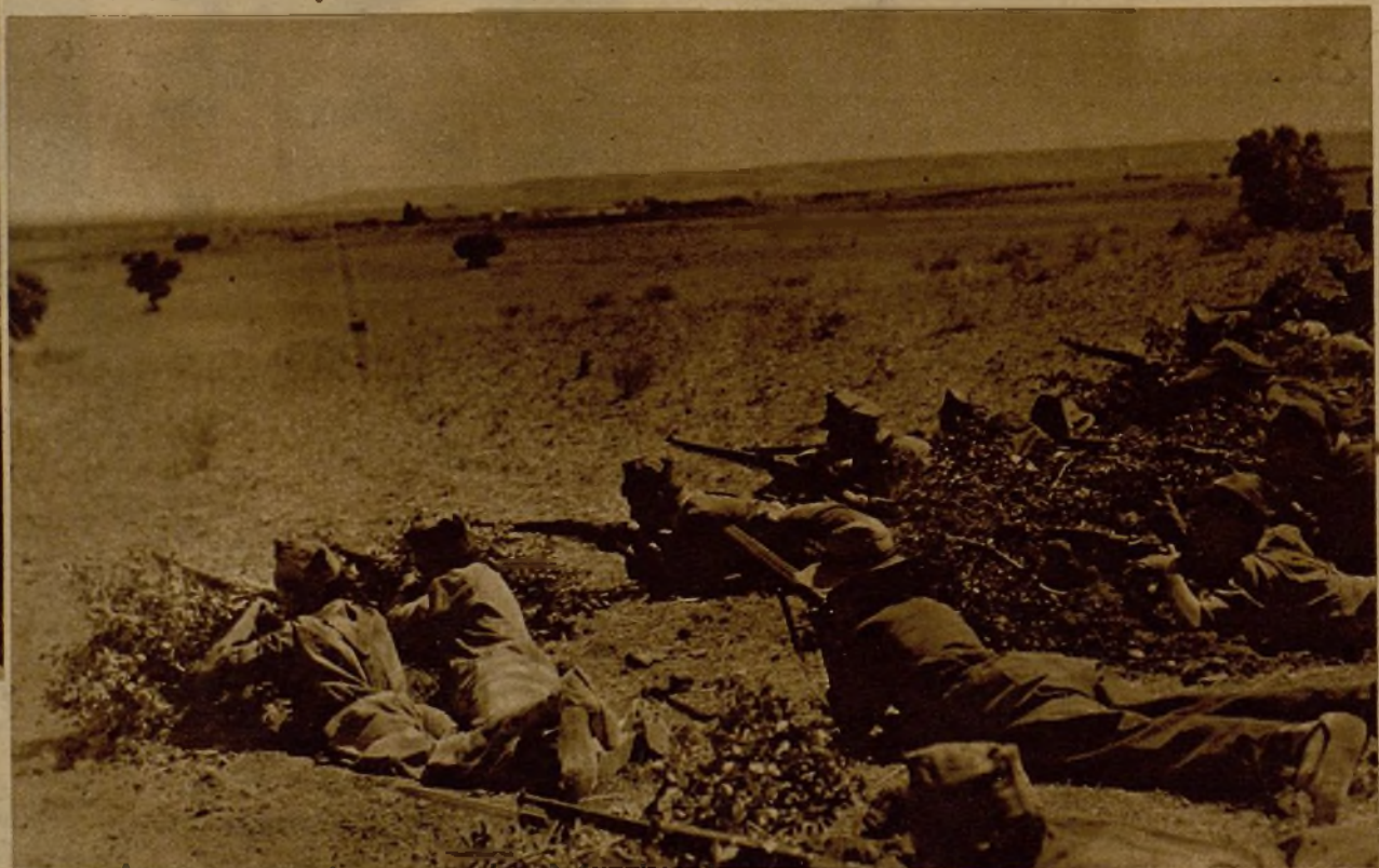
Milicianos de una avanzadilla haciendo fuego contra las primeras líneas facciosas