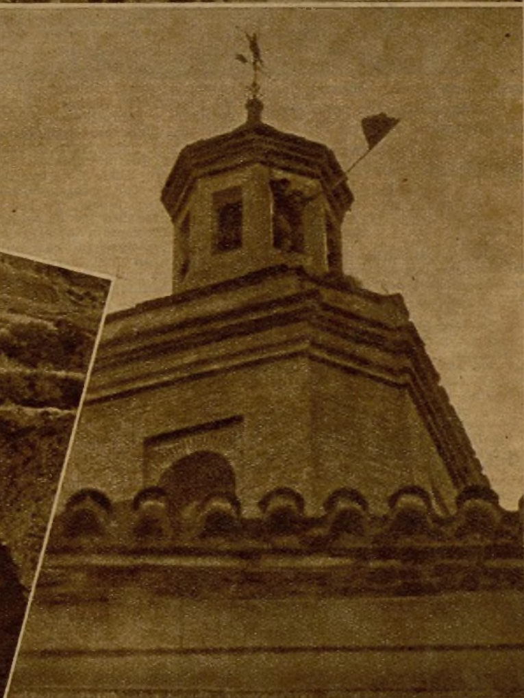
En la torre de un pueblo de la provincia de Granada, momentos después de ser ocupado por nuestras tropas, ondea la bandera de la República