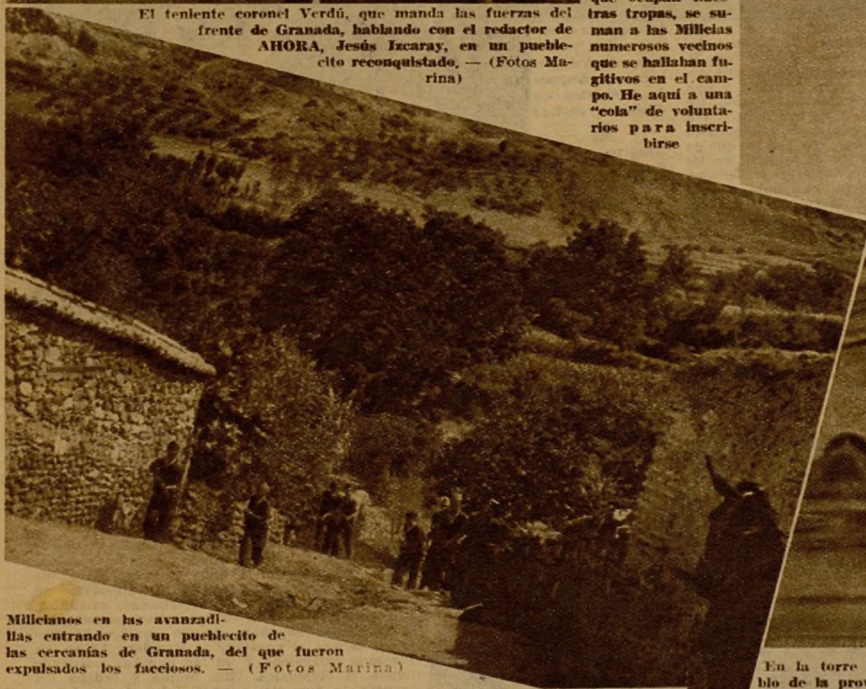
Milicianos en las avanzadillas entrando en un pueblito de las cercanías de Granada, del que fueron expulsados los facciosos.