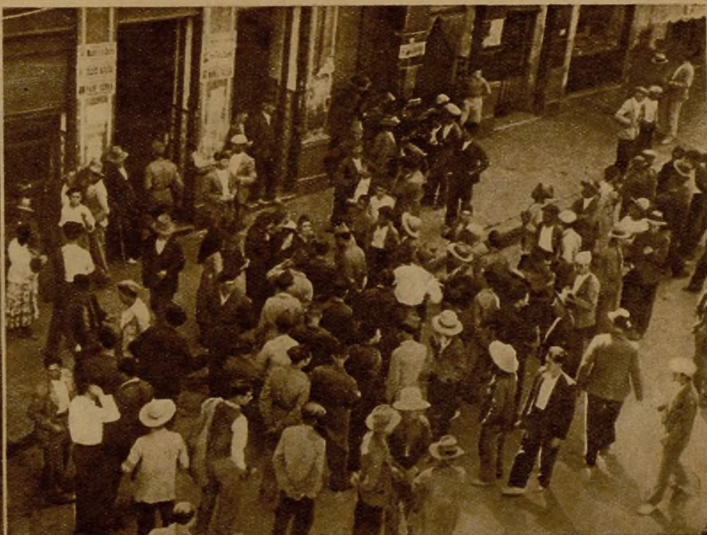
En todos los pueblos de la provincia de Granada que ocupan nuestras tropas, se suman a las Milicias numerosos vecinos que se hallaban fugitivos en el campo. He aquí a una "cola" de voluntarios para inscribirse