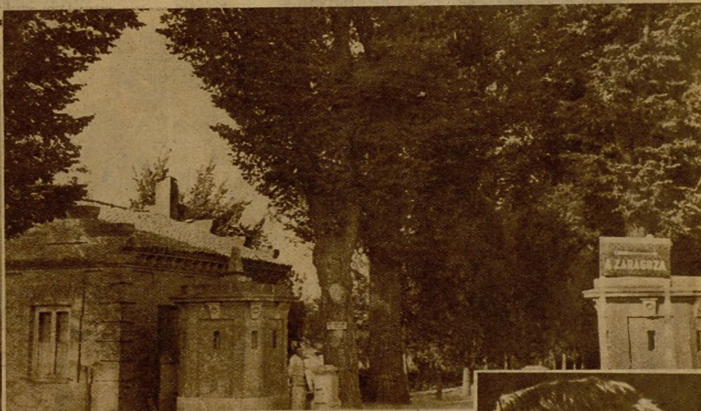
La hermosa finca conocida por el nombre de Alameda de Osuna, situada en la carretera de Aragon, que, por iniciativa del Socorro Rojo Internacional, va a ser destinada a Parque Infantil y Hogar Escuela