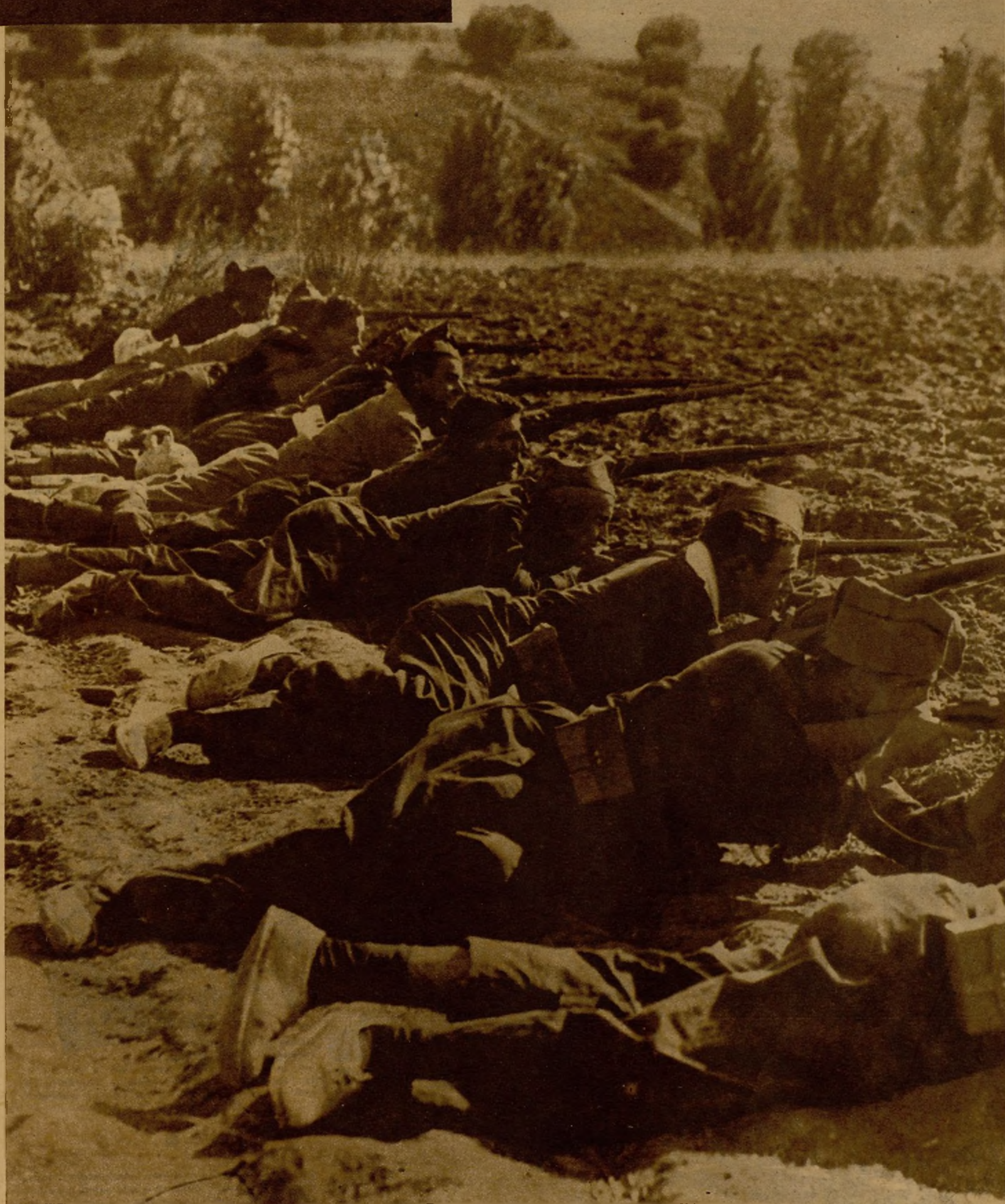
LAS COLUMNAS ENEMIGAS SE HAN VISTO OBLIGADAS A UN GRAN REPLIEGUE EN EXTREMADURA. —El avance de las columnas republicanas sobre Talavera, profundizando por las alas en buen número de kilómetros, ha colocado a los facciosos en tan crítica situación que de un momento a otro habrán de abandonar el pueblo, ante el peligro de verse alcanzados por nuestro movimiento envolvente. En el día de ayer la artillería leal no ha cesado un momento de atacar las posiciones rebeldes, obligando a éstos a un desordenado repliegue por los flancos. En la fotografía, soldados de una avanzadilla tiroteando al enemigo.