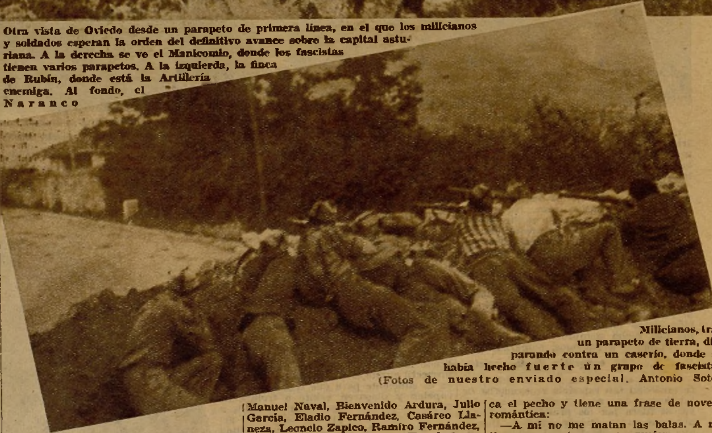
Milicianos, tras un parapeto de tierra, disparando contra un caserío, donde se había hecho fuerte un grupo de fascistas

Otra vista de Oviedo desde un parapeto de primera línea, en el que los milicianos y soldados esperan la orden del definitivo avance sobre la capital asturiana. A la derecha se ve el Manicomio, donde los fascistas tienen varios parapetos. A la izquierda, la finca de Rubín, donde está la Artillería enemiga. Al fondo, el Naranco