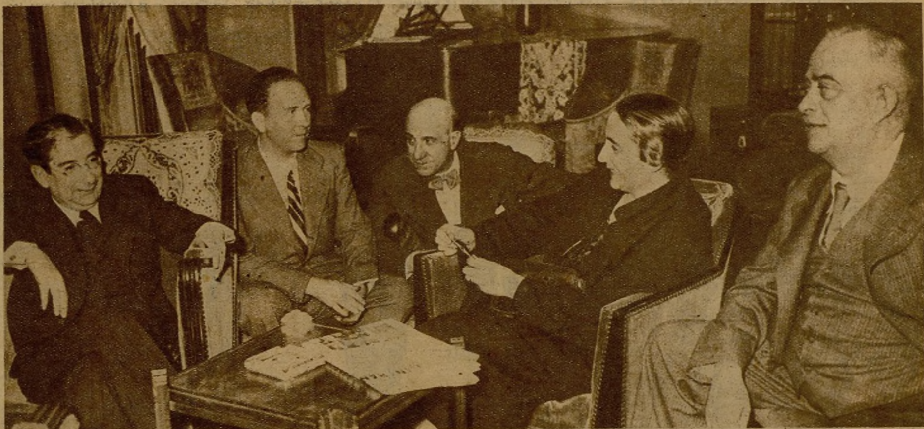
Dolores Ibarruri "Paslonaria", Marcelino Domingo y los señores Lara y Becaséns Siches, después de una conferencia celebrada en el hotel donde se hospedan, en París