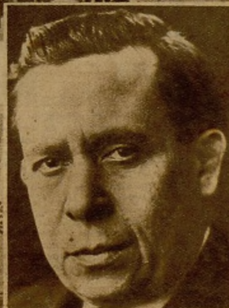
El ilustre diplomático don Ramón Negi, que ha sido nombrado embajador de México en España