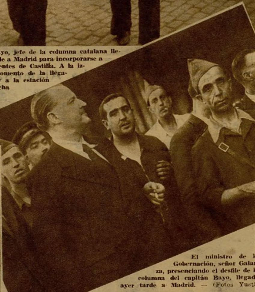
El ministro de la Gobernación, señor Galarza, presenciando el desfile de la columna del capitán Bayo, llegada ayer tarde a Madrid.

Momento de desfilas por la Puerta del Sol, entre los vítores de la multitud, la columna catalana llegada para incorporarse a uno de los frentes castellanos