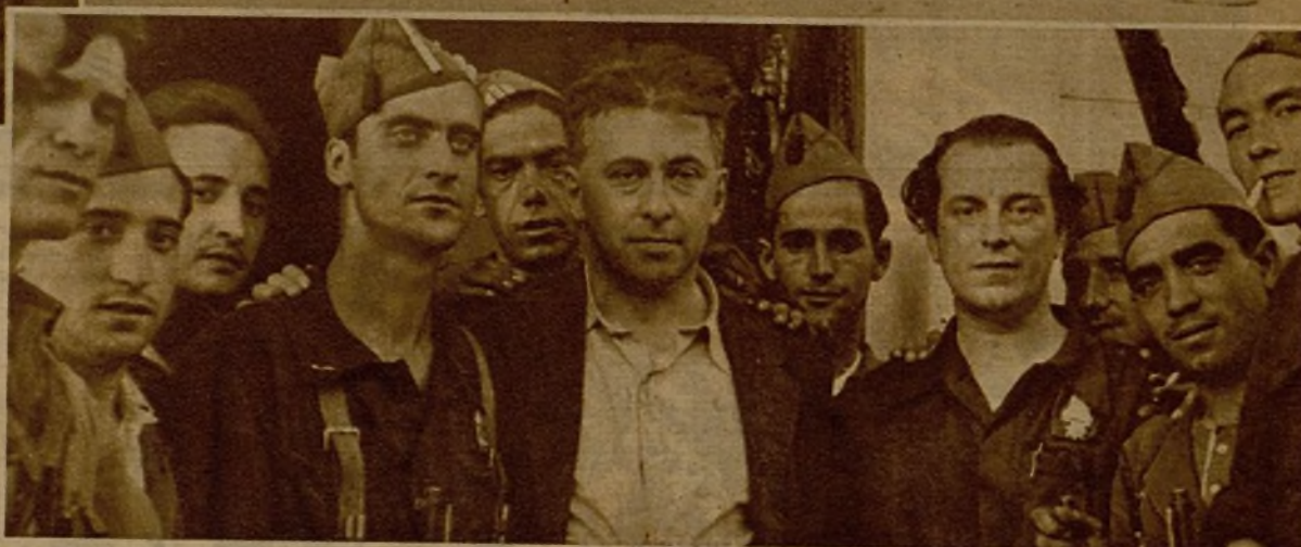
El famoso escritor ruso Elias Ereburg, con el gran poeta Rafael Alberti, con un grupo de milicianos durante la visita que ayer hicieron a los frentes de la Sierra