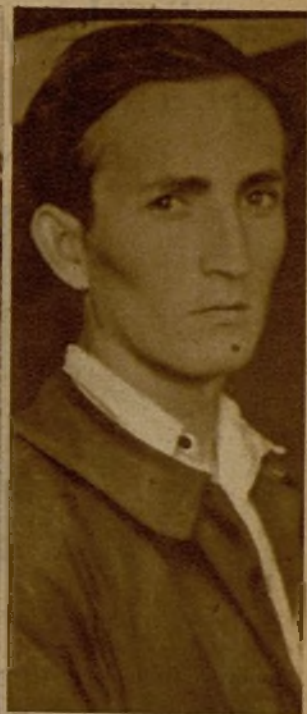
Entre los fugados del Alcázar de Toledo figura este cabo de Infantería, que se negó desde el primer momento a sumarse a los rebeldes, y a quien éstos tenían encerrado en un calabozo, sometido a los tormentos del hambre y la sed