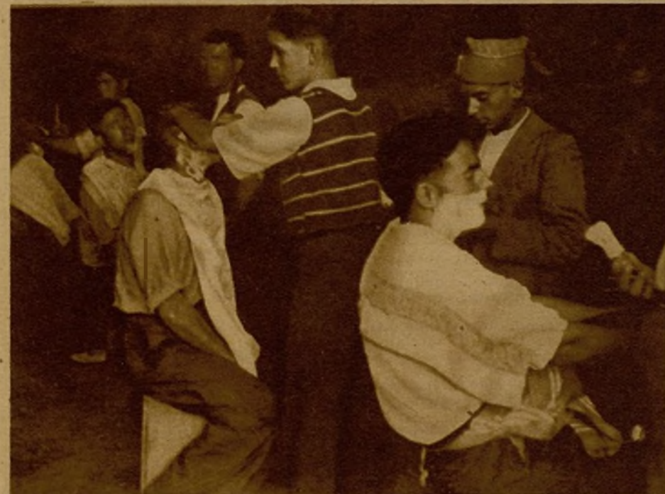
En un bagur de sidra se ha improvisado esta peluquería para los soldados que rodean Oviedo

ra salvar la corta distancia que nos separa del enemigo, tuvieron que dar un gran rodeo, a fin de aprovechar cañales y bajos del terreno que les preservasen de las balas.