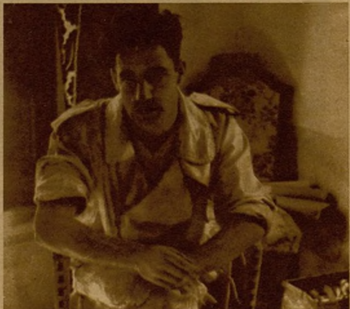
El piloto que conducía el avión faccioso derribado por nuestras tropas, que se arrojó del aparato con el paracaídas, y que fué hecho prisionero