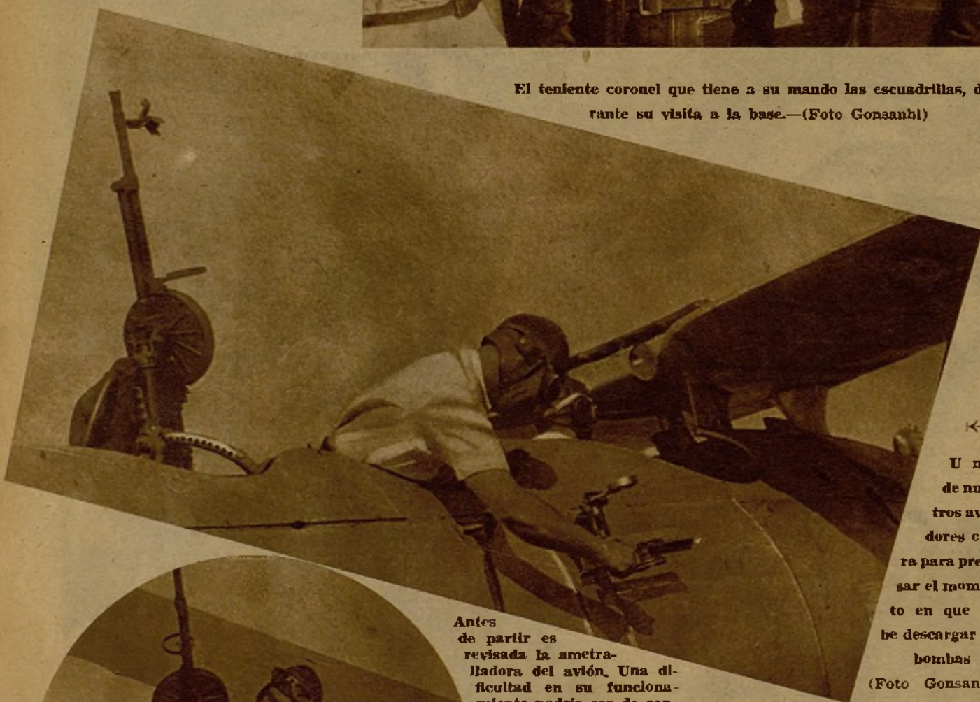
Antes de partir es revisada la ametralladora del avión. Una dificultad en su funcionamiento podría ser de consecuencias fatales ante el enemigo