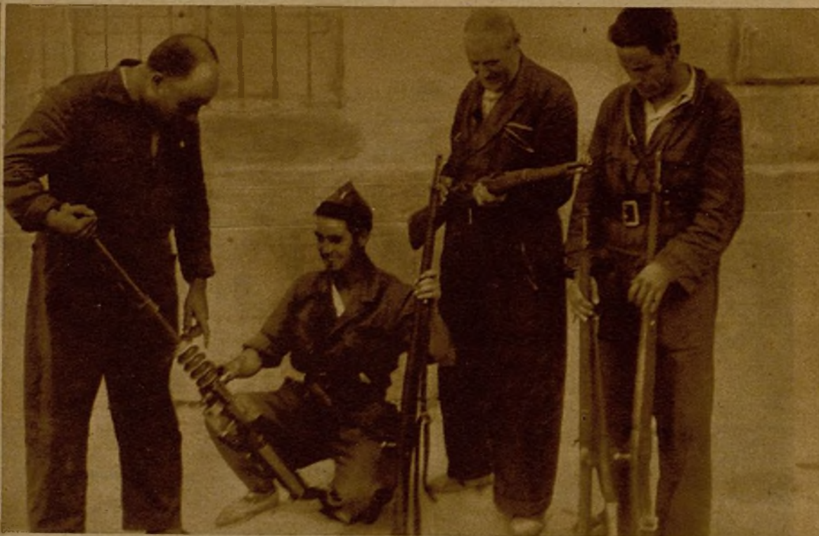
Una de las ametralladoras y varios fusiles tomados al enemigo, al poner en fuga a una partida facciosa en Pelahustán

Las operaciones del domingo.—Tranquilidad en el Centro y martilleos constantes en los flancos.—Una interesante información de los propósitos y situación de los facciosos.—La caza de un avión rebelde.—El piloto es detenido por un miliciano cocinero.—Su sorpresa al traerle a Madrid.—La conquista de Pelahustán.—Numerosas bajas y botín capturado.—Numerosos aviones republicanos realizan una operación de castigo.—Los fascistas retroceden espantados