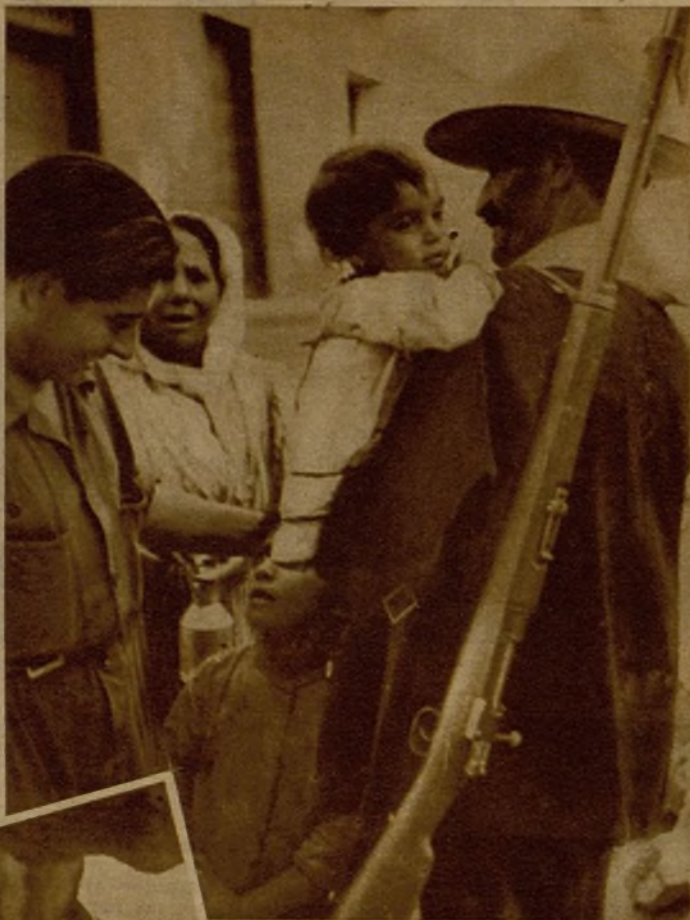
Un gitano evadido del Alcaicín e incorporado a nuestras Milicias se despidió de su mujer y sus hijos al marchar al frente

—Hace falta dinero. —Se roba. —Se trabaja. El espanto fué general. —¿En qué? —Vais a lidiar seis toros a beneficio del Comité. Más espanto. —¿Nosotros?... —Vosotros, el domingo! Salieron a la plaza con los viejos trajes de luces. Llevaban un brazalete rojo que decía: "U. H. P." Les llamaron desde la barrera.