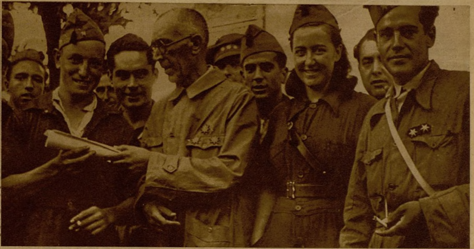
En el frente se ha efectuado el casamiento de dos milicianos, ostentando la testificación oficial el coronel Mangada. Heo aquí con los nuevos esposos