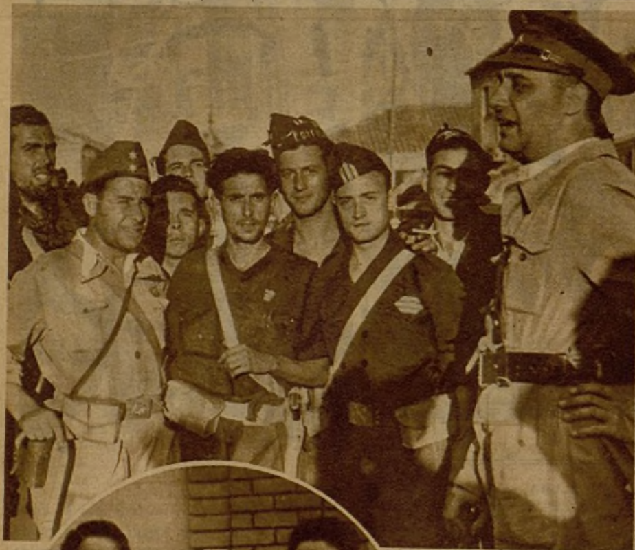
El general Asensio, ante las tropas llegadas ayer al frente de Talavera del Tajo, pronunciando una vibrante alocución, que fué acogida con gran entusiasmo por los bravos luchadores.

La temperatura comienza a descender en la Sierra, y desde la tarde, nuestros milicianos han de usar las prendas de abrigo, que en gran cantidad han sido ya enviadas. En pocos días se dotará a todos del equipo invernal, ante la proximidad de los fríos. He aquí a varios soldados de centinela, envueltos en sus mantas de lana.