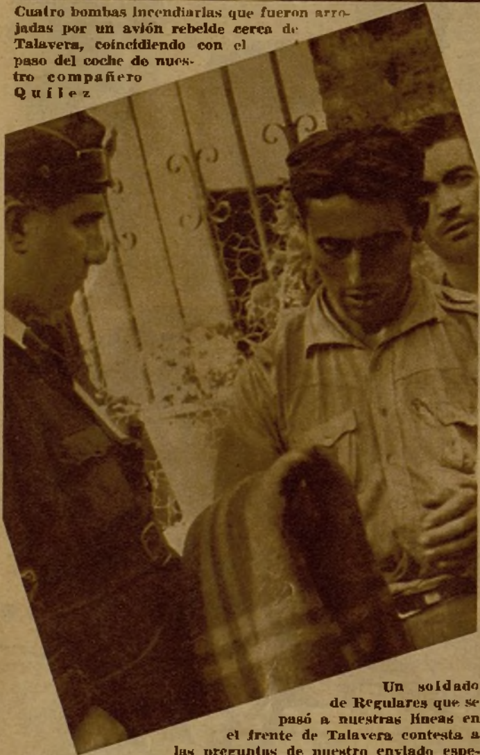
Un soldado de Regulares que se pasó a nuestras líneas en el frente de Talavera contesta a las preguntas de nuestro enviado especial, José Quílez, Vicente.