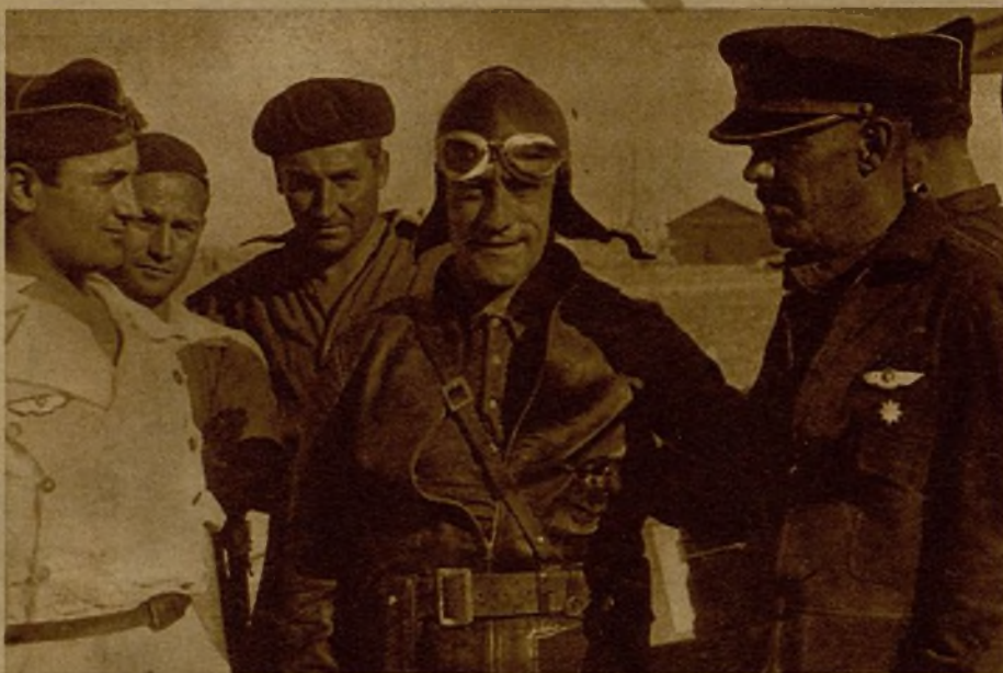
El teniente coronel que tiene a su mando las escuadrillas, durante su visita a la base.

Están siempre dispuestos a la primera llamada telefónica para salir al encuentro de los "pájaros negros", en el caso que se atrevan a cruzar la frontera de fuego. En el espacio se repite a menudo la misma escena. Unos aviones negros que intentan una acción contra los ejércitos republicanos, unos aviones