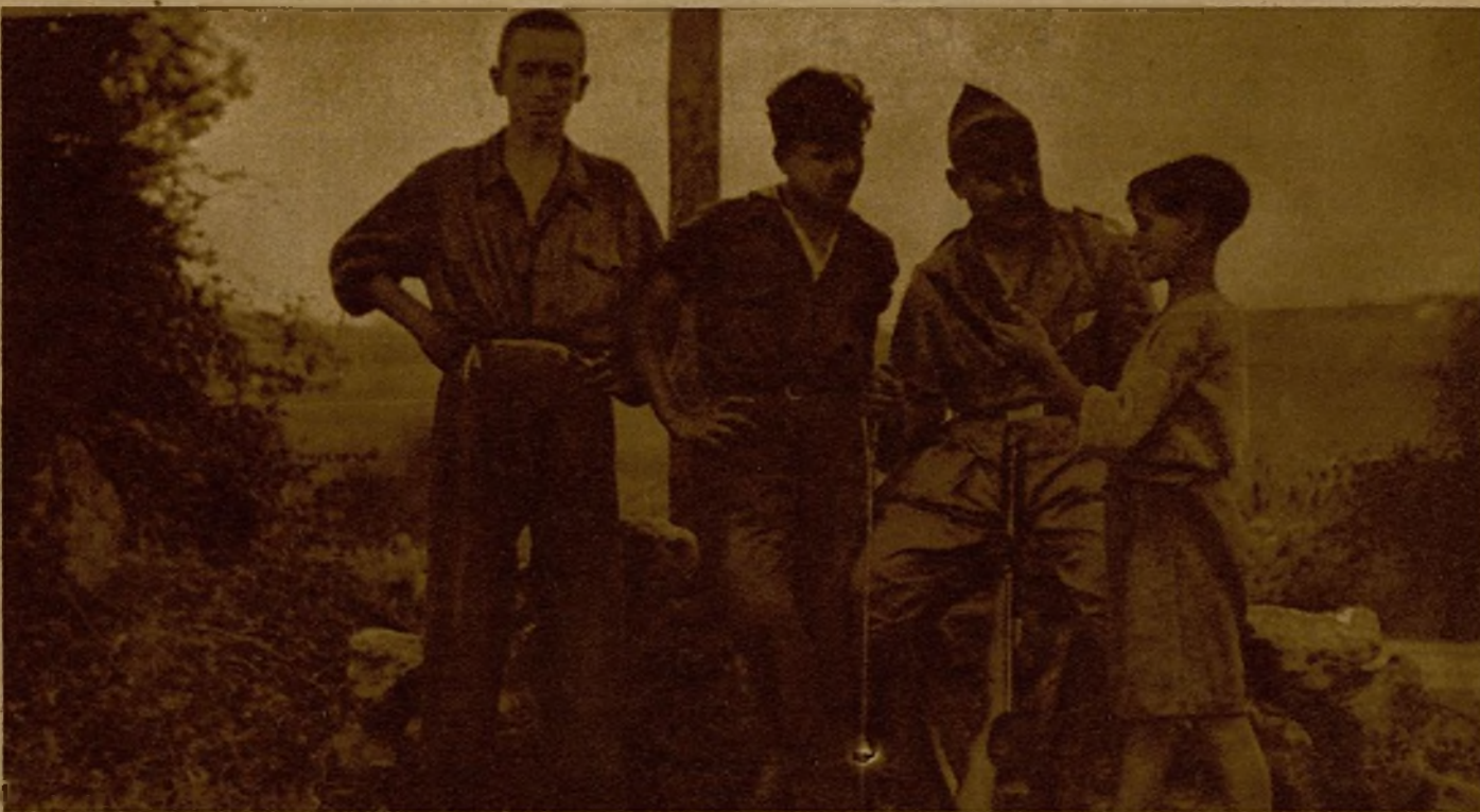
Tres niños escapados de Oviedo y refugiados en nuestras líneas cuentan el episodio de su fuga a Juanelo de Laviana

Sentados ya al abrigo de los sacos terreros, los muchachos nos cuentan su aventura. Para llegar hasta nosotros, pa-