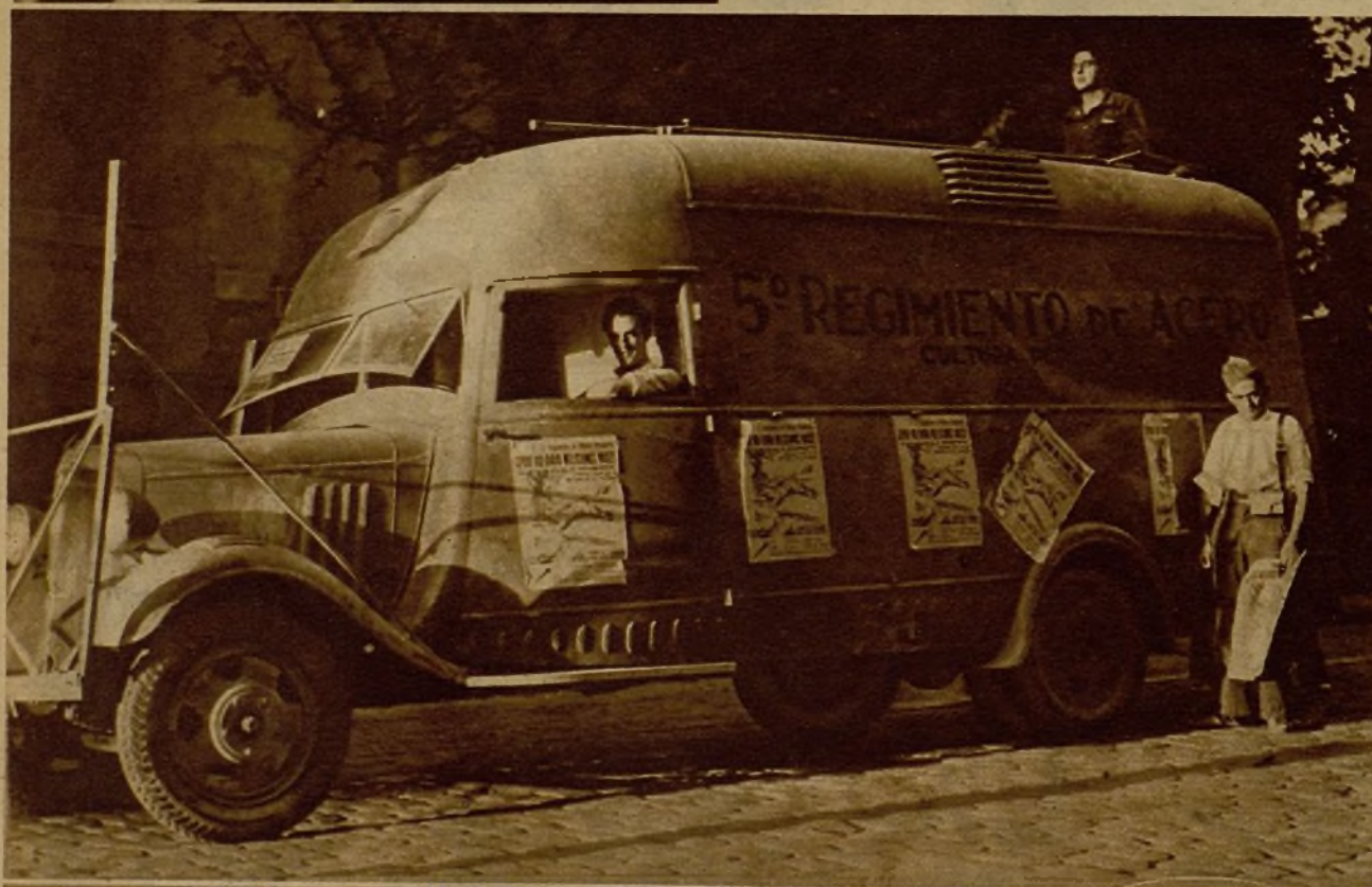
Un camión con emisora de radio, del batallón de Acero (5.º Regimiento de Milicias Populares), que informa a las tropas de las últimas noticias en los frentes