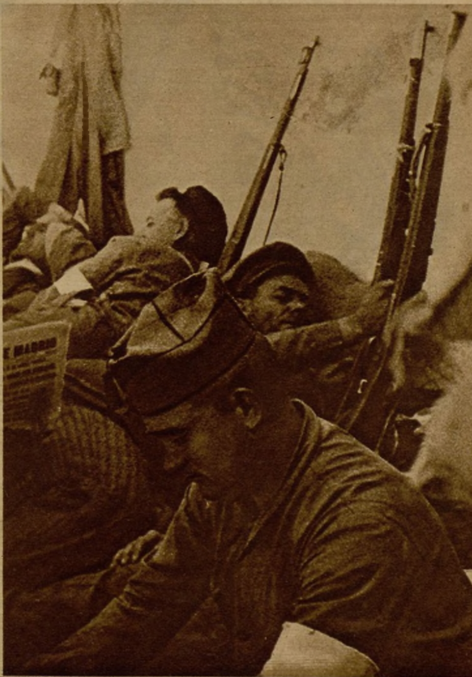
Ratos de tranquilidad. Los milicianos lo aprovechan para el bien ganado descanso

Como Barbastro son todos estos pueblos que circundan a Huesca. La nueva vida trae esta siembra, que muy pronto dará los frutos que todos apelecemos.