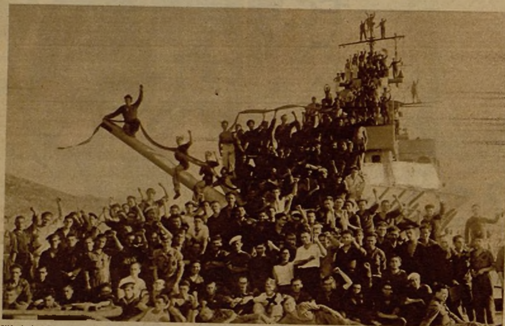
El jefe de operaciones (x) de la Escuadra republicana rodeado de la dotación del crucero "Libertad", que tan eficaces servicios presta en la lucha contra los facciosos