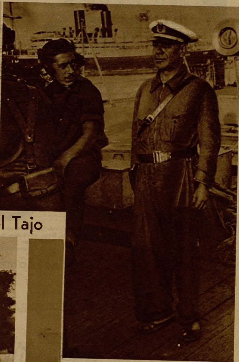
Sobre cubierta, en fraternal contacto con la marinería, uno de los jefes de nuestra Escuadra, de cuyo traje han desaparecido todos los atributos protocolarios