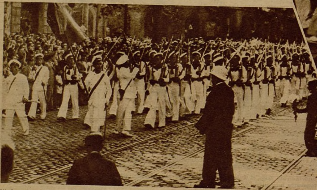
El desfile de la Infantería de Marina, con motivo de la fiesta homenaje a Casanova. El pueblo tributó a los soldados un homenaje entusiástico