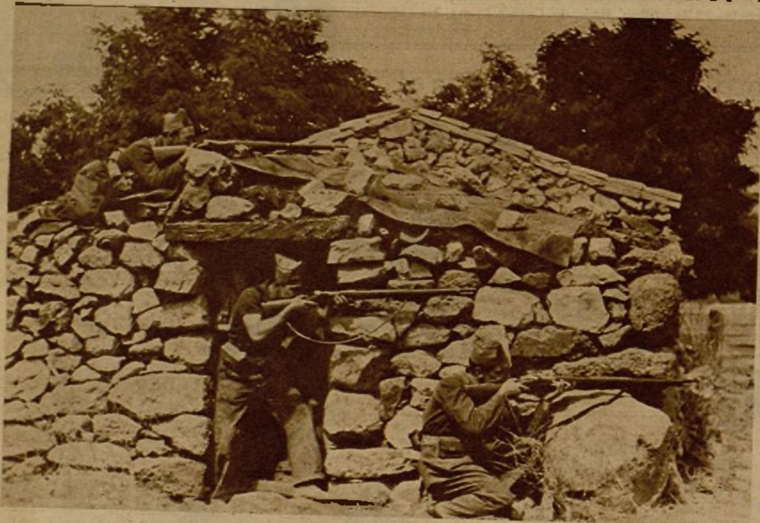
De esta rudimentaria construcción hacen parapeto nuestras avanzadillas para tirotear a los facciosos después de la toma de un pueblecito del frente de Talavera