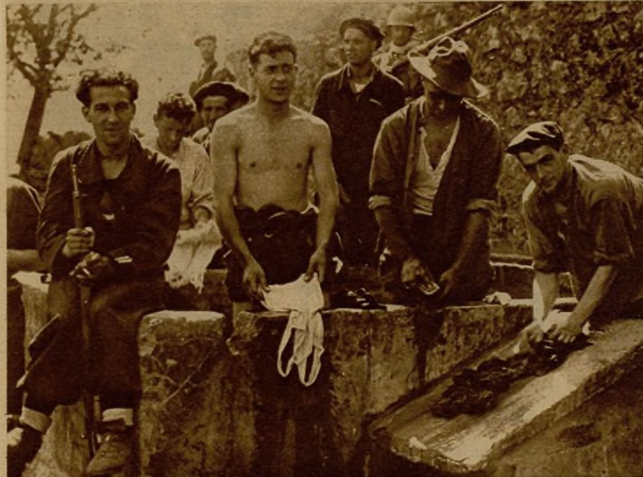
En los ratos en que el tiroteo decrece y parte de la tropa da tregua a la actividad bélica, los luchadores montan donde se puede el lavadero