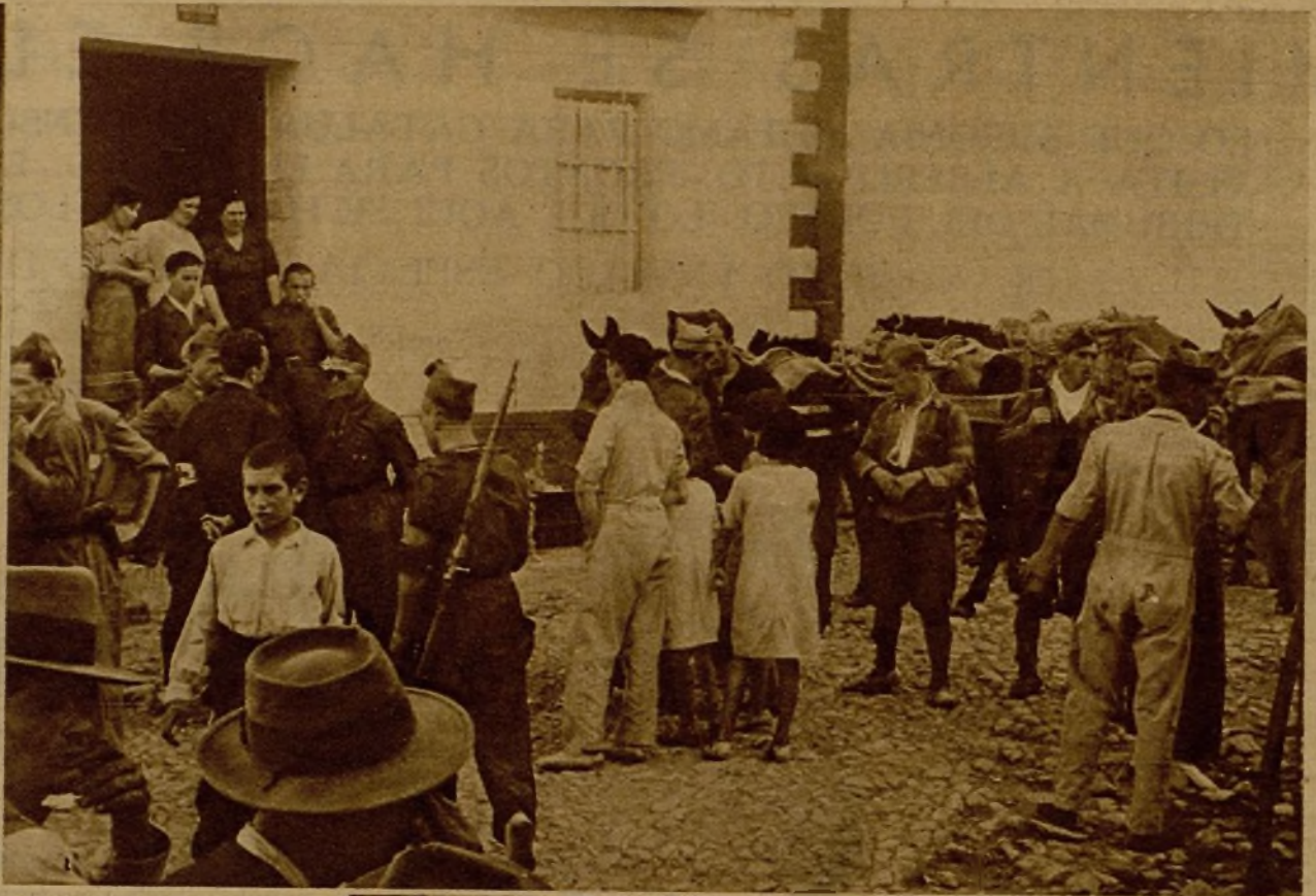
Milicianos y soldados en la plaza de uno de los pueblos recientemente tomados por nuestras tropas en uno de los sectores del frente Sur