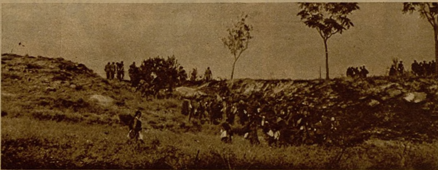
Una nutrida patrulla concentrada en uno de los puntos de avance