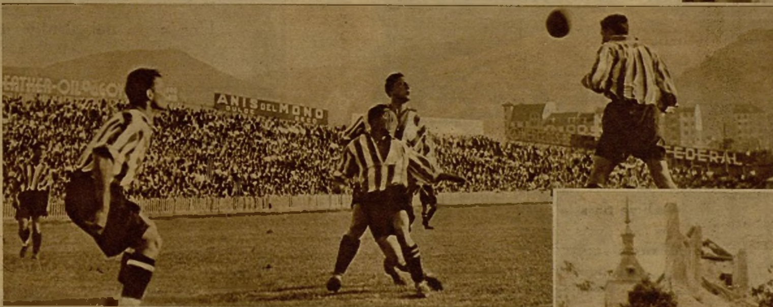
En el campo de deportes de San Mamés, en Bilbao, se ha celebrado un partido de fútbol a beneficio de las Milicias entre el Athletic y el Racing. Un momento del encuentro