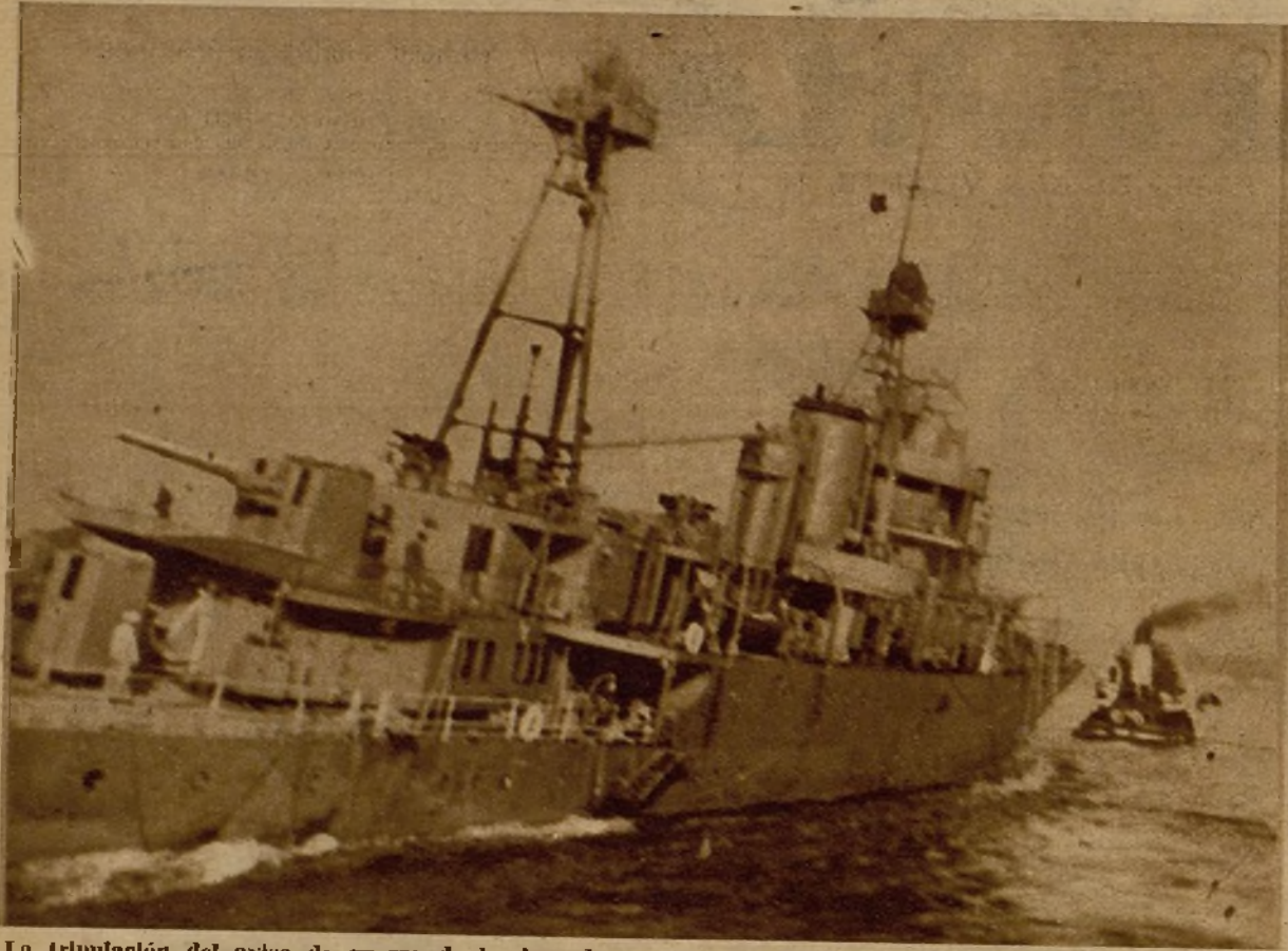
La tripulación del aviso de guerra de la Armada portuguesa "Alfonso de Albuquerque" se amotinó en aguas del río Tago, frente a Lisboa. Batido por la artillería de costa, el mencionado buque, escorado, fué a encallar voluntariamente en la orilla derecha del río

Las fortalezas terrestres que defienden la entrada del puerto de la capital de la República rompieron el fuego contra el buque sublevado, produciéndole los daños que se aprecian en la presente fotografía y otros en la línea de flotación