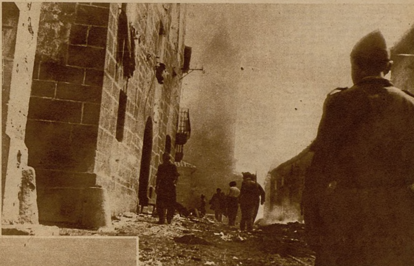
Tras ruda pelea, Siétamo fué reconquistado. He aquí la vanguardia de nuestras columnas penetrando en las calles del pueblo

El panorama que se nos ofrecía al entrar en automóvil en Siétamo era verdaderamente dantesco; una población sin electricidad debido a la destrucción de las centrales. Los faros de nuestro coche diluían la tenue luz de unas bujías que eran base de iluminación en las pocas viviendas habitables. Para circular por las calles era preciso salvar obstáculos consistentes en maderos carbonizados, ganado muerto de hambre y de metralla. De bruces, un sargento de la Guardia