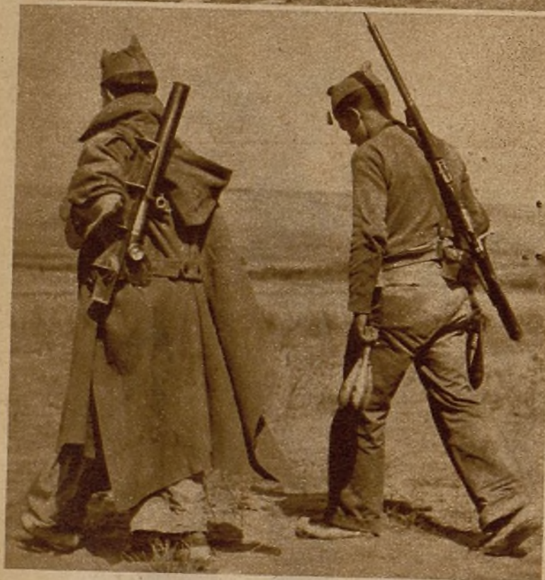
Milicianos camino de la línea de fuego, para batir a los facciosos