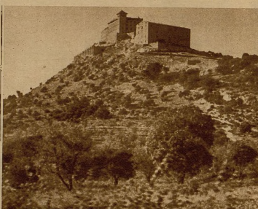
Una vista del castillo de Barbastro, que se halla en poder de las tropas leales

En Barbastro me informé de la ruta de Durruti. Exactamente di con él donde me señalaron.