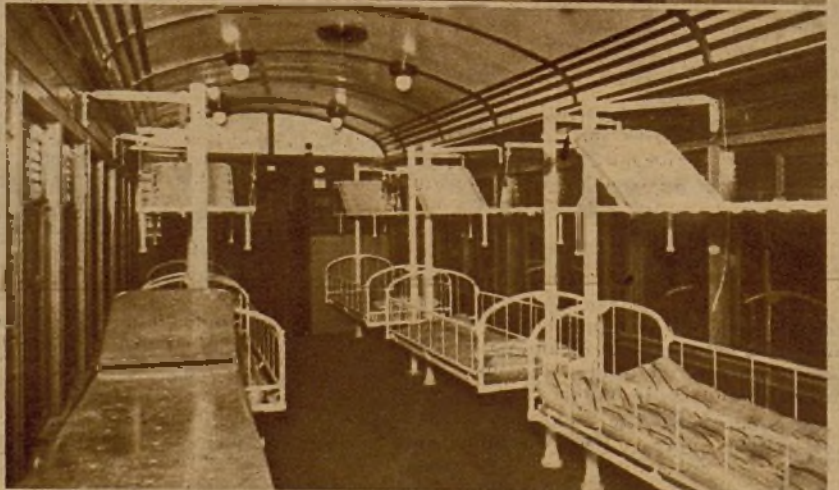
Departamento de camas y literas en el tren de Sanidad. Va provisto también de cama de operaciones