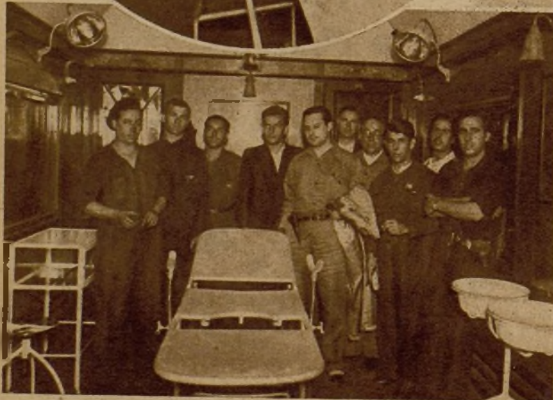
En el círculo, el quirófano del nuevo tren sanitario catalán, que presta sus servicios en el frente de Aragón. En la foto inferior, el personal sanitario de esa magnífica unidad de evacuación de enfermos y de heridos