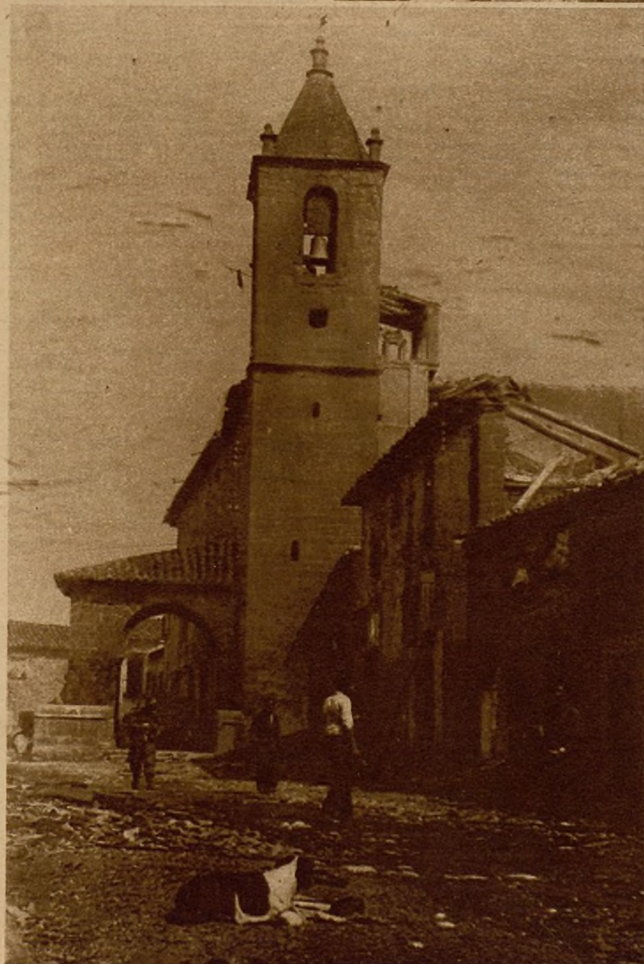
Uno de los sitios donde los facciosos intentaron resistir fué esta torre de la iglesia, donde dejaron abandonados muertos y armamento en abundancia