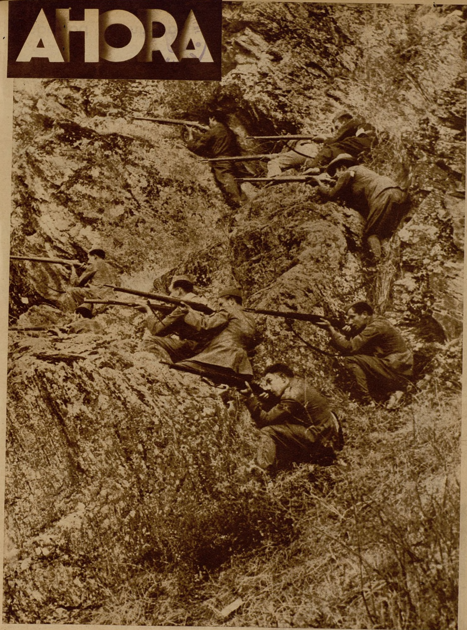
LA HEROICA LUCHA DE NUESTROS MILICIANOS EN TODOS LOS FRENTES.—Los valientes defensores de la República han realizado en los dos meses de guerra el milagro de adaptarse a las diversas condiciones de lucha en los distintos frentes. He aquí a un grupo de los que operan en el sector Sur, pegándose magistralmente al terreno durante uno de los últimos avances de las tropas leales