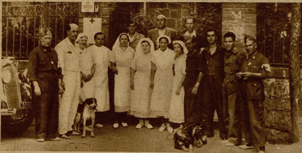
El director, médicos y enfermeras de un hospital, que vienen realizando una admirable labor en su abnegado cometido desde el principio de la campaña