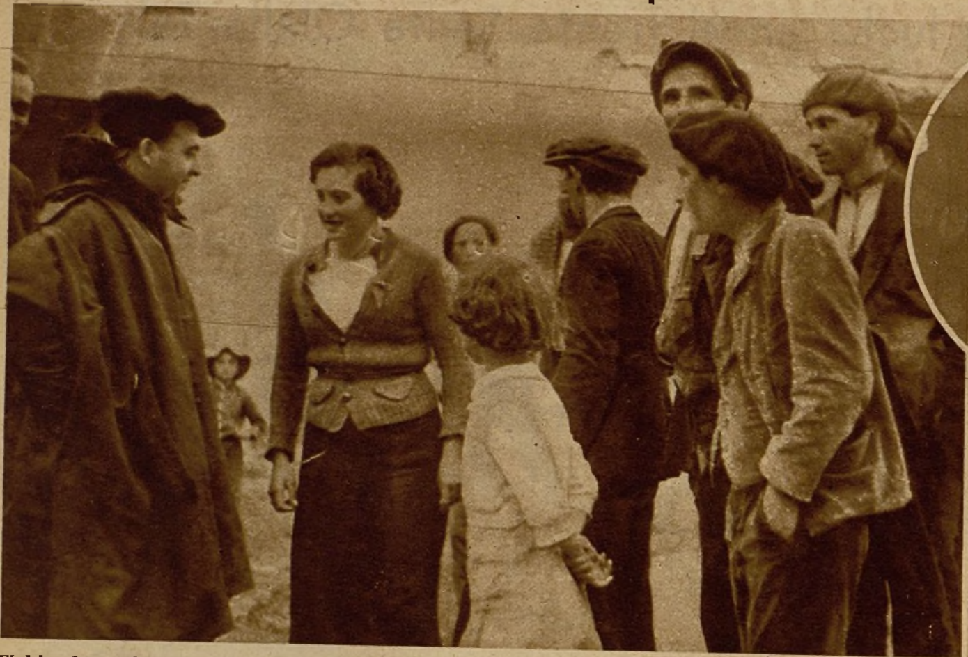
El delegado-consejero de Defensa y Guerra de Valencia interrogando, en un pueblo del sector de Aragón, a varios vecinos que regresaron al mismo una vez posesionadas del lugar nuestras tropas