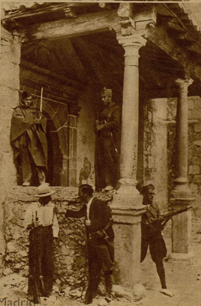
Nuestras tropas, después de tomar un poblado salen en patrullas