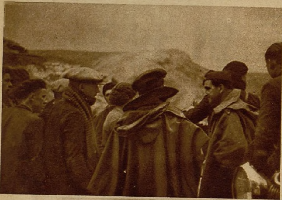
En el sector aragonés el avance de la estación deja ya sentir sus efectos, y nuestros soldados están completamente provistos de ropas de abrigo para contrarrestar la crudeza del tiempo. Esta prematura aparición de los primeros fríos no ha demorado, por otra parte, nuestra acción, y el avance de las columnas se efectúa con el mismo ritmo e intensidad. En la fotografía, varios jefes de Milicias interrogando a los vecinos de un pueblo reconquistado, en las afueras del mismo