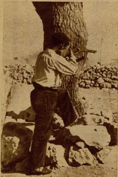
Uno de los numerosos campesinos que en los pueblos reconquistados se unen a nuestras fuerzas para luchar contra los facciosos, en su puesto de vigilancia