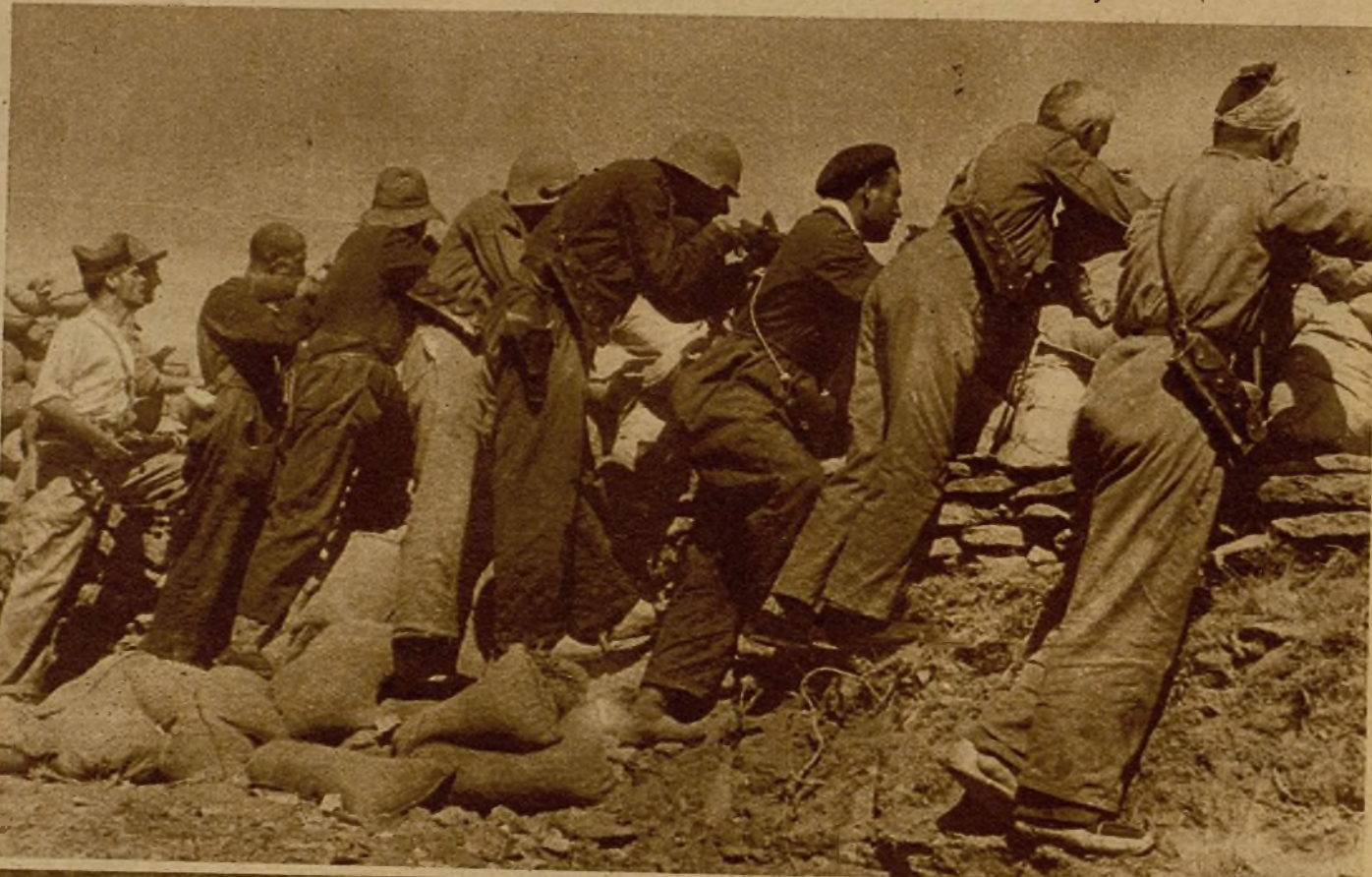
Desde el sólido parapeto, convenientemente situado, soldados y milicianos hacen intenso fuego sobre el enemigo

En Siétamo ha habido que abastecer de todos los elementos. La desgraciada población civil, que se ha reintegrado otra vez a la vida ordinaria, ha visto arder sus humildes hogares y desaparecer lo poco que tenían.