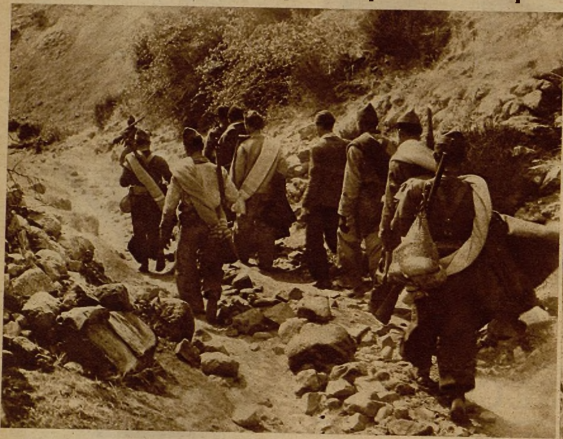
Una avanzadilla se adentra cautelosamente por el abrupto terreno para sorprender a una concentración facciosa que hostilizaba a nuestras tropas