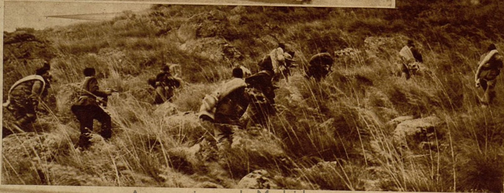
Milicianos en un avance → (Fotos Pando)