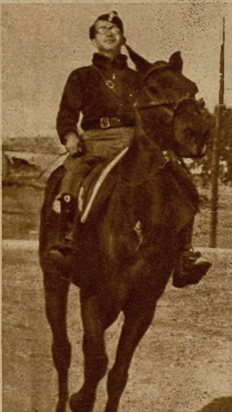
El comandante caracterizado socialista de Jaén, jefe de una de las columnas de milicianos

Los de la compañía limpian la ametralladora.