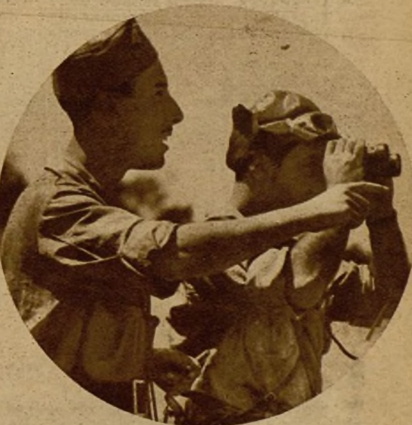
Ayer los facciosos intentaron un ataque a fondo en uno de los puntos de la Sierra y fueron rápida y contundentemente rechazados. Dos oficiales observando la acción de nuestros aviones durante la operación

AGENTES PRECISAMOS PA- ra venta a plazos de relojes con muestrario. Frada. Apartado 215. San Sebastián.