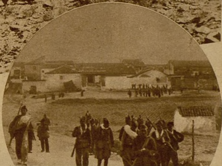
Una patrulla de carabineros sale a primera hora en servicio de descubierta para fijar la posición de las avanzadas contrarias