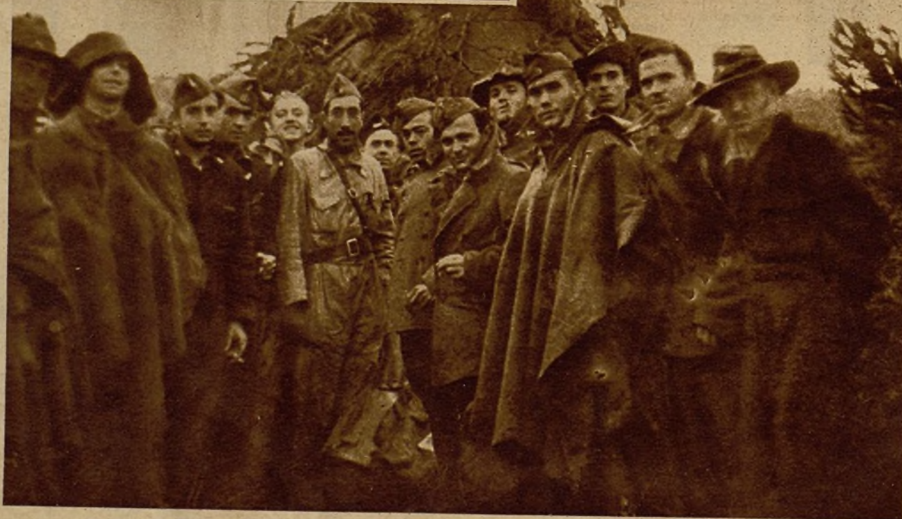
En el frente de Teruel la ofensiva de nuestras tropas ha tenido gran efectividad, lográndose un importante avance, que sitúa a las columnas en excelentes posiciones y estrecha aún más el cerco a que están sometidos los rebeldes. A pesar de la defensa que de estos lugares hacen los facciosos, convencidos del importante emplazamiento de los mismos, el empuje de nuestros soldados ha vencido su resistencia y ha dado lugar a la reconquista de este pueblo, entre otros, en los que los rebeldes dejaron abandonado importante material de guerra, así como numerosas bajas, sobre el campo