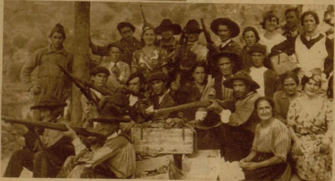
Grupo de campesinos con varias valientes milicianas, que combatieron con gran empuje a los grupos rebeldes