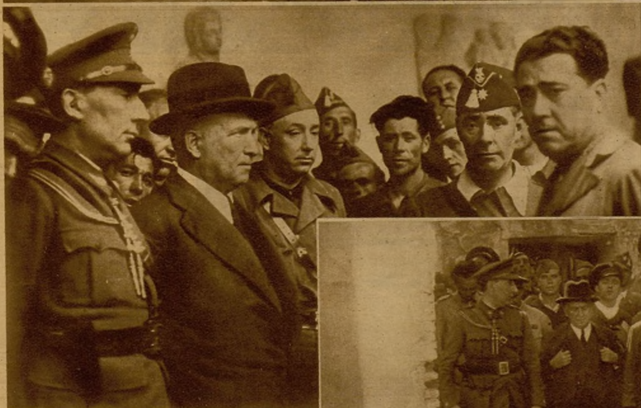
El ministro de la Guerra, señor Largo Caballero, en el frente de Santa Olalla, cambia impresiones con los jefes de las columnas que luchan en aquel sector sobre la marcha de las operaciones