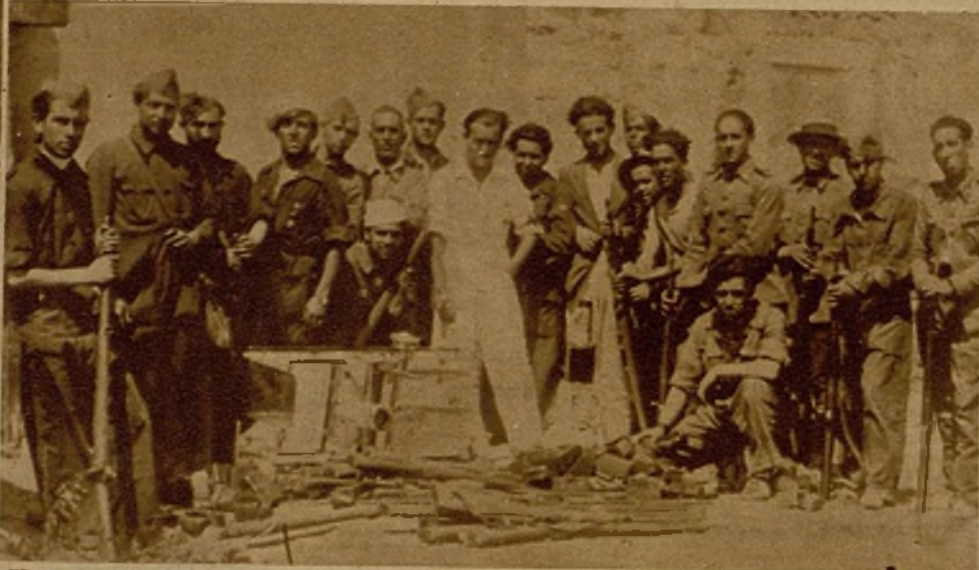
Un grupo de soldados y milicianos que tomaron parte en la acción de ayer en Somosierra con el material que cogieron al enemigo

La acción librada en el frente de Somosierra ha tenido extraordinaria importancia, y en ella ha sufrido el enemigo tan duro quebranto, que en la jornada posterior no ha dado la menor señal de actividad. Nuestras fuerzas han empleado la tregua para realizar una conveniente consolidación de las nuevas posiciones. La columna enemiga, compuesta de unos cuatro mil hombres, ha quedado aniquilada en gran parte y en dispersión sus elementos, que perdieron toda disciplina y emprendieron la huida en confuso tropel. He aquí un grupo de milicianos tirando desde un parapeto contra los grupos facciosos