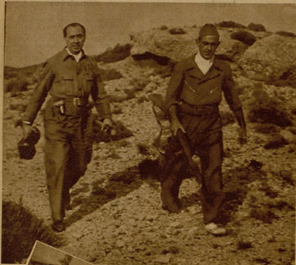
Esta guerra es de todos, y lo mismo militares que civiles se exponen sin vacilación a sus riesgos. El compañero fotógrafo, con un miliciano que le guía, marcha a una de las primeras líneas de combate para obtener información