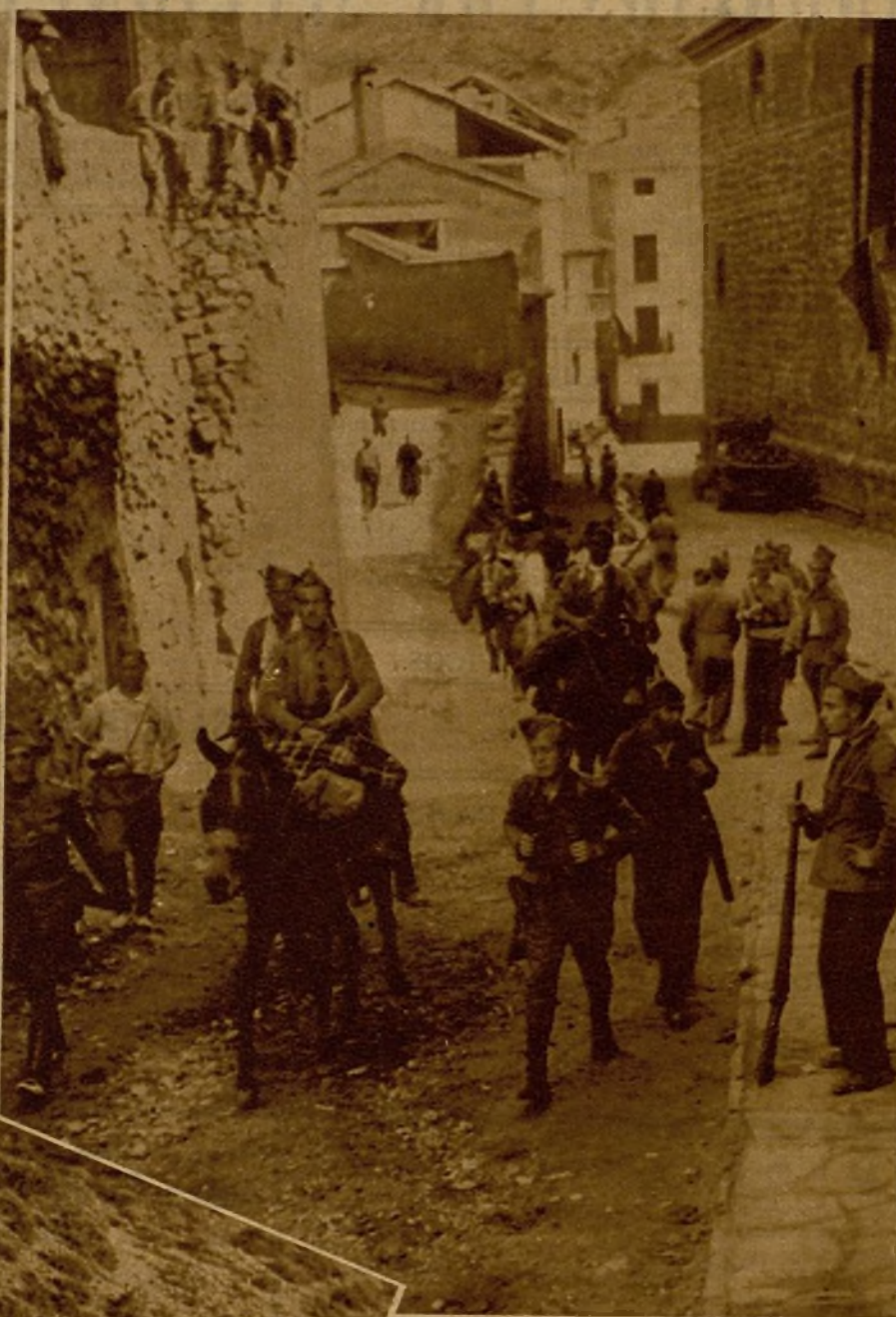
Una avanzadilla de tropas leales sale de un pueblo recién reconquistado, en el sector de Teruel, hacia la línea de combate.