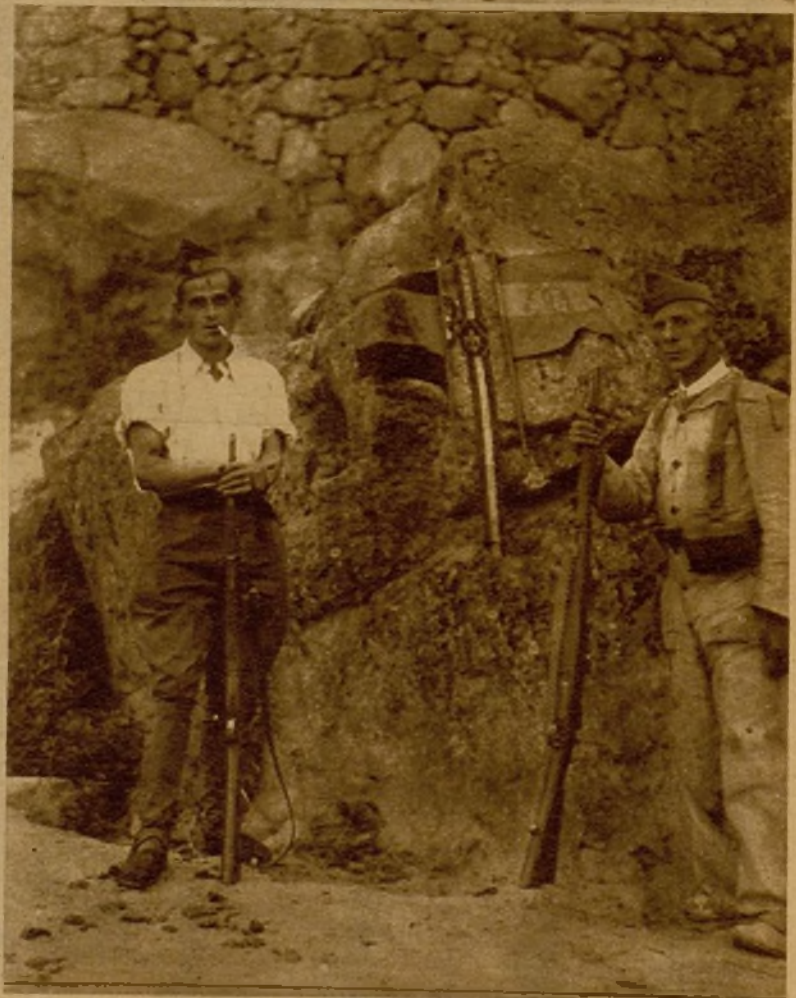
Banderas monárquicas y emblemas fascistas que fueron cogidos a los facciosos