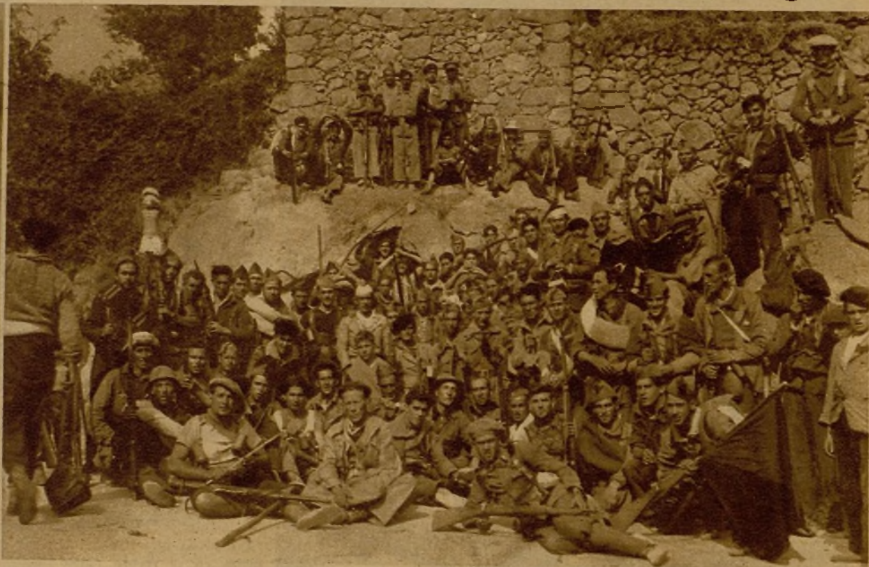
Milicianos y soldados que se batieron brillantemente en la vanguardia en una acción en la que nuestras fuerzas hicieron retroceder desordenadamente al enemigo, que sufrió importantes bajas