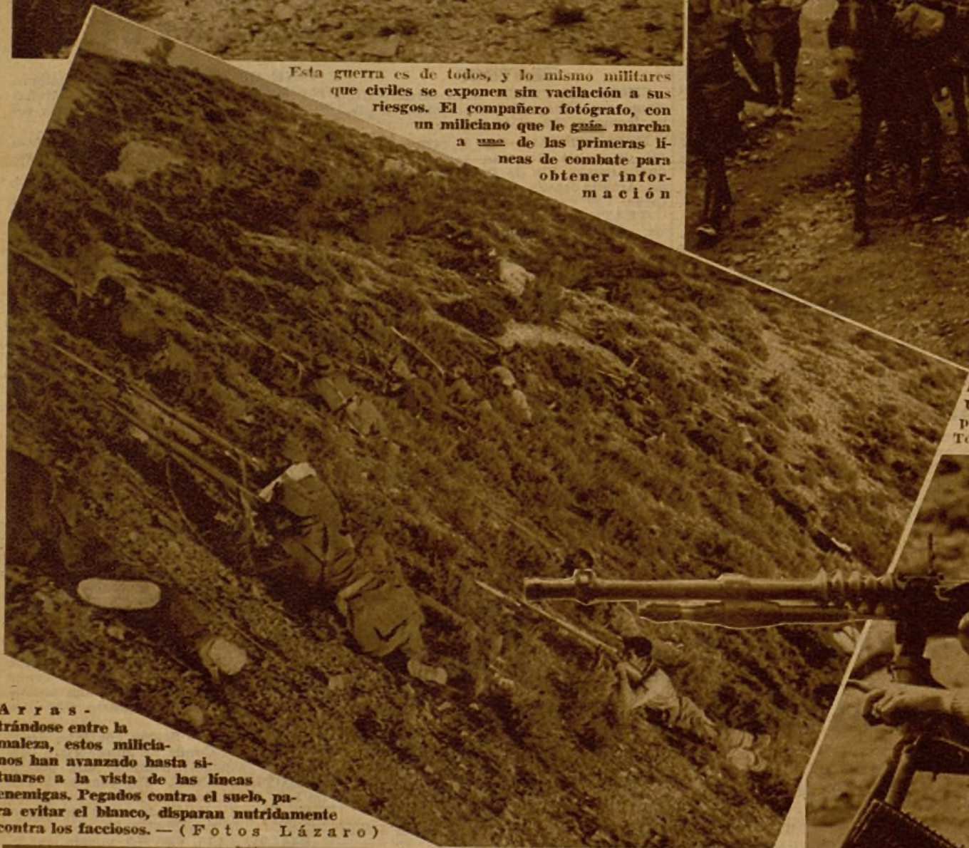
Arrastrándose entre la maleza, estos milicianos han avanzado hasta situarse a la vista de las líneas enemigas. Pegados contra el suelo, para evitar el blanco, disparan nutridamente contra los facciosos.