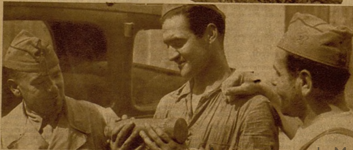
Milicianos examinando un proyectil de cañón que, como otros muchos, cayó en nuestras líneas sin estallar