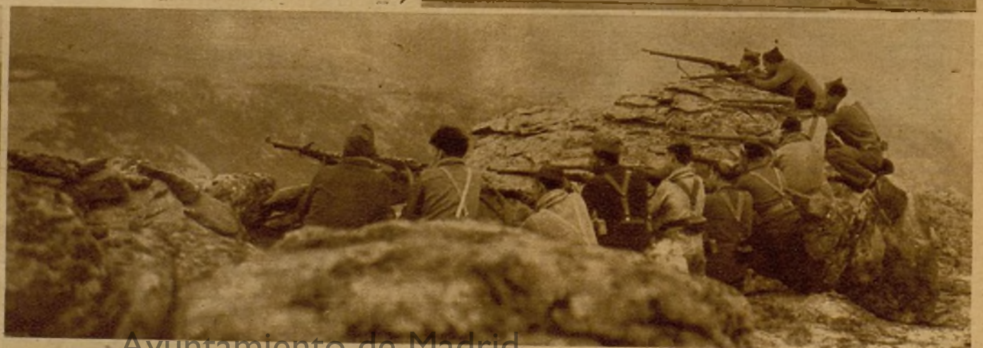
Milicianos apostados en un punto estratégico para cortar el paso al enemigo, que en su huida intentaba correrse hacia aquel sector