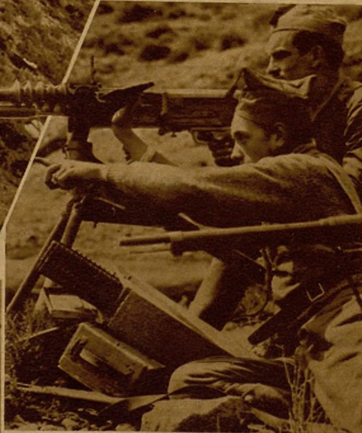
Una ametralladora emplazada en la primera línea del sector de Teruel se dispone a cortar un movimiento de avance