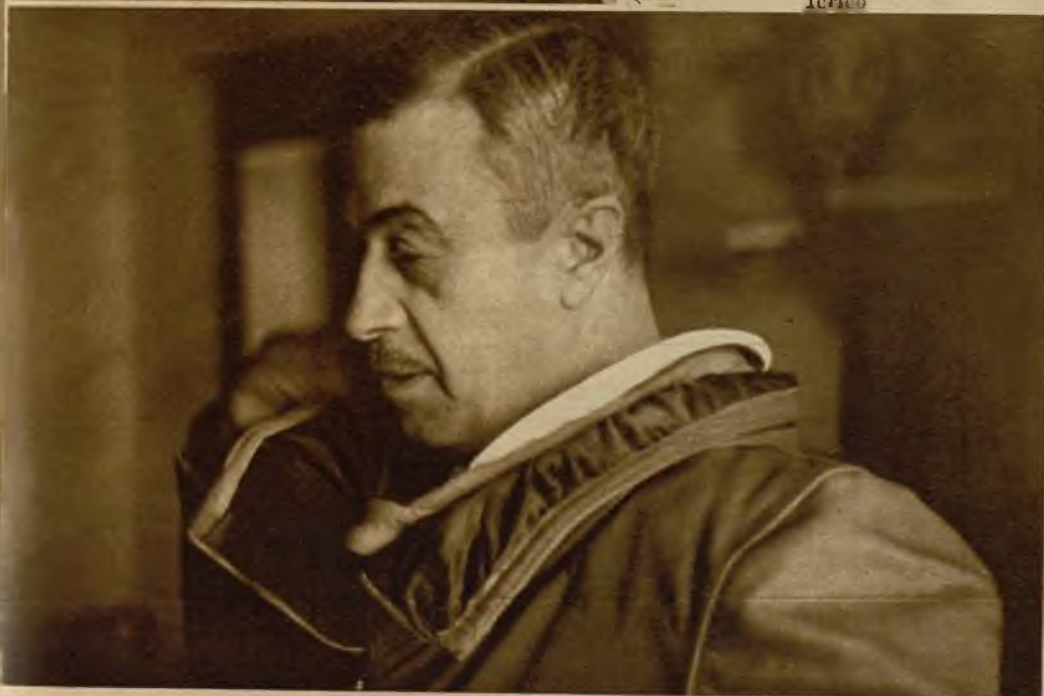
El ilustre aviador teniente coronel don Emilio Herrera, con el traje y escafandra que ha probado, con completo éxito, ante el Comité de Ascensión, en el aeródromo de Cuatro Vientos, y que utilizará en su vuelo estratosférico