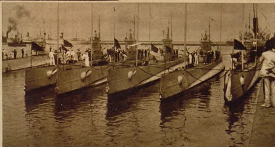
En aguas de Canarias han realizado maniobras numerosas unidades de la Marina de guerra británica. He aquí la escuadrilla de submarinos atracada en el puerto de Las Palmas, después de los ejercicios