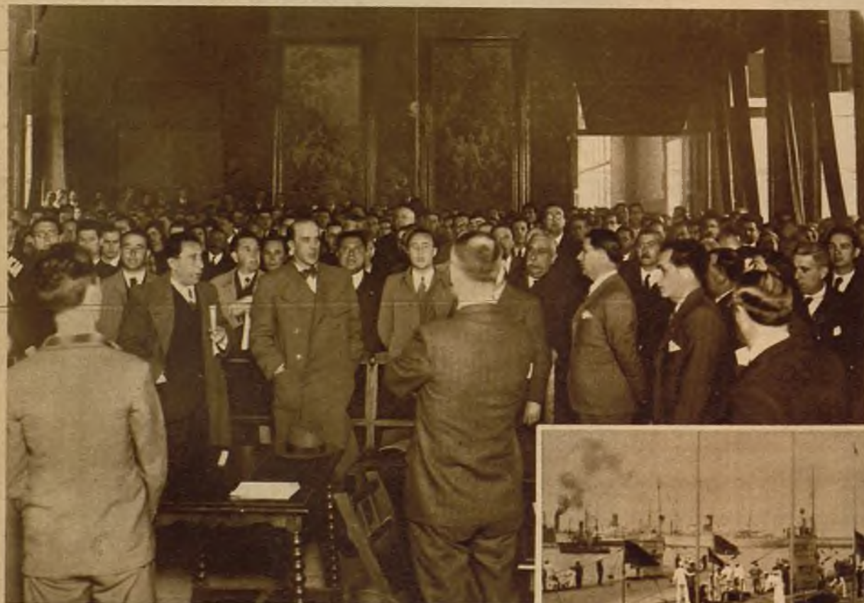
Los concurrentes a la Asamblea celebrada en Santiago para la determinación de la fecha en que ha de efectuarse el plebiscito que apruebe el Estatuto gallego cantan el himno regional al terminar la reunión