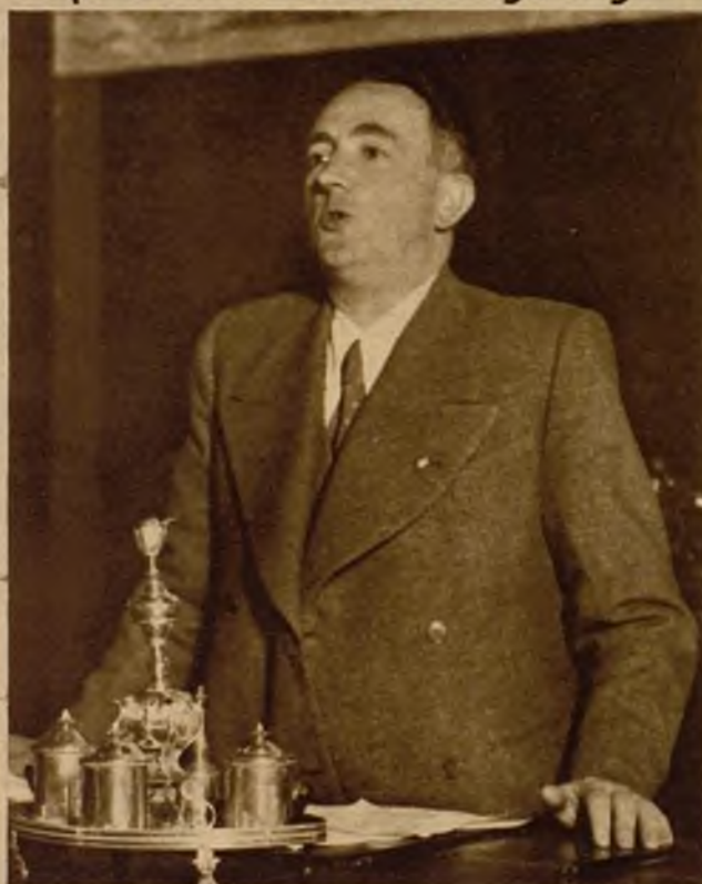
El alcalde de Santiago de Compostela, reputado escritor y periodista, don Angel Casal, en un momento del elocuente discurso que pronunció en la Asamblea convocada para determinar la fecha en que ha de celebrarse el plebiscito para el Estatuto gallego