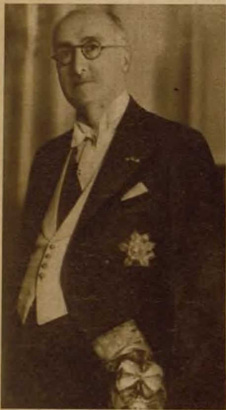
Don José A. Barnet y Vinajeras, presidente provisional de la República de Cuba, que termina hoy su mandato constitucional. El señor Barnet desempeñaba antes de hacerse cargo de la presidencia interina la Secretaría de Estado

ANIVERSARIO XXXIV DE LA REPUBLICA DE CUBA, Y TOMA DE POSESION DE LA PRESIDENCIA DE AQUELLA POR EL EXCELENTISIMO SEÑOR DON MIGUEL MARIANO GOMEZ Y ARIAS