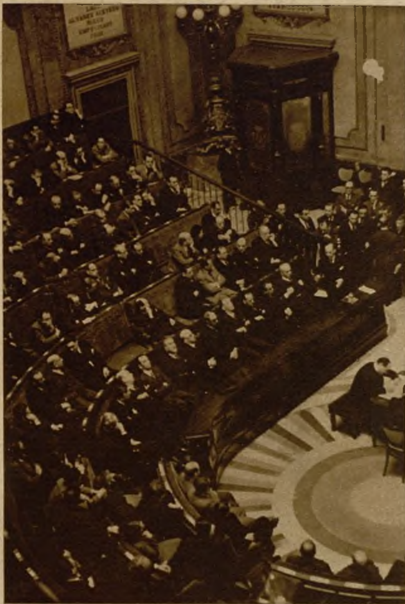
El presidente del Consejo, señor Casares Quiroga, en un momento del discurso en que formuló la declaración ministerial, con motivo de la presentación del Gobierno a las Cortes.