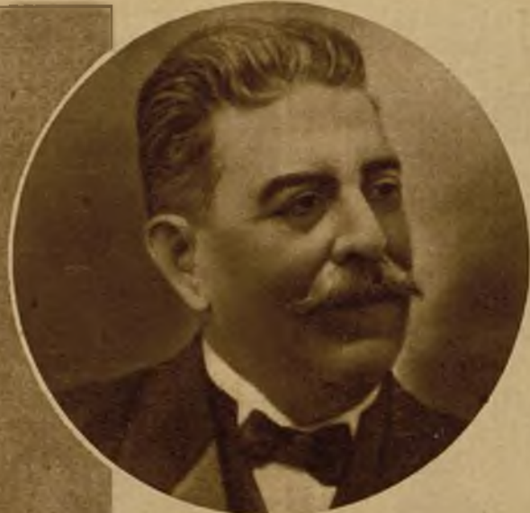
General don José Miguel Gómez, presidente que fué de Cuba en el período de 1900 a 1913, padre del actual jefe del Estado de aquella República, doctor don Manuel Mariano Gómez Arias

Excelentísimo señor don Manuel Mariano Gómez y Arias, presidente constitucional de la República de Cuba, que tomará hoy, 20 de mayo, posesión de su elevado cargo