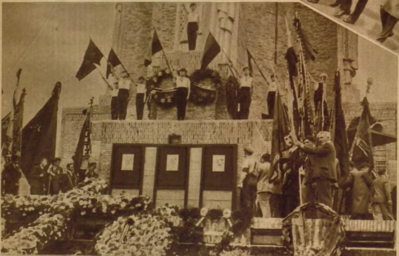
El homenaje a los muertos de la guerra

Los peregrinos valones, con sus banderas y estandartes, rodean el monumento de Waterloo