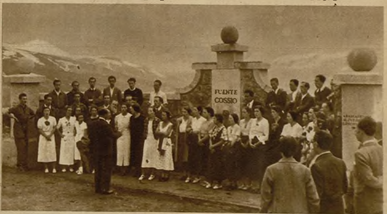
Un momento del acto conmemorativo del cuarto aniversario del Teatro y Coro de Misiones Pedagógicas, celebrado ante la Fuente Cossío, en la Morcuera