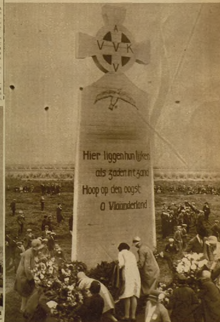
El antiguo monumento a los muertos del Yser