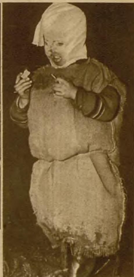
La tradición ha conservado, sin alteraciones, las legendarias fiestas de la "santa" Valpurgis, mito nórdico de original significación, con el que se simboliza la entrada de la primavera en Floda de Dalecarhia (Suecia). Véase el extraño disfraz que adoptan estos campesinos. A la derecha, otro aldeano "disfrazado de saltamontes"