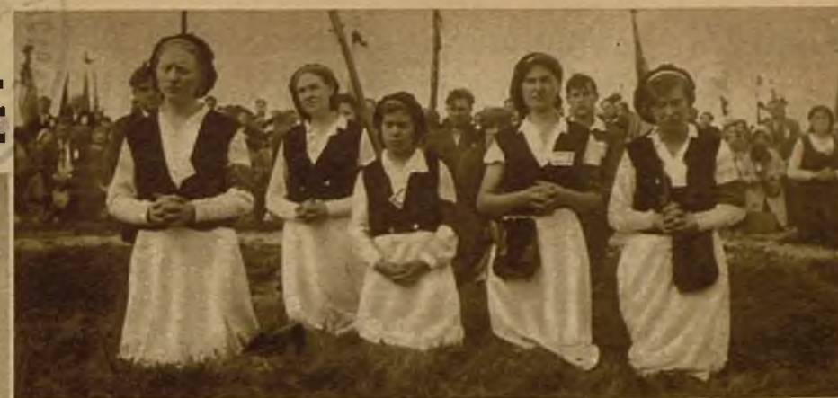
Jóvenes de Flandes, durante la ceremonia religiosa

En 1935, la ceremonia del homenaje tuvo una belleza impresionante. A la hora en que las trompetas tebanas anunciaban desde lo alto de la torre el comienzo de la