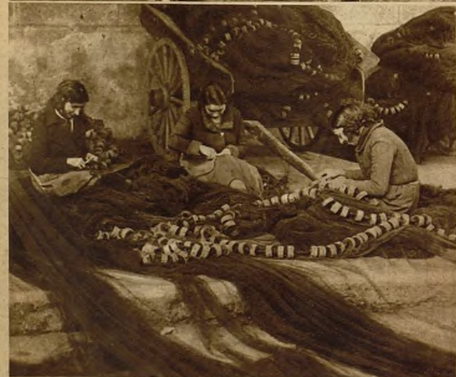
Los esposos de los pescadores aprovechan el tiempo repasando las redes en espera de días mejores