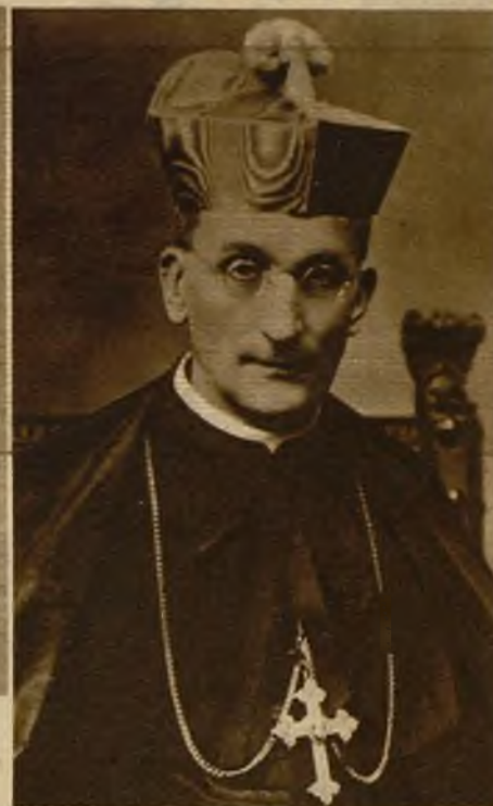
Su Eminencia el cardenal Lepicier, que ha fallecido en Roma