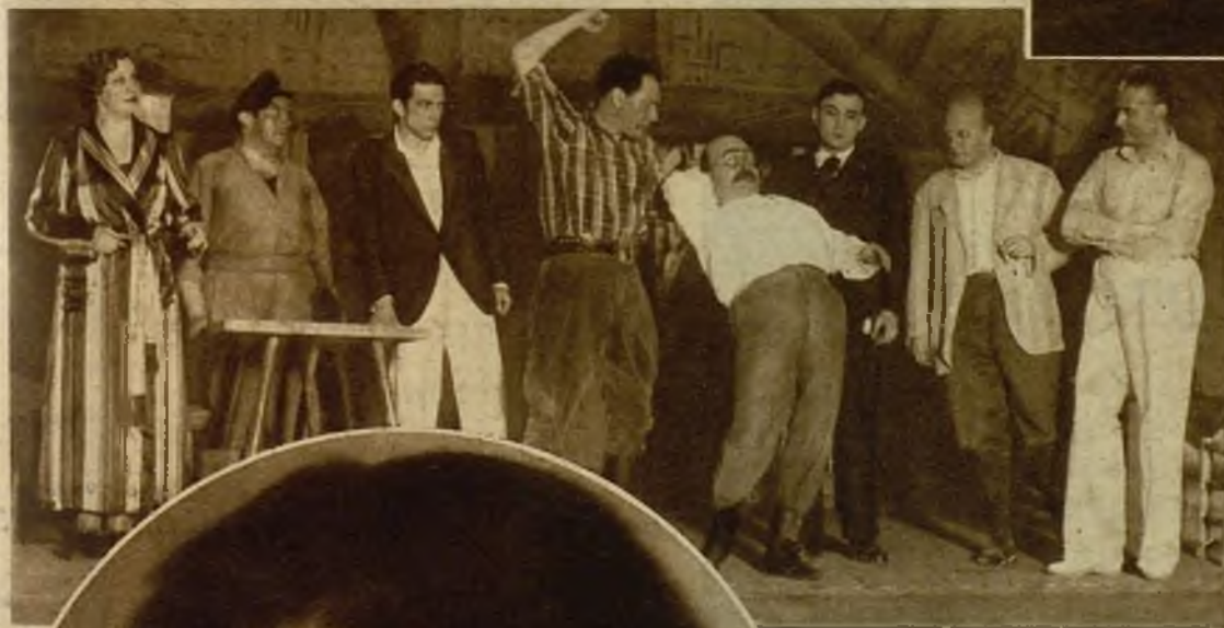
Una escena de "La otra Eva", original de don Manuel Iribarren, estrenada con éxito en el teatro Español