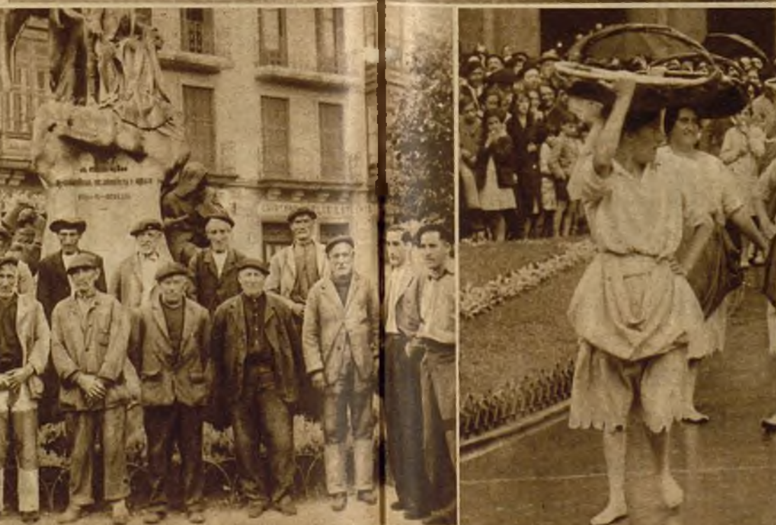
Vendedoras de pescado, que ganan su jornal con el producto del trabajo de sus maridos... cuando hay pesca. Cuando no, venden en la foto superior, desesperanzadas, después de la destrucción de varios días