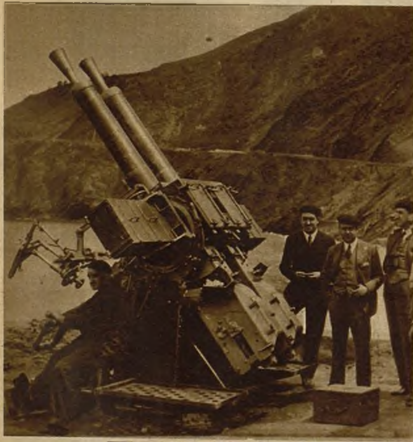
En Deva (Guipúzcoa) se han verificado las pruebas de un cañón automático antiaéreo de 40 milímetros, que ha sido construido en la fábrica de Placencia. El experimento se realizó con éxito completo, obteniendo los técnicos que han dirigido la construcción calurosas felicitaciones. En la fotografía, el cañón antiaéreo en el lugar de las pruebas