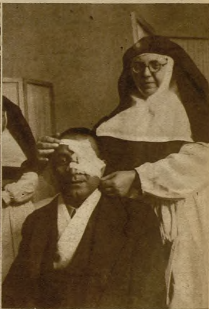
Uno de los viajeros heridos en el accidente, después de recibir asistencia

A tres kilómetros de Calatayud, y a la entrada de un túnel, un tren tranvía procedente de Zaragoza fue a chocar contra enormes bloques de piedra que se habían desprendido poco antes a consecuencia del reblandecimiento del terreno por efecto de las temporales. Resultó muerto el maquinista, Santiago Moreno, y heridos graves un operario y varios viajeros. Estado en que quedó la locomotora. A la derecha, vista de la máquina desde el interior del túnel