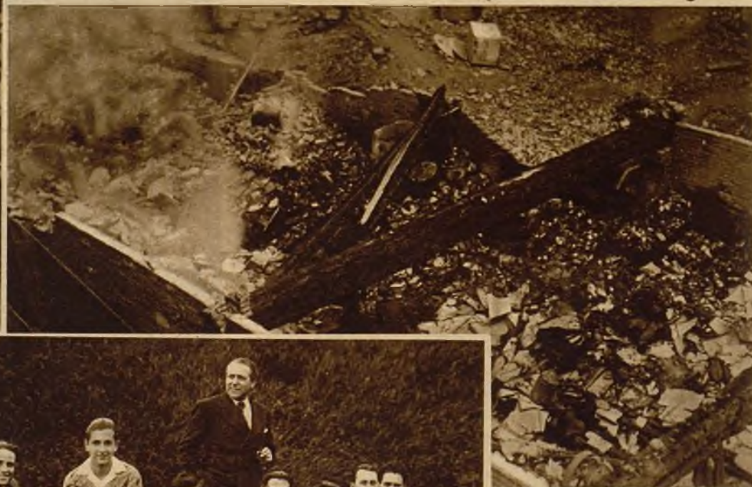
En Lérida ha sido destruída por un incendio una fábrica de productos químicos propiedad de don Enrique Sempán. Las pérdidas se calculan en más de 150.000 pesetas. En la foto, uno de los patios que quedó arrasado