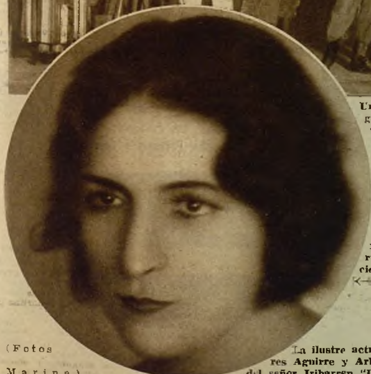
La gran pianista catalana Mercedes Pedrosa, consagrada por los públicos de Europa y América, que ha deleitado con su magnífico arte a la numerosa concurrencia que acudió a oír su concierto del pasado lunes en la sala del Hotel Palace