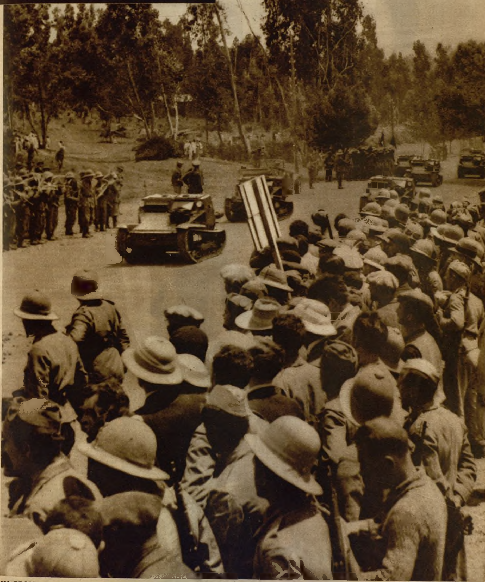
UN GRAN DESFILE MILITAR EN ADDIS ABEBA.—Las grandes concentraciones de tropas italianas en la conquistada capital de Abisinia han realizado un gran desfile ante el mariscal Badoglio, tomando parte todas las fuerzas motorizadas. Un momento del paso, ante el generalísimo, de los carros de asalto