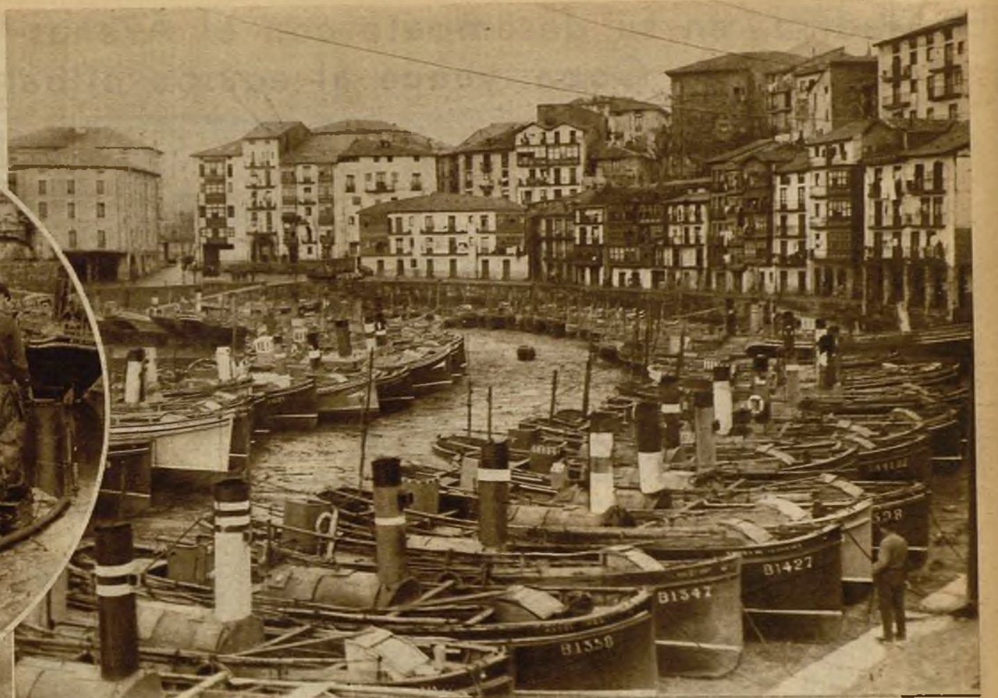
El frecuente espectáculo de los barcos en paro forzoso en los puertos cantábricos. En el círculo de la izquierda, un grupo de pescadores a quienes la falta de pesca hace dedicarse a otras tareas

pagación de la pesca de arrastre entraña su desaparición, y contra esto se rebela instintivamente.