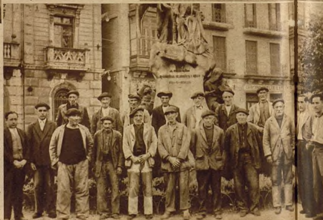
Viejos obreros del mar a quienes socorrió la Cofradía de Pescadores. Exhaustos los fondos de ésta, han quedado en completo desamparo

Es también el pescador—todo hay que decirlo—poco propicio a adaptarse a un espíritu moderno profesional. Se resiste a toda transformación y rechaza tícidamente toda innovación que tienda a mejorar y hacer menos penosos los medios de pesca, a modernizar los instrumentos de su trabajo. Parece como si quisiera perpetuar la lucha con el mar en los mismos términos en que la mantuvieron sus antepasados.