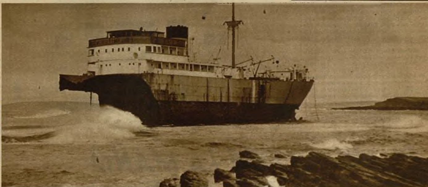
El barco sueco "Gunnaren", que en Orkney Island chocó contra las rocas, resultando con la proa destrozada. La tripulación logró salvarse