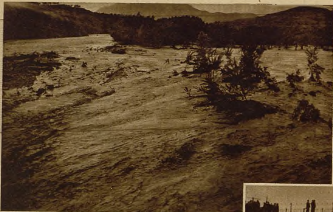
En Arnedo (Logroño), las aguas desbordadas del Clidacos han inundado las huertas, produciendo daños de gran importancia. A la derecha, un aspecto de la enorme crecida del río Alhama en Corella (Navarra)