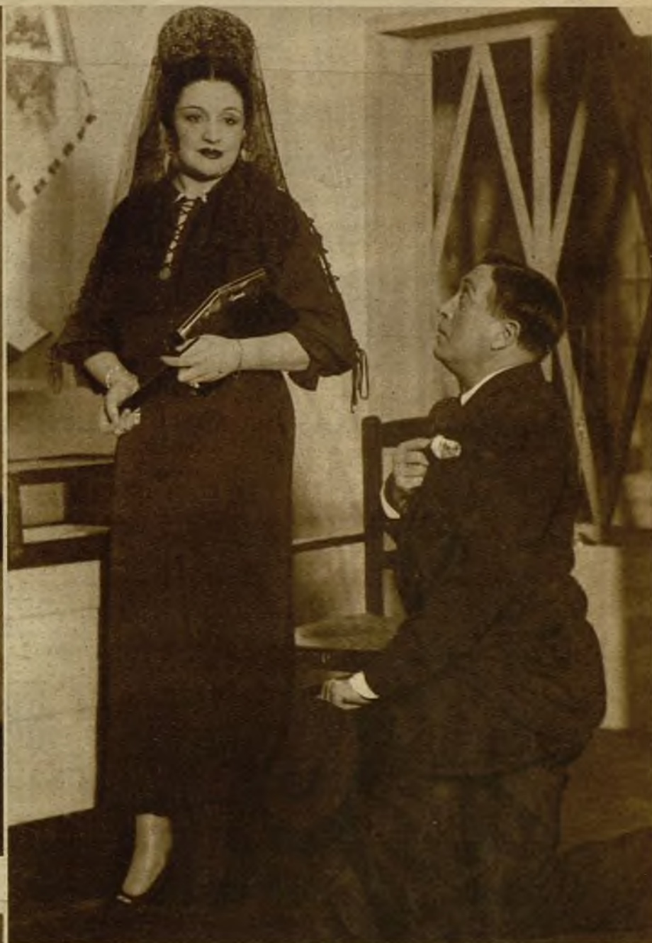
La ilustre actriz Carmen Díaz y el notable actor Rafael Bardén, en otra escena de "Mi hermana Concha", último estreno del teatro Cómico