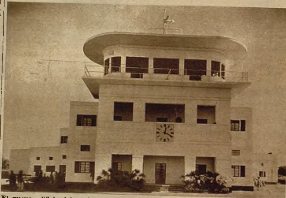
El nuevo edificio del aeródromo de Delhi (India), en el cual se ha instalado una moderna y potentísima instalación de altavoces para el servicio del campo de aviación

He aquí para la radio dos nuevos empleos bien importantes."