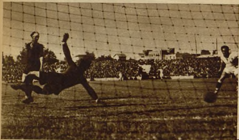
El guardameta del Arenas rechaza un tiro peligroso, que convierte en "corner"

El Madrid, en su desempate con el Arenas para la clasificación de Copa, vence al equipo bilbaíno por 6-1