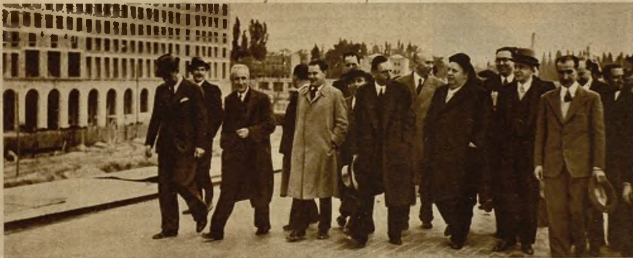
La Comisión de Obras Públicas con los técnicos y periodistas, durante la visita que ayer hicieron a las obras de los futuros ministerios