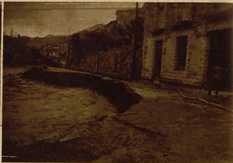
En Cervera del Río Alhama las aguas han socavado la carretera general en un extenso trozo, hasta los mismos muros de las casas