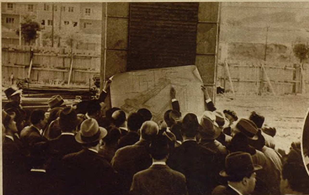
Los miembros de la Comisión de Obras Públicas examinando los planos de los edificios en construcción