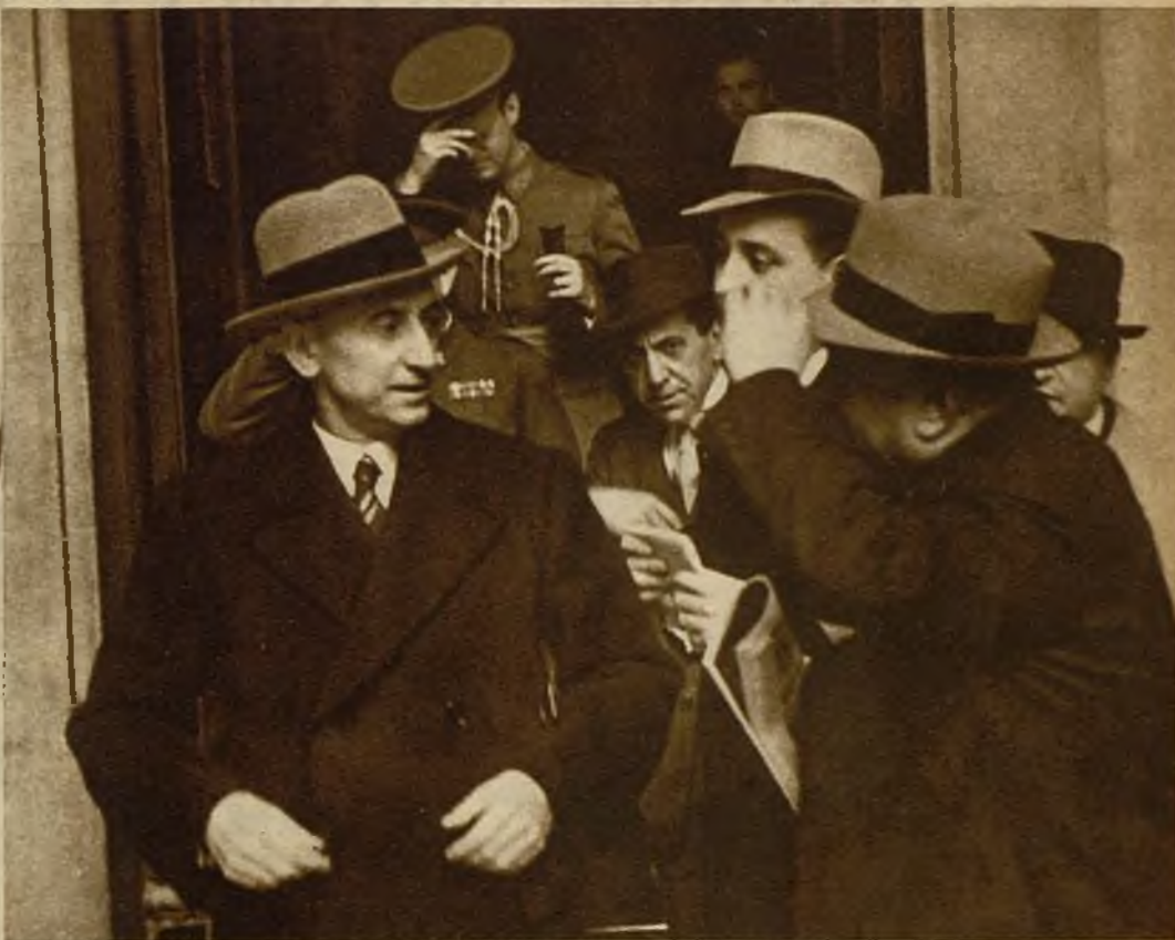
El jefe del Gobierno al salir del Palacio Nacional, después de la reunión del Gabinete bajo la presidencia del Jefe del Estado