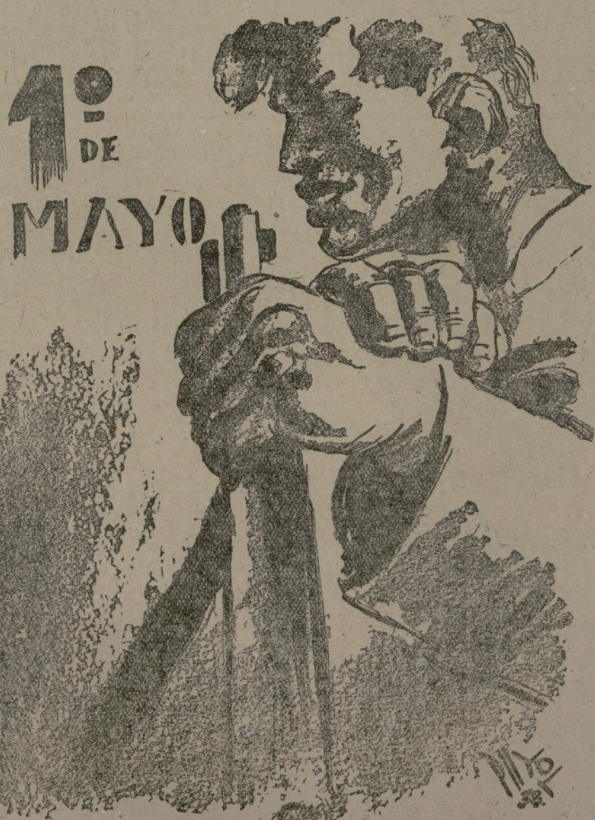
¡Miles de nuevos jóvenes voluntarios para formar la gran columna de la victoria sobre los invasores!

EN EL PRIMERO Y 2 DE MAYO DE 1938, por Payol