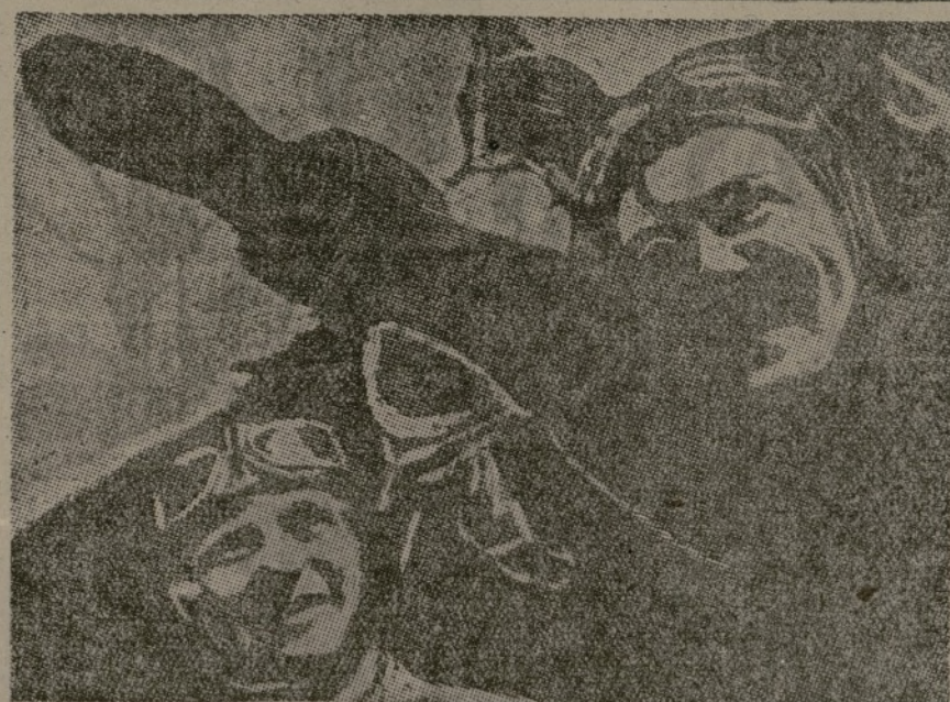
Aviadores de la juventud, aviadore del pueblo: ¡Defended con más bravura que nunca el cielo de nuestra Patria!

BERLIN, 30.—La Prensa alemana dice que Hitler será acompañado en su visita a Mussolini por una importante delegación, y que los dos dictadores tratarán de la cuestión española, de la situación en el Mediterráneo después del Acuerdo angloitaliano y del resultado de las conversaciones francobritánicas.—Fabra.