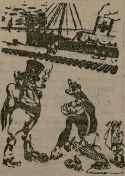
MUSSOLINI.—Cuando quieras puede regir nuestro Pacto. Ya nos que "retiro" mis "voluntarios".