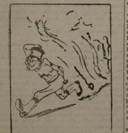
Los japoneses corren en la China del Norte

Terminó diciendo que estima necesarias las negociaciones con los alemanes y con todas las minorías, y señaló que el Gobierno cumplirá con su misión, nacional y europea.—Fabra.