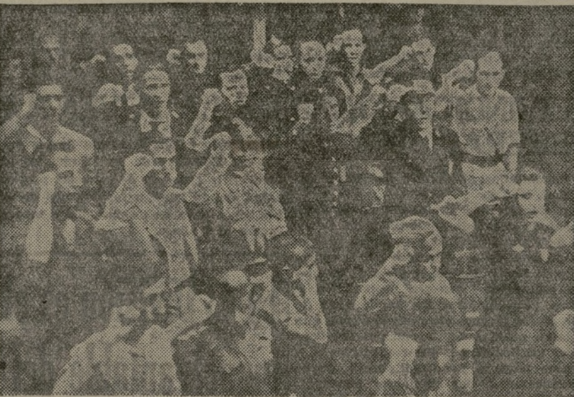
Los delegados, en un intervalo, saludan a los acordes de la "Joven Guardia"