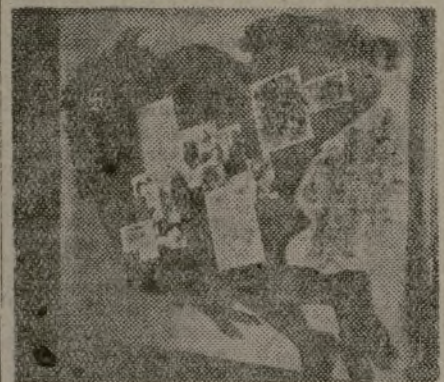
Entre los cinco murales expuestos por la J. S. U. está el titulado "Invasión"

res de JUVENTUD-HISTORIA DE LA GUERRA! Encerrar, en un plano de tamaño justo, con unos pocos rasgos gráficos, elegantes y desembarazados, en media docena de fotos y cinco fechas anecdóticas, la verdadera historia, la historia política de la guerra... es algo que os acredita no sólo como enemigo a muerte del fascismo, sino como "enemigo mortal de necesidad" de él, porque el fusil pudiera abatirse; el grito alocado, ahogarse; el ademán desesperado, contener-