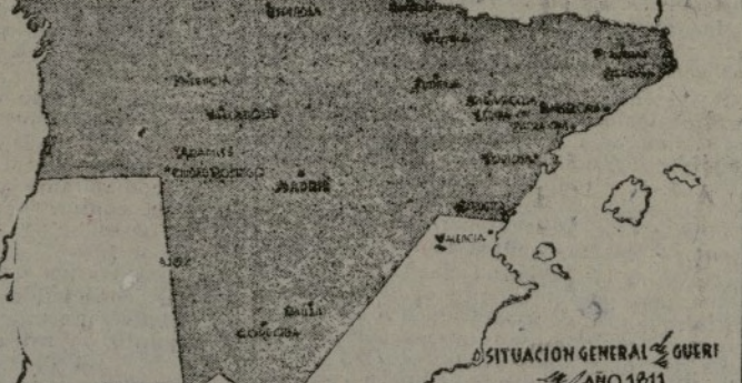
SITUACION GENERAL GUERRA AÑO 1911

nuestros gloriosos antepasados supieron derrotar a las tropas invasoras de Bonaparte. ¡España será independiente! ¡Viva España! ¡Atrás el fascismo invasor!