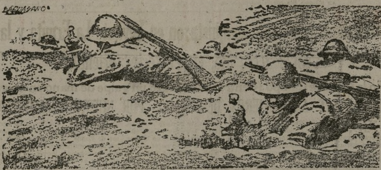
¡FIRMES EN LA RESISTENCIA!

EL GOBIERNO ESPAÑOL ACUSA RECIBO DEL PLAN BRITANICO