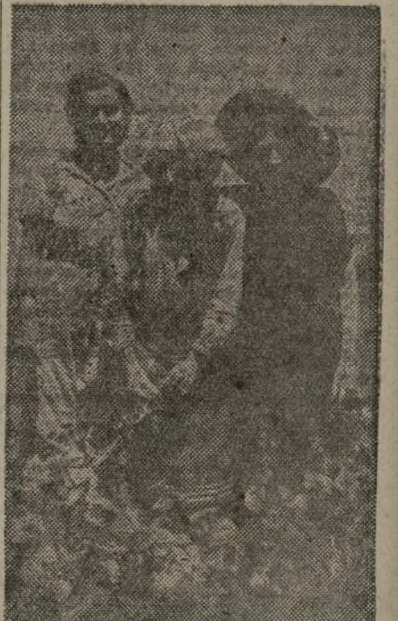
Alianza—donde está la aspiración de los jóvenes todos de Carabaña—sepa unirlos, y así hacer de nuestro pueblo el ejemplo en que se mire todo el pueblo español.

Ahora, cuando se acercan muchos más días de sacrificio, que el Consejo de la