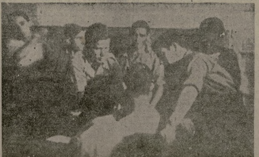
Mesón y Claudín escuchan con todo interés los relatos que los voluntarios de la J. S. U. hacen de su vida de campaña

les hace falta, en qué puede ayudarles la Organización. Al principio, no se atreven a contestar. Después, se familiarizan y piden algo, desordenadamente.