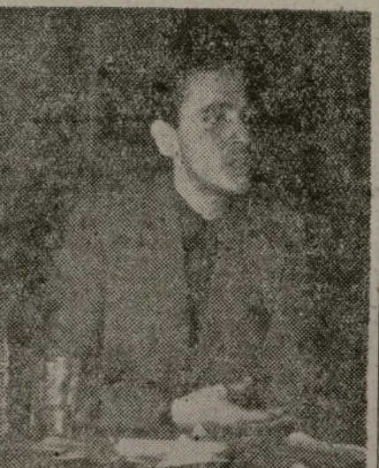
movimiento deportivo de nuestra juventud.

Uno de los pasos más trascendentales en este aspecto se ha conseguido con la unidad de toda la juventud en torno al deporte. Pero no es esto suficiente. Se necesita también unificar todas las acti-