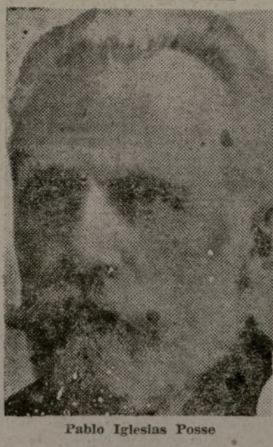
Pablo Iglesias Posse