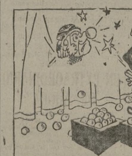
CHAMBERLAIN.—Has visto, John, qué fácil es evitar la guerra?...