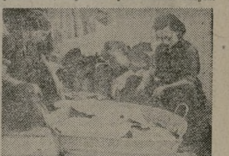
Talleres bien dotados de medios de trabajo procedentes totalmente de recuperación.

pléndidos talleres de desinfección, desinsectación, lavado, tintorería, costura, planchado, zapatería y servicios anejos.