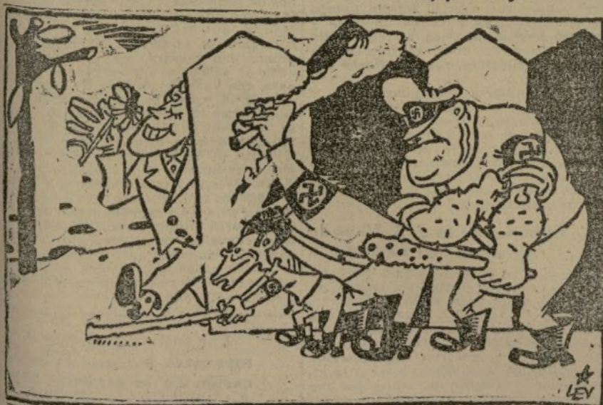
EL RECLUTAMIENTO DE "VOLUNTARIOS"

"El Partido Socialista y el Partido Comunista pueden venir a este acto a decirnos en qué medida trabajan por la unificación, hecha ya entre vosotros, y que, PARA DESHACERLA, NO TENDRAN, OÍDLO BIEN, NI UN GRAMO DE COLABORACION DE LOS ORGANISMOS DIRECTORES DE NUESTRO PARTIDO"