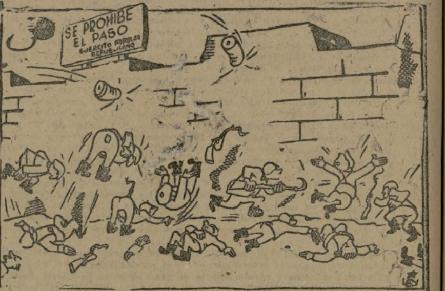
En el Este, en Levante y en Extremadura, tortillas de "macarronis" con cachos de cuerno.

EN TORNO A CHECOSLOVAQUIA LA PRENSA DE PARIS Y LONDRES, ATENTA AL DISCURSO QUE VA A PRONUNCIAR JOHN SIMON