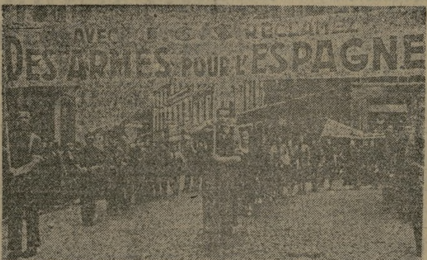
Las masas de la juventud proletaria y antifascista del mundo se movilizan constantemente en sus respectivos países en la ayuda y solidaridad con el pueblo español.

El embajador alemán manifestó que algunos medios militares checoslovacos "agresión no provocada".—Fabra.