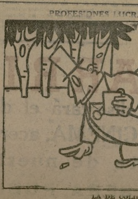
LA DE COLLIERE

La Mesa de la Unión Sindical ha decidido: Primero. Organizar en París, el 2 de septiembre, a las seis de la tarde, en la plaza de la Nación, una manifestación. Segundo. Pedir a la C. G. T. que se asocie a esta manifestación. Tercero. Pedir a la C. G. T. que intervenga cerca de la S. S. I. para que ésta precise la posición del proletariado internacional sobre la defensa de la ley de Cuarenta horas en Francia. Cuarto. Convocar una conferencia regional de Comités de parados de la región parisense.