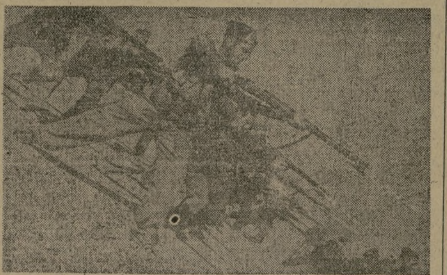
Nuestro Ejército se capacita sin descanso y de todas las formas: técnica, política, cultural, físicamente. La causa de la independencia patria exige una juventud culta y fuerte e inflamada de patriotismo. ¡La juventud que forma en las filas del Ejército popular se esforzará cada vez más por ser, en estos momentos de nuestra dura lucha, digna de España en la guerra implacable contra la invasión!