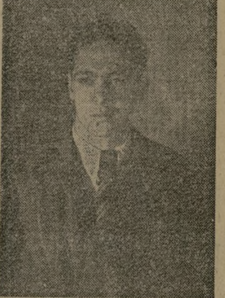
Meditando sobre este cincuenta aniversario ha venido a mi memoria el recuerdo de la Casa del Pueblo de Madrid. Esa casa de fachadas claras, donde han