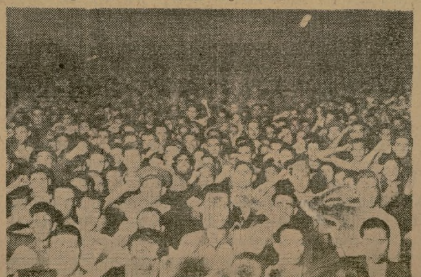
Esta fotografía da idea de la inmensa multitud de jóvenes venida de todas las regiones de la zona Centro-Sur a escuchar el discurso del camarada Santiago Carrillo

nal, pues, además de los miles de jóvenes presentes, la Comisión Ejecutiva ha recibido millares de adhesiones del frente y de la retaguardia, algunas de las cuales lee entre grandes aplausos. Seguidamente concede la palabra al camarada Santiago Carrillo.