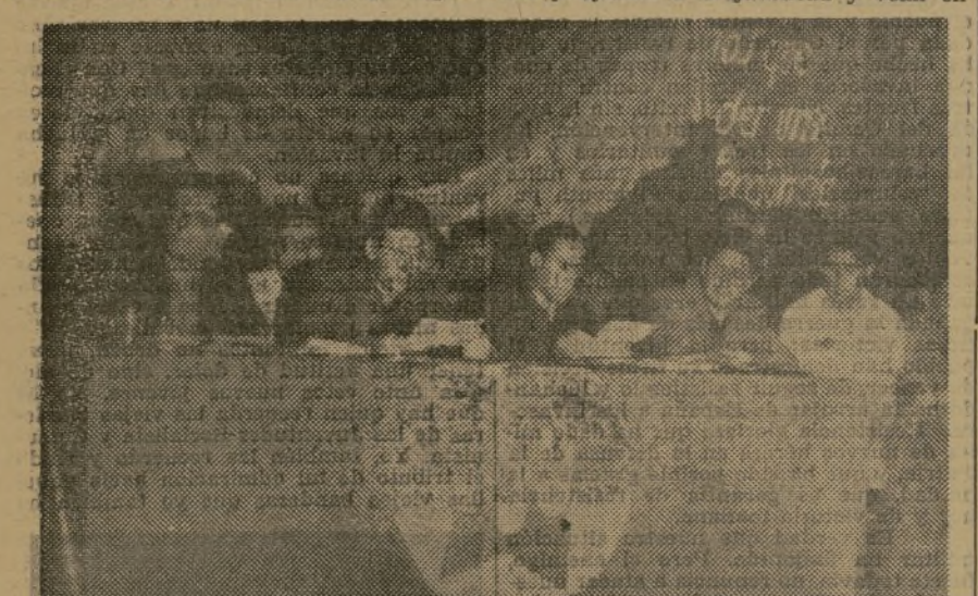
Junto a Claudín, los camaradas de nuestra Comisión Ejecutiva siguieron con su atención, desde la presidencia del acto, el magnífico discurso de nuestro secretario general, camarada Carrillo.