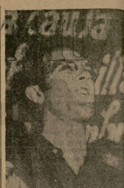
Camarada Jesús Hernández, miembro del Buró Político del Partido Comunista de España, y comisario general de la Agrupación de Ejércitos de la zona no catalana, que pronunció unas emocionadas palabras de saludo y estímulo a la juventud en el acto del Monumental.

EXTREMADURA.—Las fuerzas españolas rechazaron energicamente un gol-