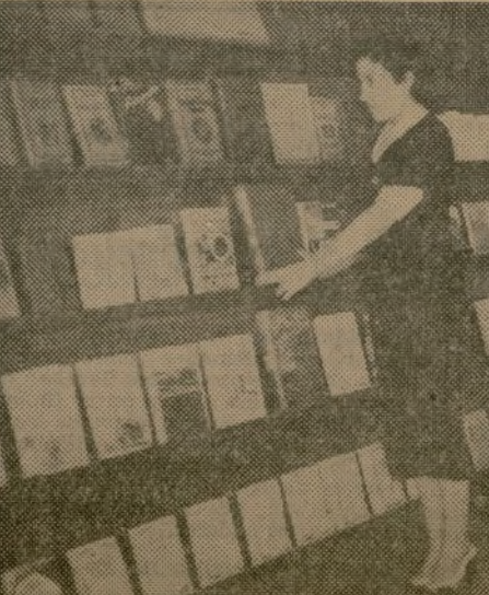
Un aspecto de la Exposición y venta de libros inaugurada por la Distribuidora Juvenil en General Orta, 51, por el Ayuntamiento de Madrid

Un lugar importante le está reservado a nuestra Distribuidora Juvenil cuyo mo-