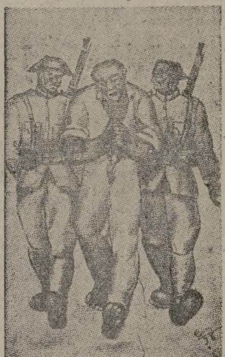
"El Cristo moderno" (Boceto)

El arte tiene excelentes y vigorosas manifestaciones en la guerra. Prueba de