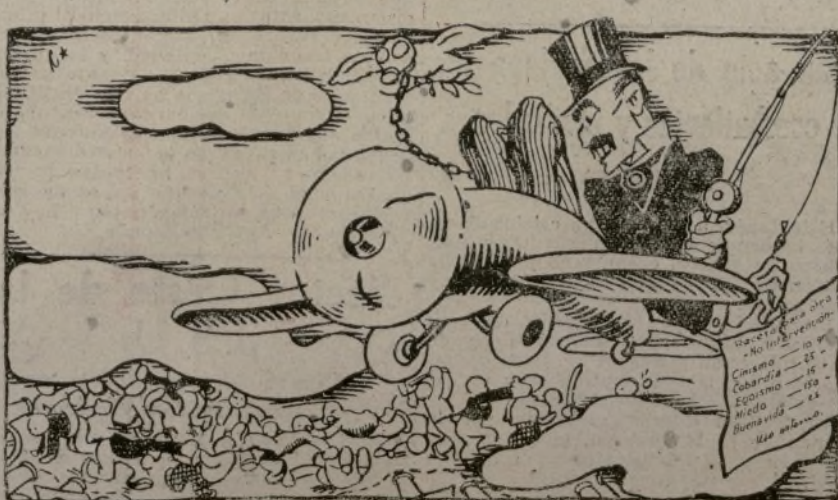
A RIO REVUELTO...