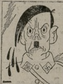
El verdadero Heinlein

Una noticia trascendental comunican a última hora las Agencias: la orden de detención de Heinlein, el