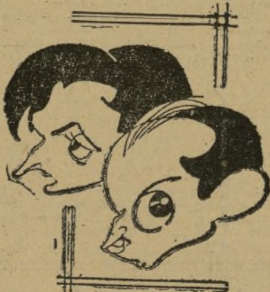
El director y el redactor jefe de "Reflejos"

En el archivo de la redacción se hallan recopiladas todas las ediciones. A la puerta, en un artístico tablero, se hace