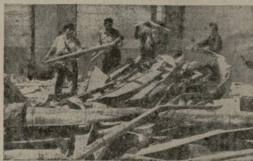
En la Brigada no se descansa. Los soldados, magníficamente dirigidos, amontonan kilo tras kilo y cuentan por toneladas

He aquí una cifra muy significativa de cómo trabaja la Brigada. Cuando he querido conocer detalles del comandante Pablo, como familiarmente se le conoce, he podido obtener uno solo: "la Brigada". Y es que el trabajo se realiza de una forma organizada, ordenada y metódica, llevando un mismo ritmo y una misma vo-