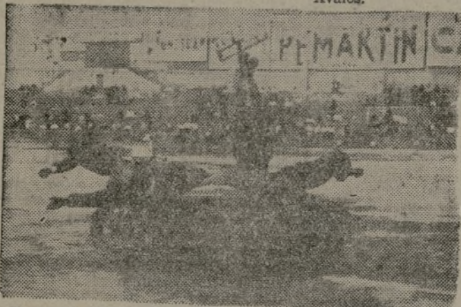
Motoristas del primer Batallón de Enlace, en uno de sus arriesgados y apasionados ejercicios.

El pasado domingo, en el campo de aviación de Chamartín, tuvo lugar la entrega de una bandera y seis banderines al Batallón de Enlace del Ejército del Centro, en nombre de la Sección Oeste de los A. U. S. Una gran exhibición de moto como final.