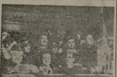
El general Miaja, también asistió al acto del primer Batallón de Enlace

Tras de un desfile de una representación de las fuerzas del Batallón—una Sección motorizada completamente equipada, otra de ciclistas y otra de "hombres de cuero", fué al hombre, que presentaban un brillante aspecto—, la camarada Agustina, en nombre de la Sección Oeste de los A. U. S. hizo entrega en palabras patrióticas, de la enseña nacional.