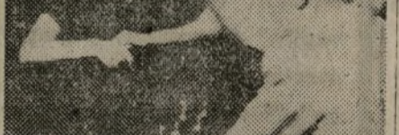
¿Dos futuros campeones del torneo de ajedrez?

Además, todos los combatientes luchan por su porvenir y deben ayudarles en la retaguardia. Recogerán chatarra, mucha chatarra, toda cuanto sea necesaria y aun más; quieren, en una palabra, ser merecedores del nombre que lleva su Club.