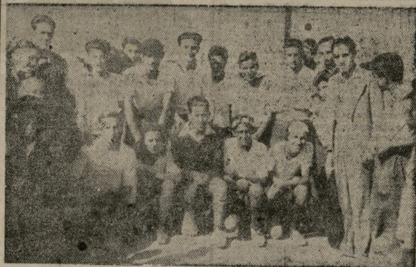
El equipo del Club Atlántida

TROFEO DEFENSA DE MADRID EL CLUB ATLANTIDA OCUPA EL PRIMER LUGAR DE LA CLASIFICACION