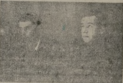
Un piloto de la GLORIOSA y el comisario de la... División, en la presidencia del acto de Albacete

Club de Educación de Aviación; jóvenes obreros de una fábrica de la Subsecretaría de Armamentos;