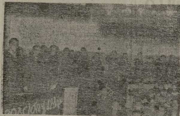
Grupo de soldados de las Brigadas Internacionales que han asistido a las sesiones de la Conferencia de la Solidaridad.