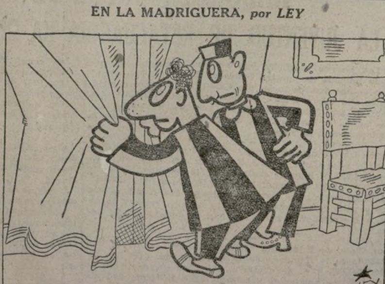
—Estos "rojos"... fíjate; quieren establecer sobre una base indestructible la libertad e independencia de España y la existencia de un régimen democrático de libertad, de progreso y de justicia social; —¿Y dónde viviríamos nosotros?