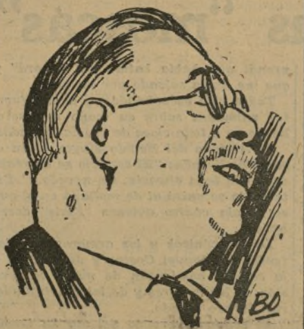
El camarada André Marty, infatigable organizador de las Brigadas Internacionales

sos. Han tenido que atravesar mares y fronteras, valles y montañas. Unos son jóvenes; otros, viejos. A todos les anima el mismo ideal: combatir por el bienestar del pueblo, guerrear por la independencia de nuestra Patria.