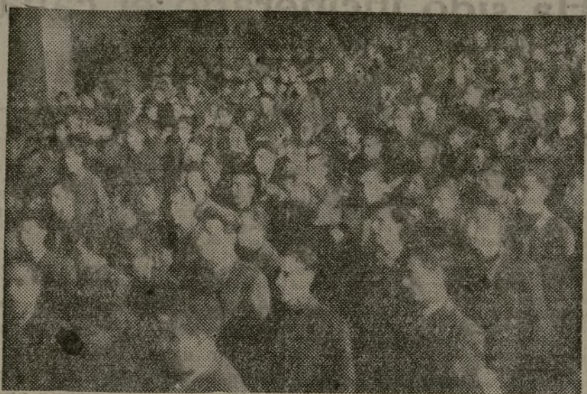
Santiago Carrillo ha dicho: "Hay que unir a todos los jóvenes españoles en defensa de la independencia de España." Y los delegados se han puesto en pie saludando las notas vibrantes de "La Joven Guardia", que han rubricado las palabras de nuestro secretario general

(DEL INFORME DE SANTIAGO CARRILLO EN EL PLENO AMPLIADO)